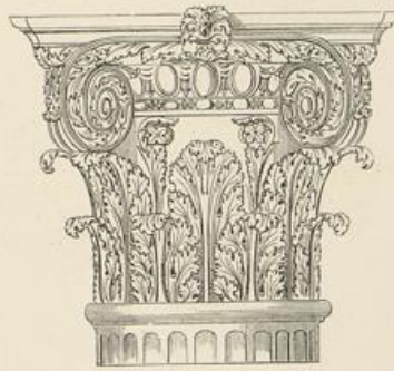
Bogen des Septimus Severus, Rom.

Korinthische und composite Kapitale, verjüngt, aus TAYLOR und CRESY'S Rom.*