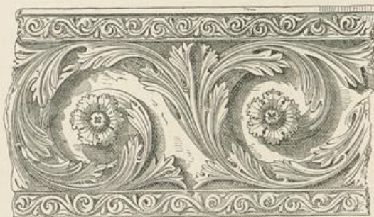
Von der Abtei St. Denis, Paris.

Die ersten Beispiele dieser Veränderung finden sich in der Sophienkirche zu Constantinopel; und wir geben hier ein Muster von St. Denis, in welchem zwar das Schwellen am Stamme sowohl, als