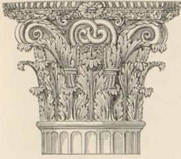
Tempel des Jupiter Stator, Rom.