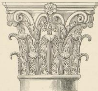
Pantheon, Rom. Porticus.