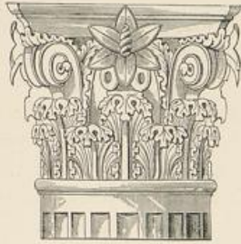
Tempel der Vesta, Tivoli.