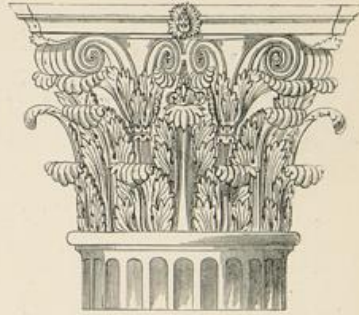
Bogen des Constantin, Rom.