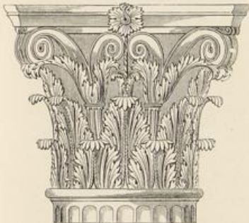
Tempel des Mars Victor, Rom.