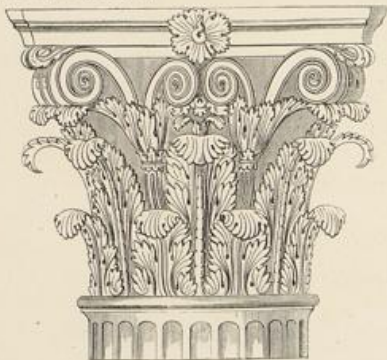
Im Innern des Pantheon, Rom.