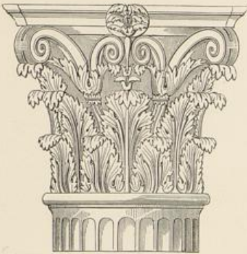
Bogen des Trajan, Ancona.