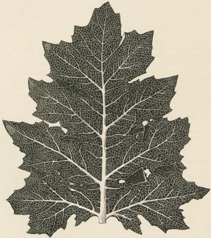
Der Acanthus, vollständige Grösse, nach einer Photographie.

Wir haben es nicht für nöthig erachtet, in dieser Serie einige von den gemalten Verzierungen zu geben, von denen sich manche Reste in den römischen Bädern befinden. Denn erstens standen uns keine zuverlässigen Materialien zu Gebot; überdiess sind sie denen von Pompeji ganz ähnlich, und zeigen vielmehr was man vermeiden, als was man befolgen sollte. Deshalb schien es uns hinlänglich zwei Gegenstände vom Forum des Trajan darzustellen, deren in Schnörkel ausgehende Figuren als die Grundlage dieses, in den römischen gemalten Decorationen so hervorragenden Charakterzuges betrachtet werden können.