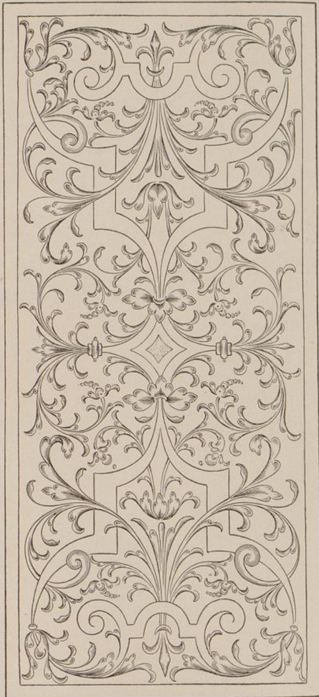
Aus: Boyceau, Traité Du Jardinage [1563].

1574 m . Le Pautre (P.). 5 Bl. Lattenwerk . Gegenstände der vorletzten Folge. I. (!) le Pautre inventor. C. Danckerts Fecit. Justus Danckerts Excudit. Pl. 275: 193.