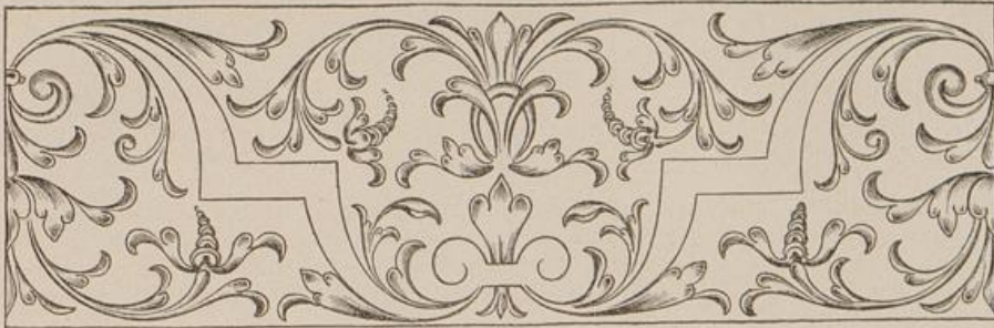
Aus: Boyceau, Traité Du Iardinage [1563].