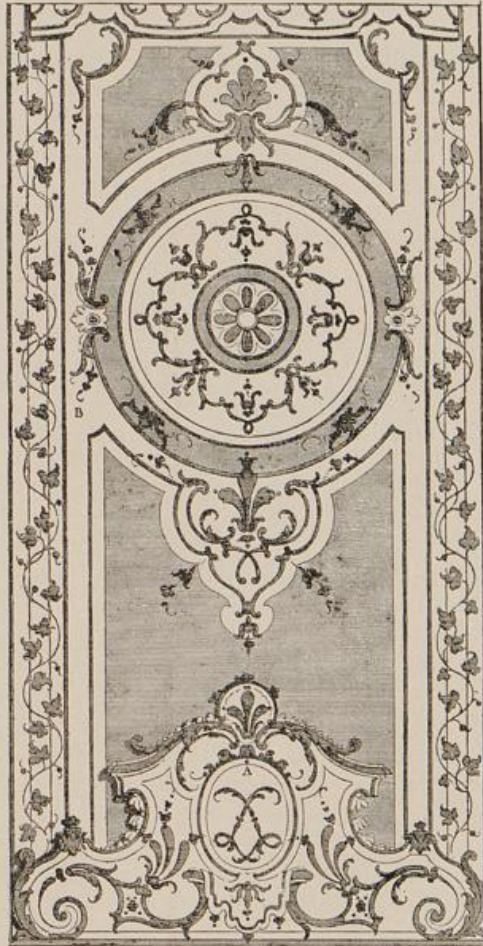
Aus: Pineau, Dessains de Lits [923].