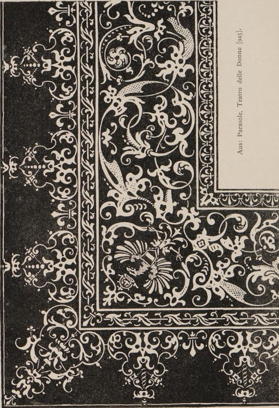
Aus: Parasole, Teatro delle Donne [945].