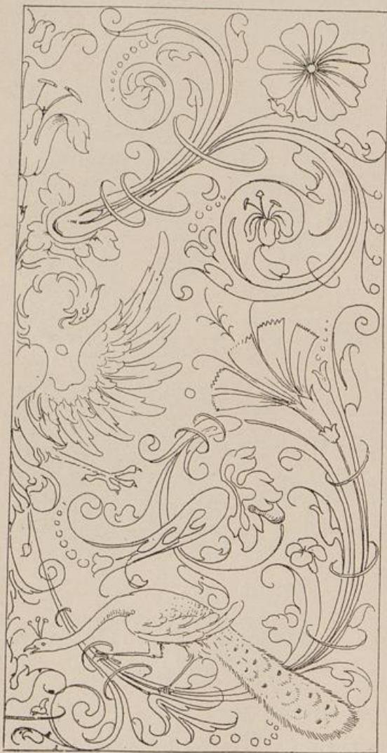
Aus: Bretschneider, Modelbuch [896].

910. Riegl. des Neuen und zum Stricken dienlichen Model Buchs zweyter [dritter] Theil ... zu finden in der Christoph Rieglischen Wittib Kunft u. Buch Laden unter der Vesten Anno 1757. qu. fol. Je 1 Titel u. 9 Bl: Nr. 1—9 bezw. A—I.