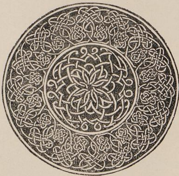
Aus: Stickmuster [890 m ].