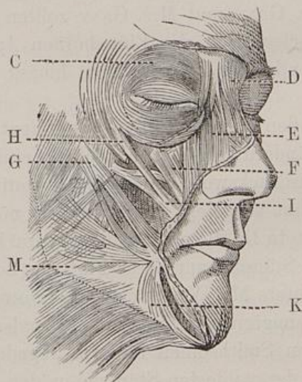
Fig. 2. Abbildung nach Henle.

habe ich eine Zeichnung aus Sir CH. BELL'S Werk copiren und verkleinern lassen (Fig. 1), ebenso zwei andere mit noch sorgfältigeren