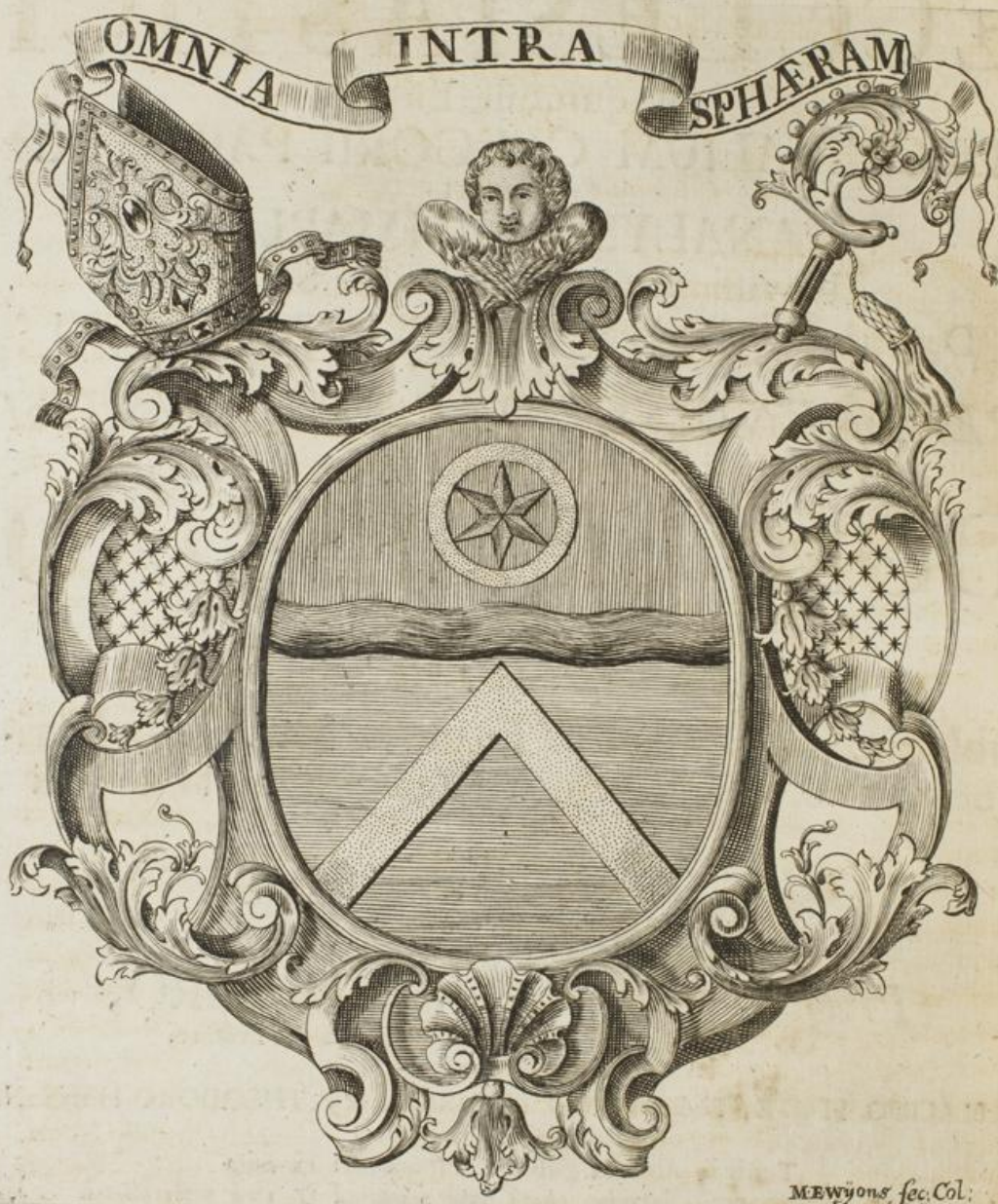
Mewjous sec. Col.