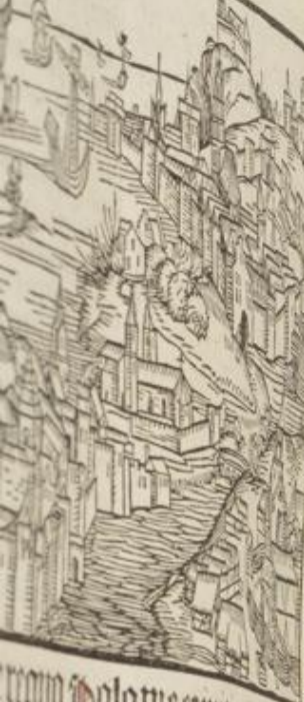
regno Polonie et munitio

Uenia de Ho nos Samacie m postepi me de terra sar quato illa re pposui vasta sub ri mofhos et pam schle gam nomē semit mi Caro Bolq lai dū de man vita pali an an