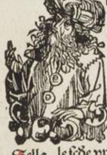
Ada Lamech Sella

A usale enoch filij ceterimo ei z. lxxvij. anno nat⁹ lamech filij habuit q̄ nato duos z octogita supra. lxx. sup̄vixit ānos. z sic matusalē diuī⁹ virisse ferūt oibus q̄s scriptura cōmemorat.