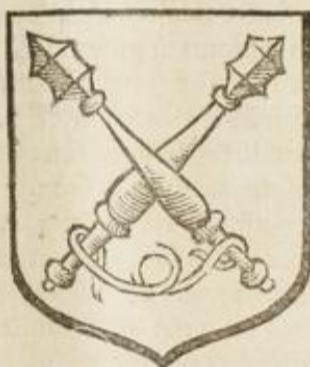
D'or à 2. masses de sable posées en sautoir & liées de guenzes.

L A famille de Gondy est originaire de Florence, où elle a possédé plusieurs charges de cette république. On peut consulter pour les premiers degrez, & pour les différentes branches qui en sont sorties, la Toscane Française par l'Hermitte de Soliers, les Remarques sommaires par Pierre d'Hozier en 1652. & l'hist. genealogique de cette maison par Corbinelli imprimée à Paris en 2. vol. in 4°. l'an 1705. On commencera cette genealogie par celui qui a donné origine aux ducs de Retz, & on n'en rapportera que les branches qui se sont établies en France.