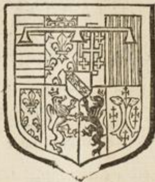
De Lorraine-Guise à la bordure de gueules.