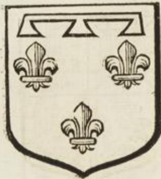
De France au lambel de 3. pendans d'argent.

L E comté de Valois fut érigé en duché & pairie au mois de juillet 1406. en faveur A de LOUIS duc d'Orleans. Voyez cy-devant chapitre XX. page 235.