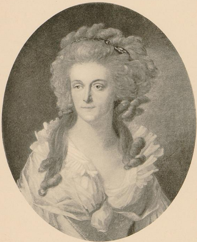
FREDERIKA SOPHIA WILHELMINA VAN PRUISEN.

(Naar het pastel van J. F. A. Tischbein in het Rijksmuseum te Amsterdam.)