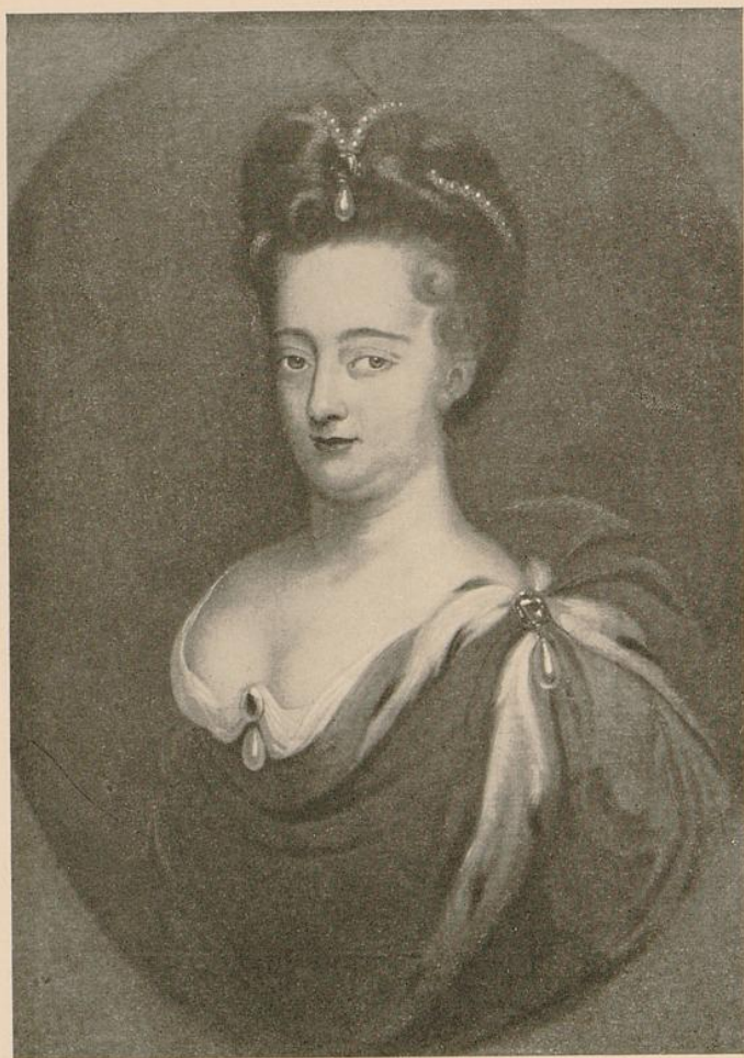
MARIA LOUISE VAN HESSEN-KASSEL.

(Naar de schilderij in het Museum van het Friesch Genootschap te Leeuwarden.)