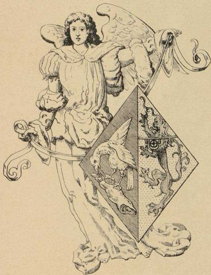
PhotoLith v Arnz ad Pistor & Zn. v Bosch