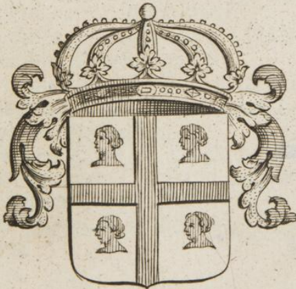
Roi de Sardaigne.