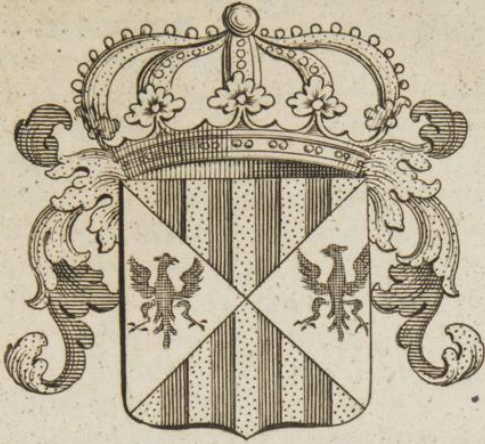
Du Roi de Sicile.