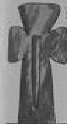
Krössuln 12. — 13.