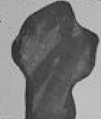
20 „Wetterkreuz“ bei Eisenberg