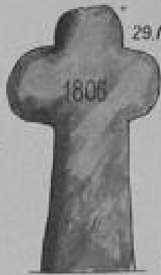
29. Maua 1806