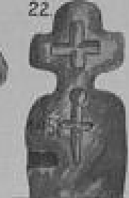
Am Nossen Walde 22.