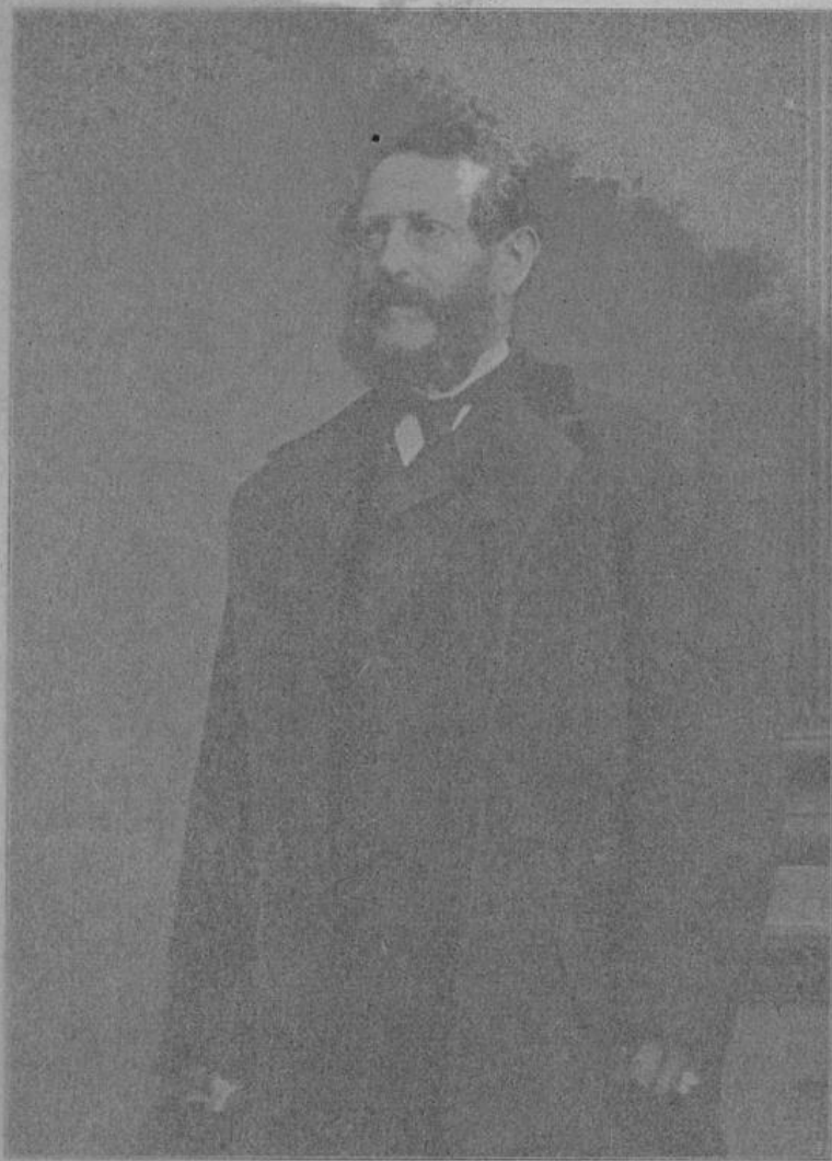
Anton Alex. Graf von Auersperg, Anastasio Grün.