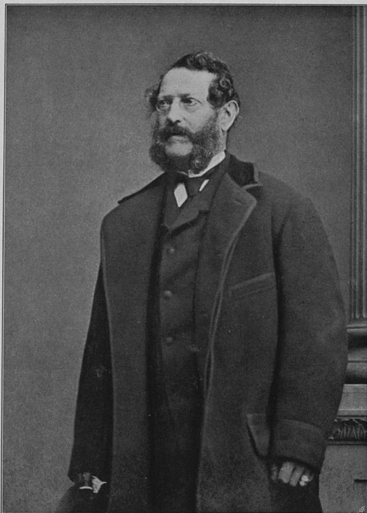
Anton Alex. Graf von Auersperg, Anastasius Grün.