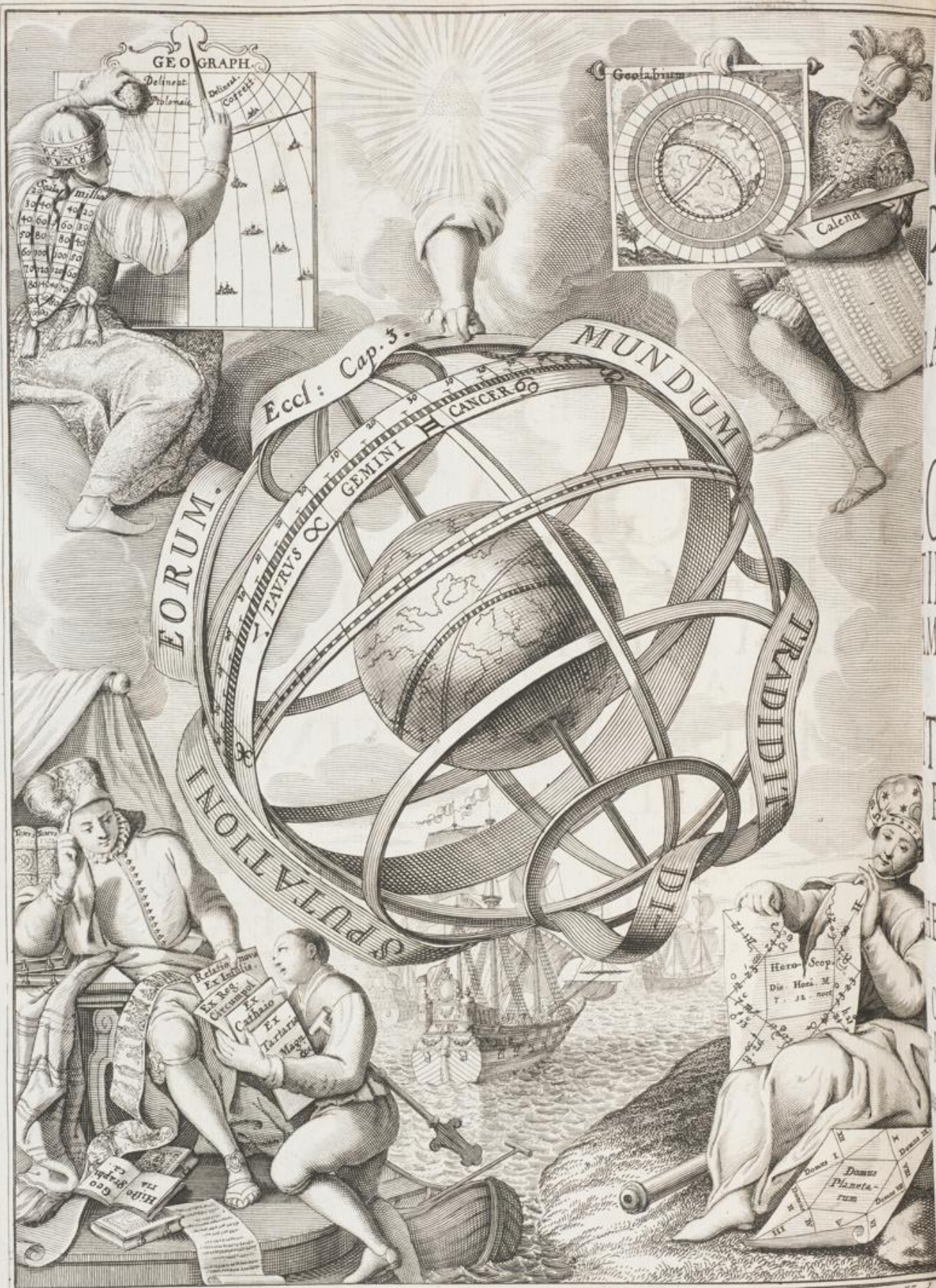
Johann. Degler delineavit.