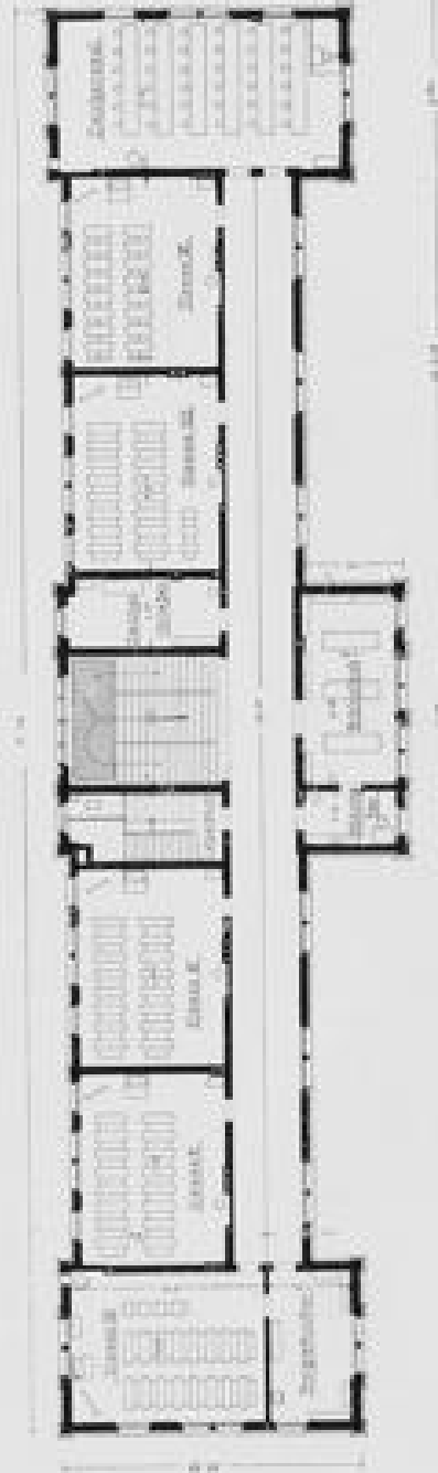
GYMNASIUM THURINGIAE. II. Stock.