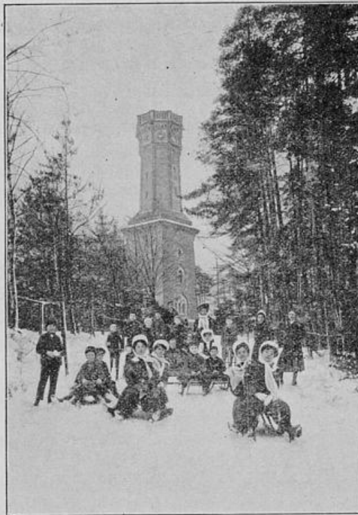
Friedrich-August-Turm auf dem Rochlitzer Berge mit dem Anfange der Rodelbahn.