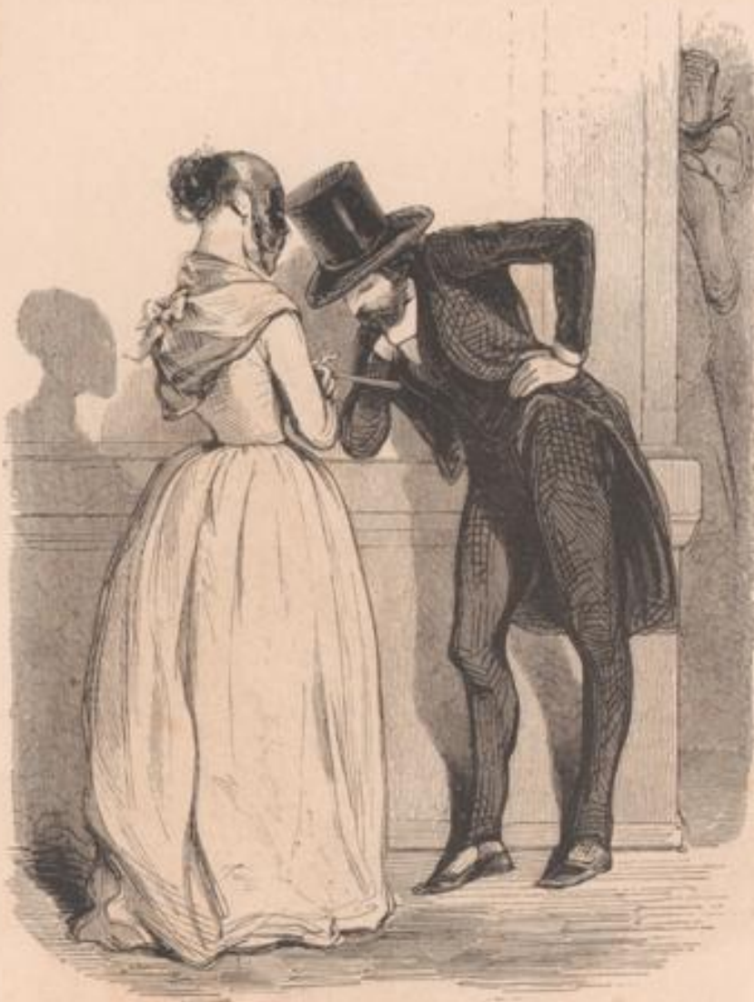
Rue Coquemard, au cinquième; une porte jaune. Ton portier fait des chaufferettes et tu joues de la flûte... ainsi!