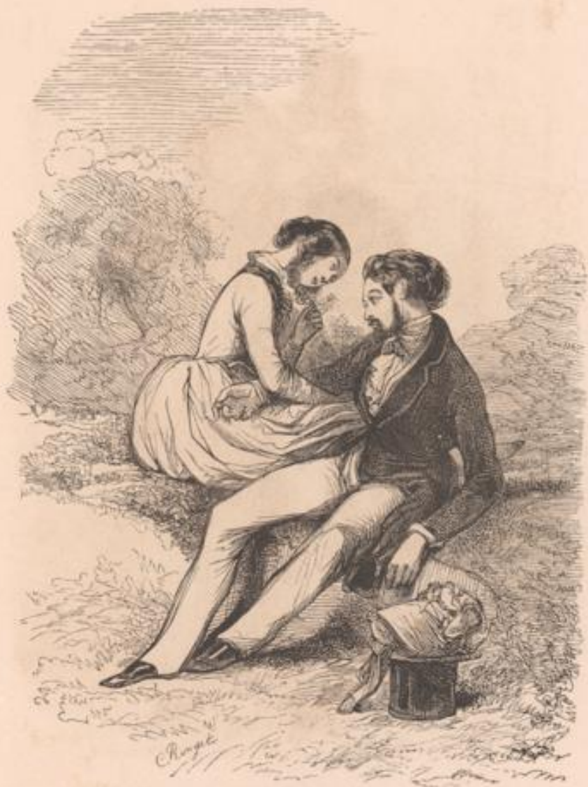
Essaye un peu de ne pas me mener à tous les jugements, quand tu seras procureur du roi, et tu verras!