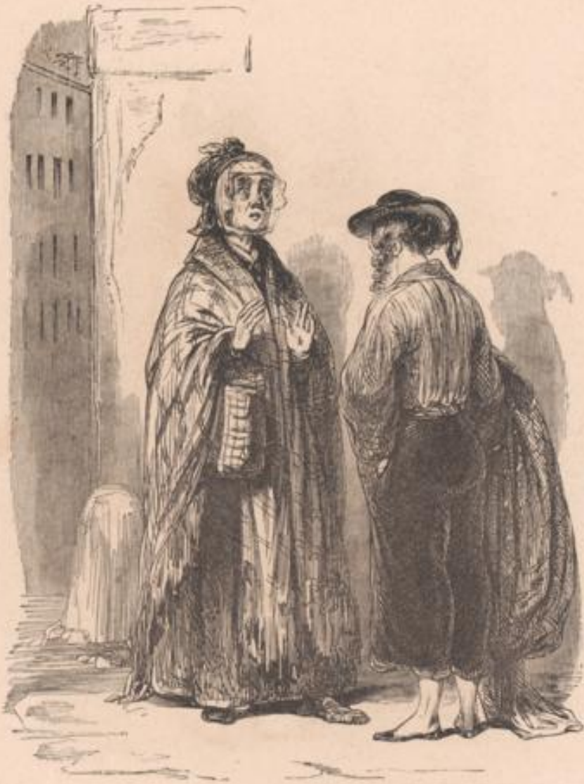
Malheureux enfant! qu'as-tu fait de ton sexe?..