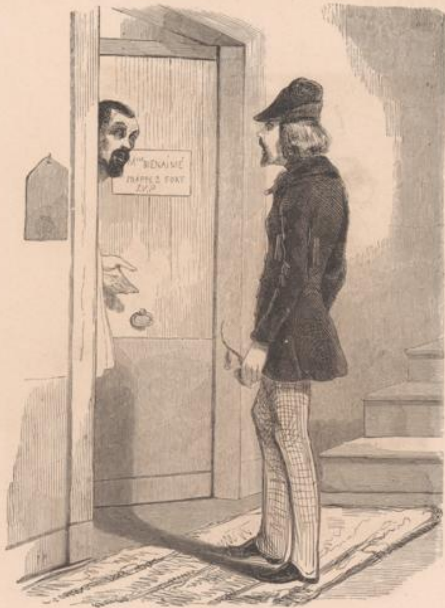
HON BIS IN IDEM! (Axiome de droit.)