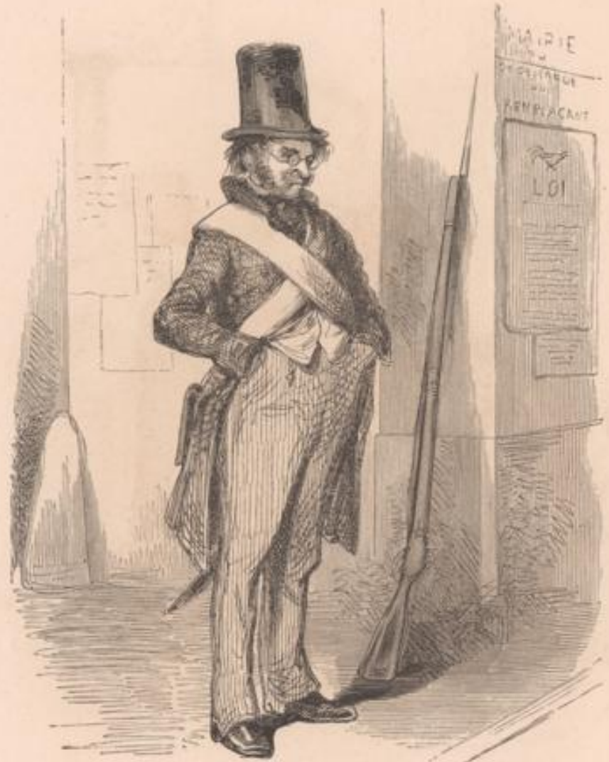
« On demande un remplaçant »