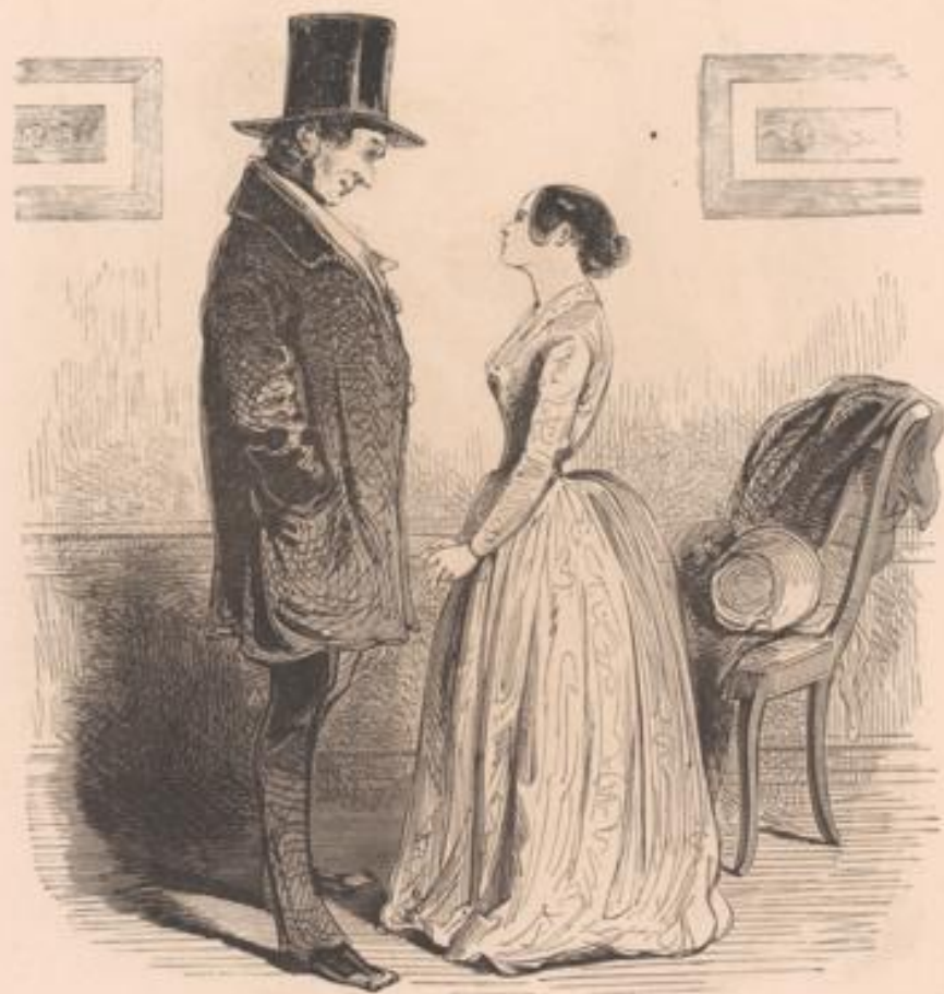
— Voilà un gros Loulou qui vient passer toute la journée avec sa biche, oui! — Mais comment fait-il donc, cet homme-là, pour être gentil comme ça?

Monsieur, Dans la pièce voisine de celle où je dîne sit avec mon épouse, une note de femme, s'adressant à de jolies messieurs, s'est élevée : « Et monsieur Anatole, lequel qui se attend à la Poissonnerie! » et, après des vains efforts, la même voix a repris : « Attendez, attendez, nous jurer! » de se réjouir. Monsieur, de vous donner avis de ce qu'on fait trop Mgr Croqui à toute sa possibilité pour des chagrins bien touchants, qu'on se attend, paraitrait-il de le dire, s'adresse à vous dans des attachements déplorables.