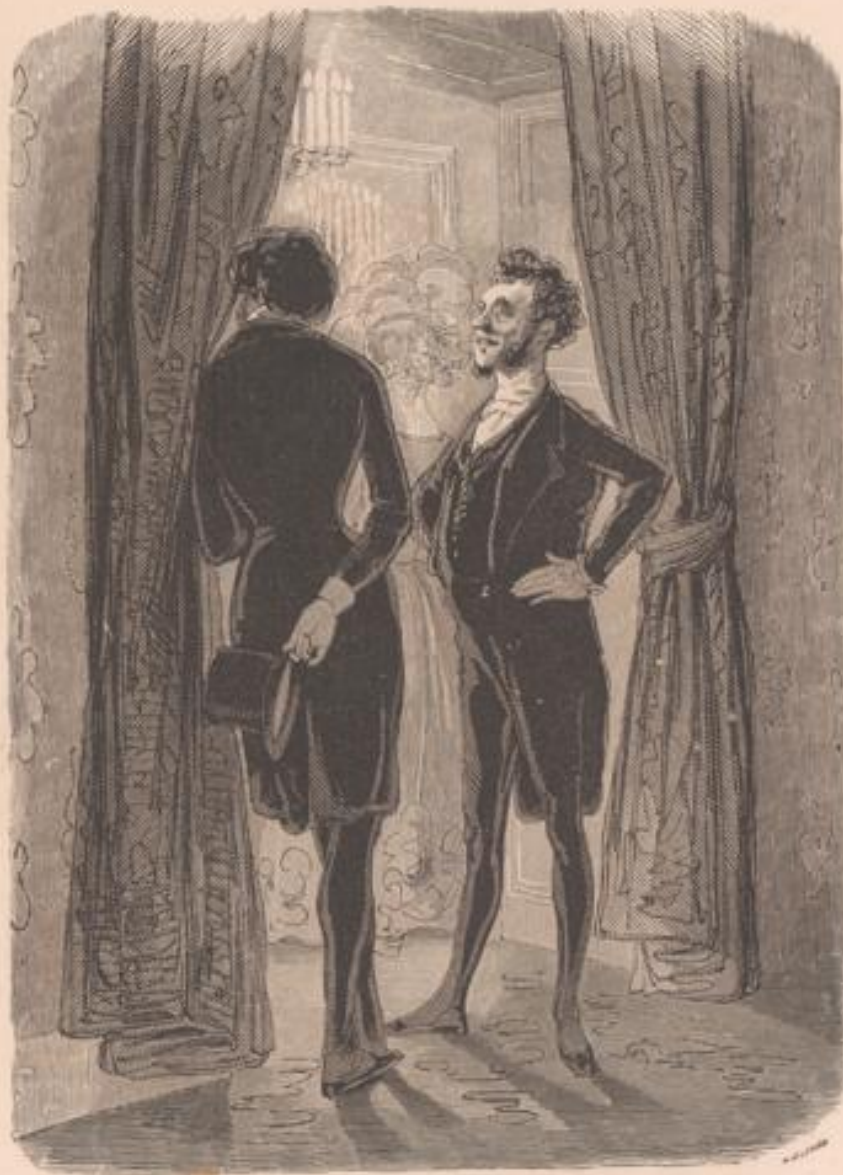
— Voyez, mauvais sujet ! trouvez-vous que nos bals valent bien vos bastringues de la Chaumière ? Est-ce que nos femmes ne valent pas vos grâtes ? — C'est un autre genre, mon cher oncle, mais c'est moins amusant !