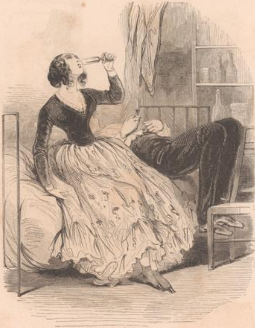
Aux gardes du commerce : que le bon Dieu les patafoie!