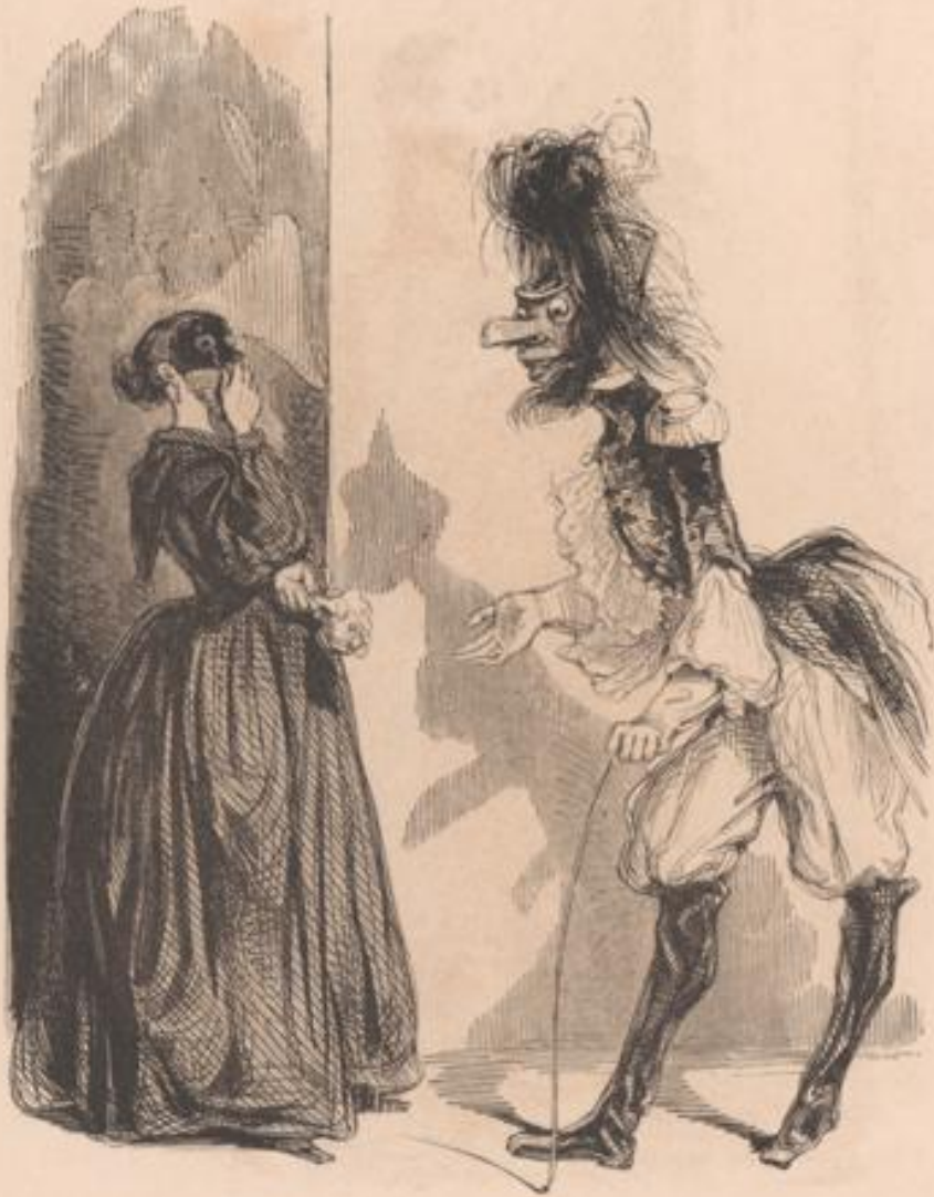
Pas qu'ça d'lorgnon! .. Et du pain? .. Bonjour, ma'ame...