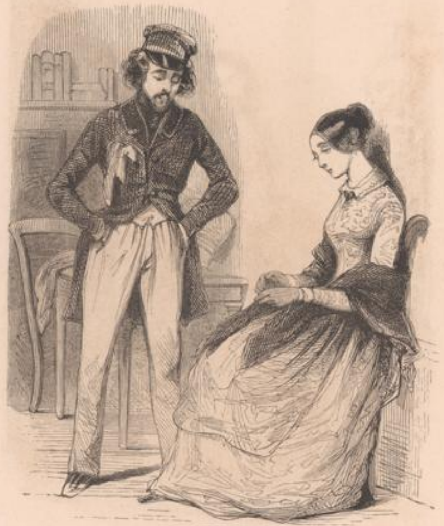
Pas le sou, un jour de Chaumière!