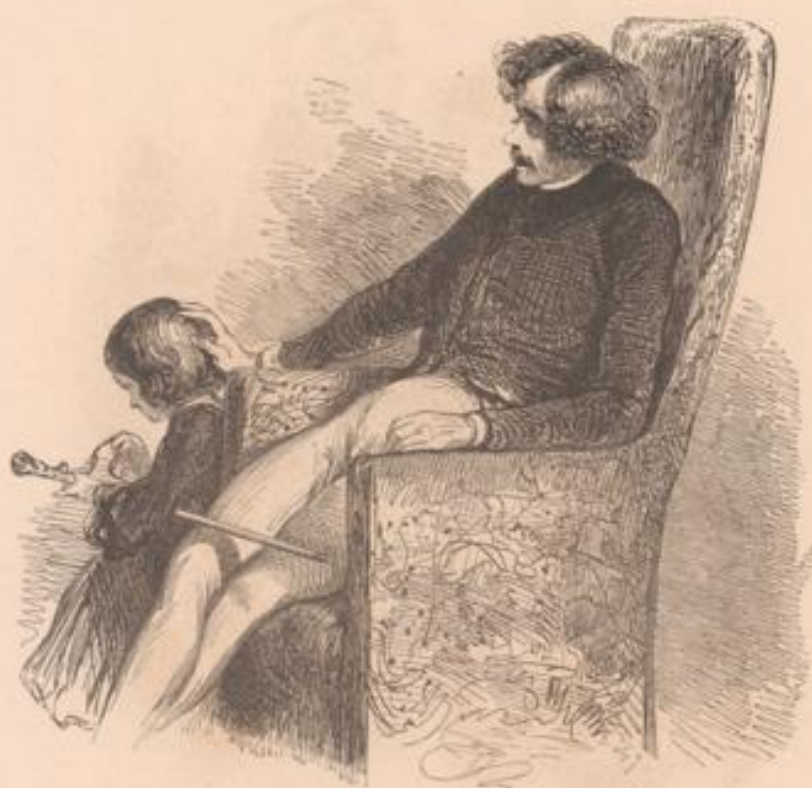
La canne que papa a trouvée dans l'armoire de maman, le jour qu'il était si en colère, elle était bien plus belle que ça!