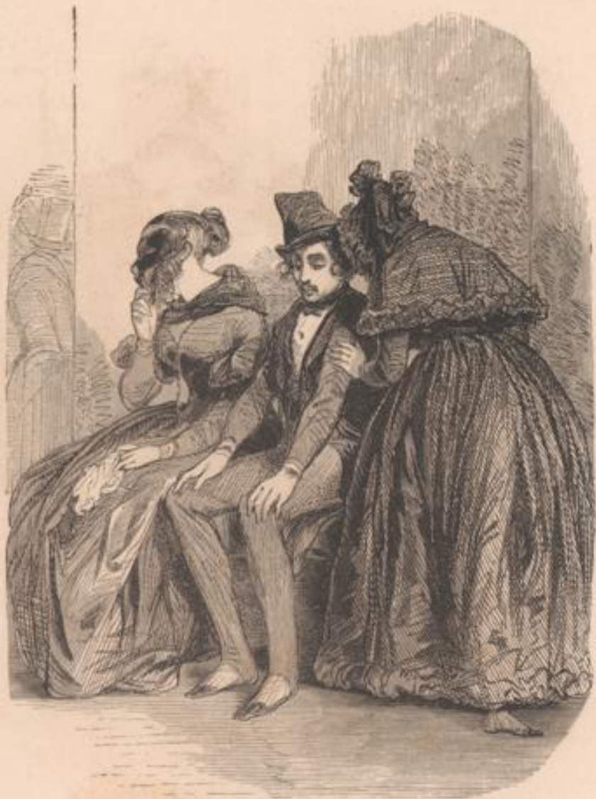
C'est vieux et laid, mon cher, tu es floué comme dans un bois...