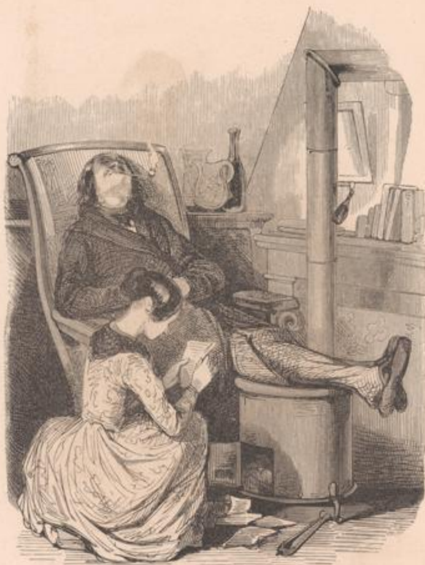
Les lettres de l'anciens

— Voilà mon épouse! attention: j'ai dîné hier avec toi!.. — Où? — Chez .. Guichardy. — Bon!