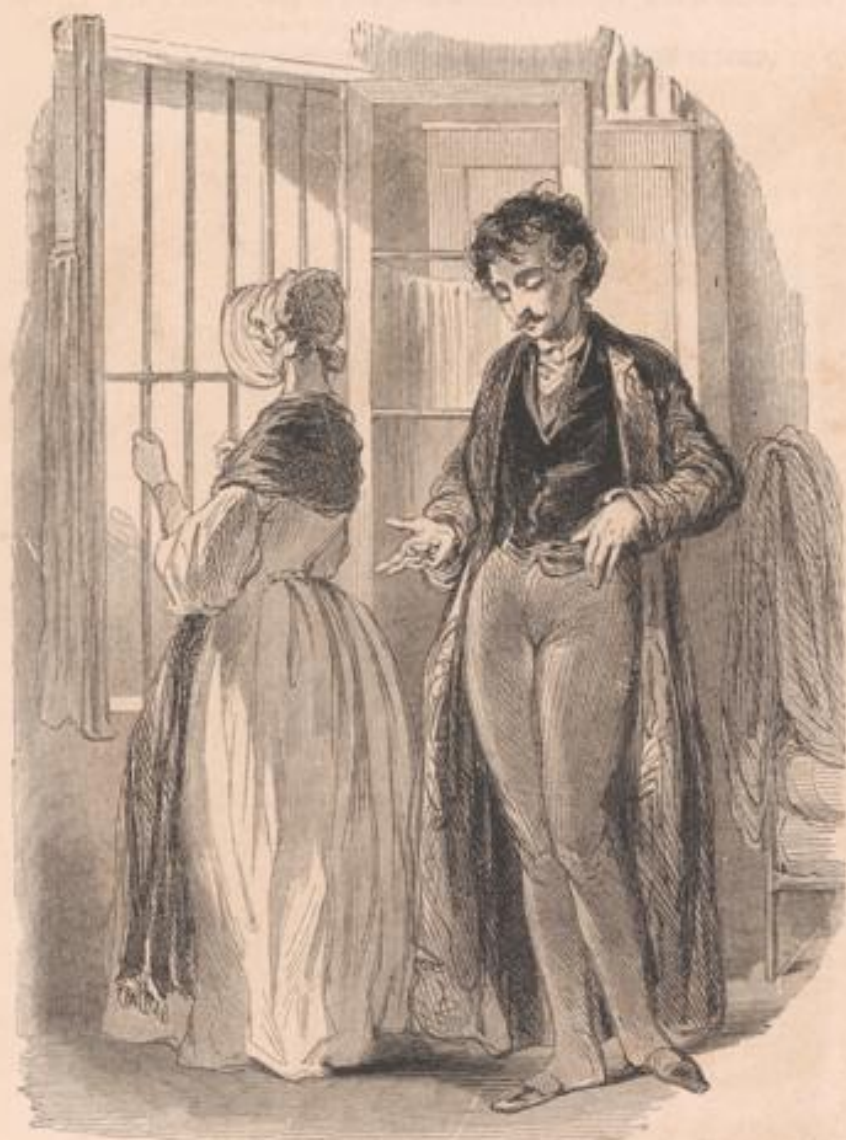
Voyons! pour aller à Tivoli ce soir, il faudrait d'abord payer au greffe dix-huit mille cinq cents francs pour le capital, et onze cent vingt-neuf francs cinquante centimes de frais... et encore, non (je suis bête!). Tivoli coûte trois francs d'entrée, et je n'ai que quarante-deux sous.