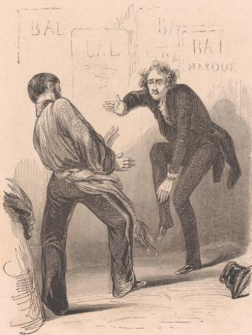
Qu'est-ce que c'est? Tu vous déranges pour ça, et t'en voudrais déjà pus... en v'là un mufe capricieux!