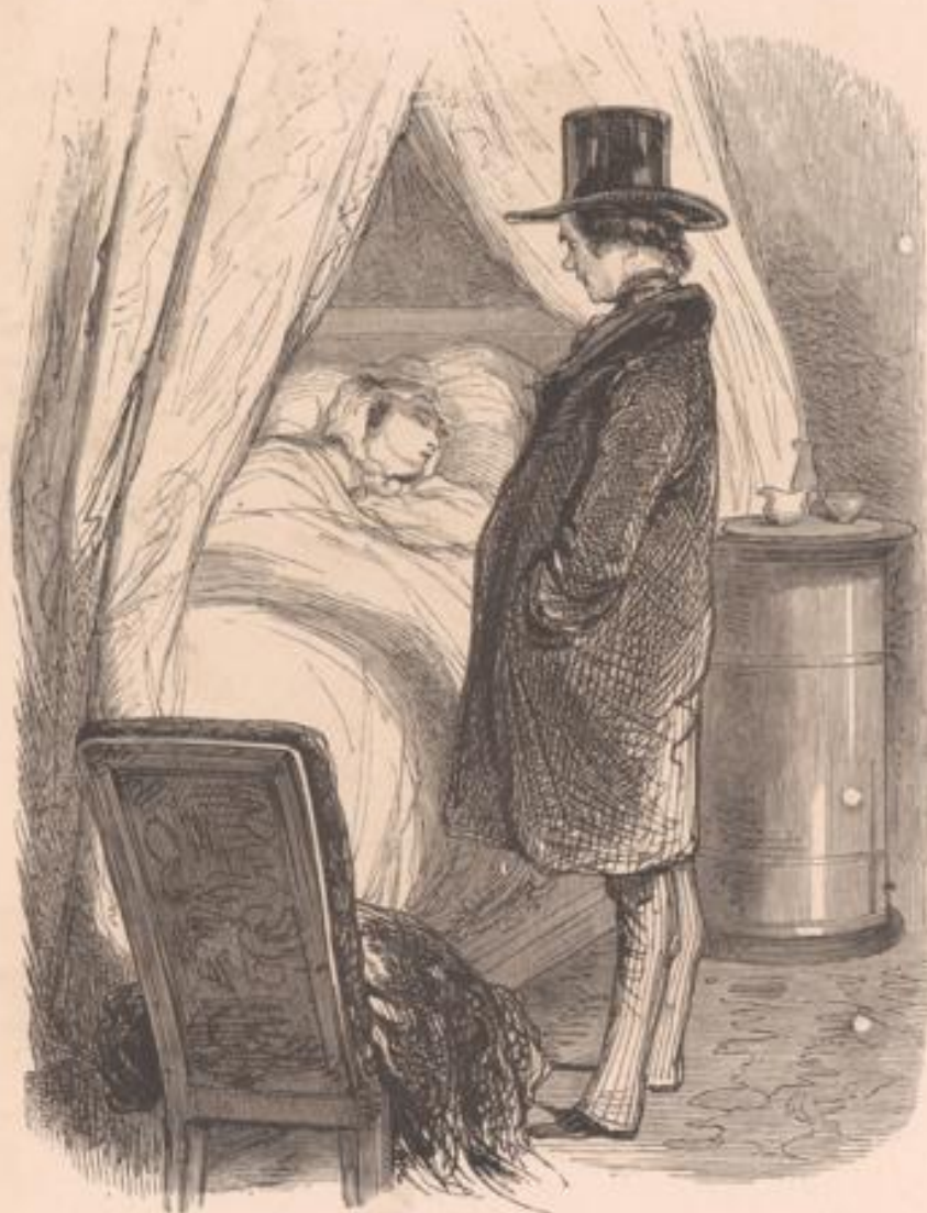
Que voulez-vous? j'irai tout seul... Satanée migraine! Tu souffres donc bien?... L'ouvre chat!