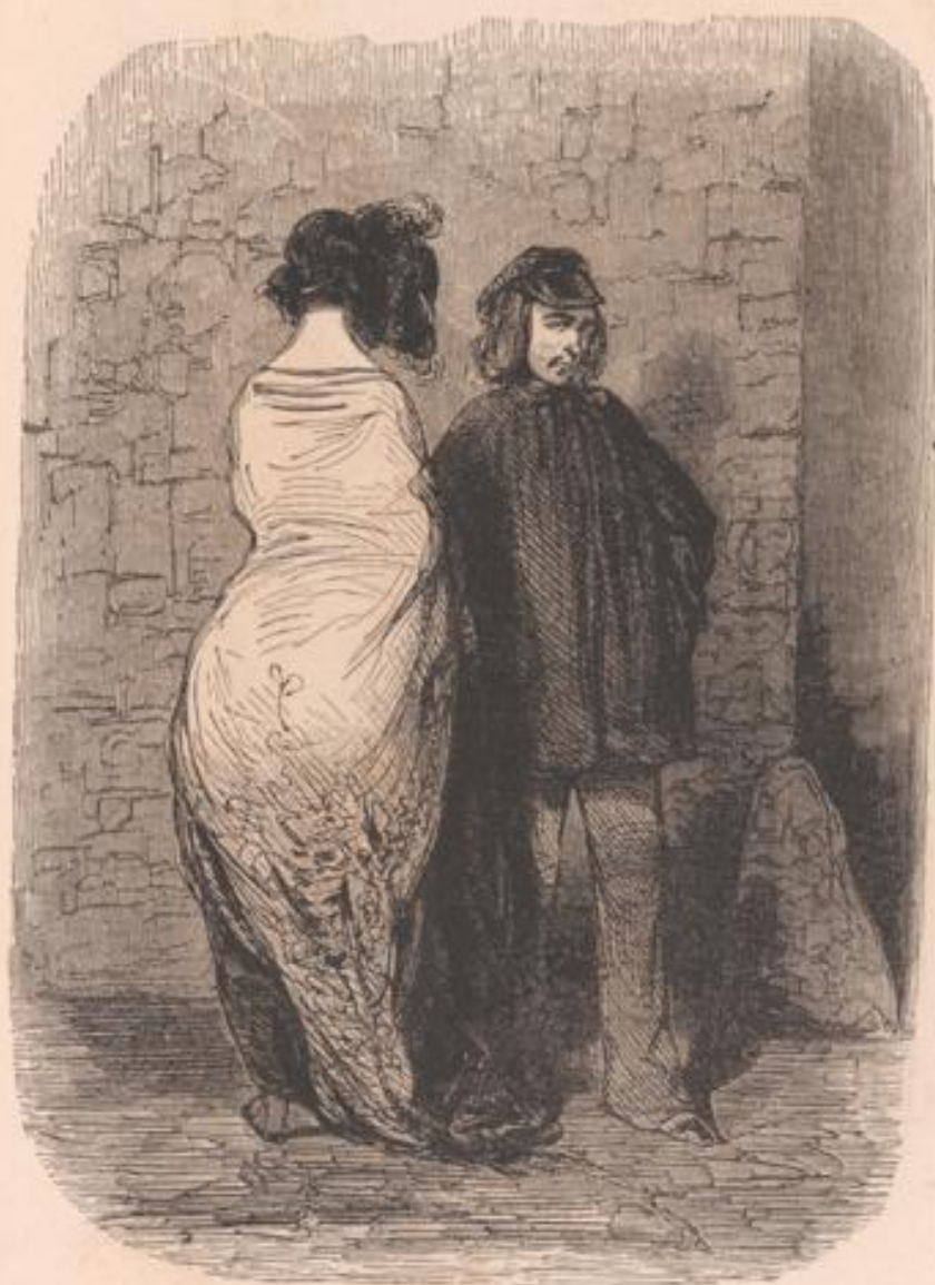
— Où qu' tu vas, Polyte? — J' vas tremper un' soupe à ma femme... une faignante! que v'là trois jours-qu'a travaille pas.