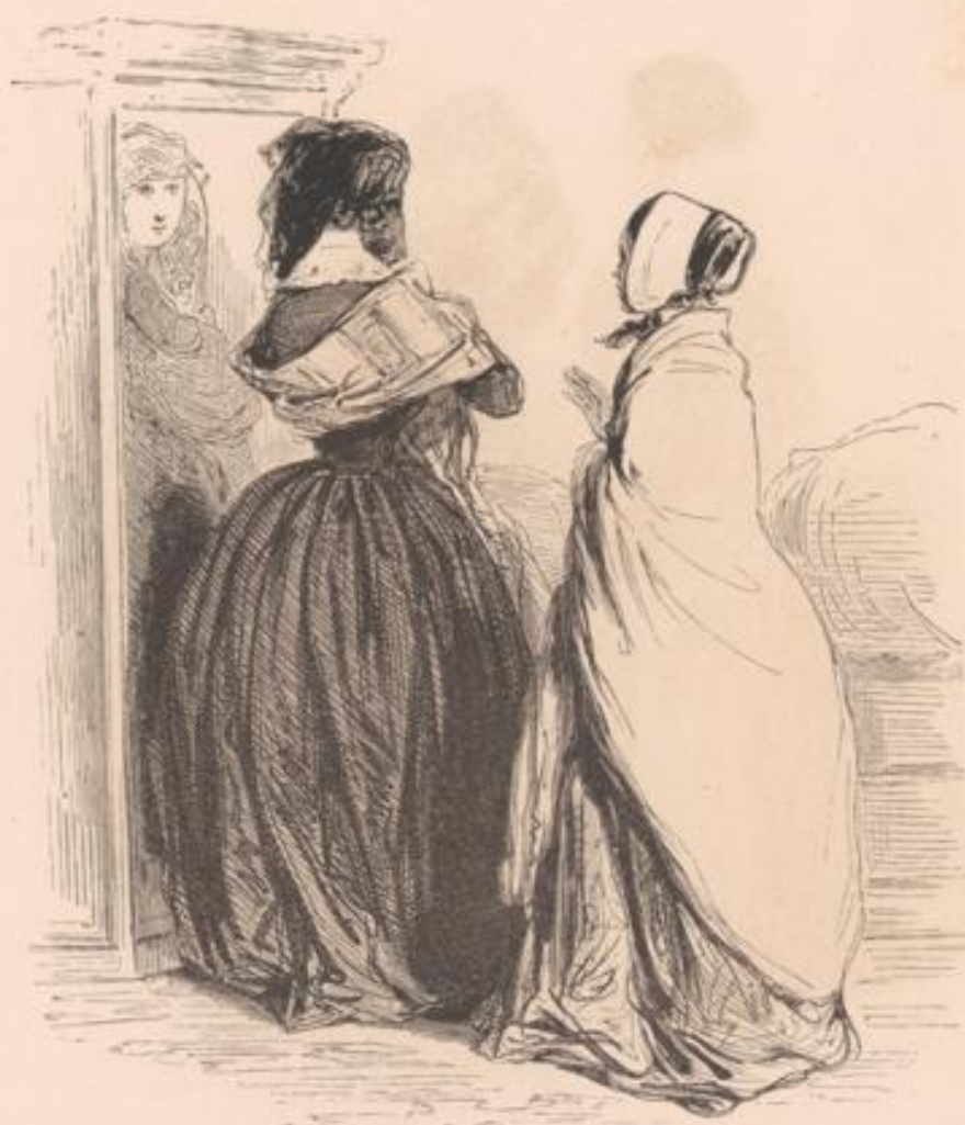
— Cré chien! Loise, t'es là une casquette... — Un peu choette!