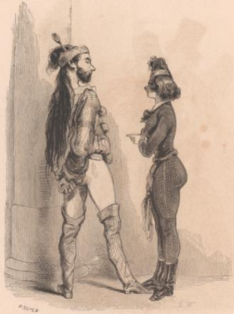
Qu'est-ce? les gens de qualité se commentent-ils maint. nant avec ceux de votre sorte? Pandour!