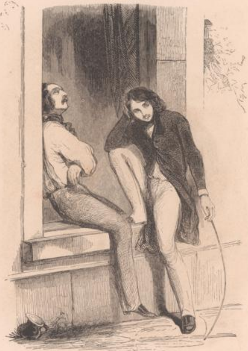
— C'est moi! — C'est moi! — Elle me fait l'œil. — Elle gingine à mon endroit — Tu t'abuses, mon petit. — Tu erres, mon vieux. — (A la fois.) Tiens, tiens, tiens! nous avons raison tous deux... elle louche!