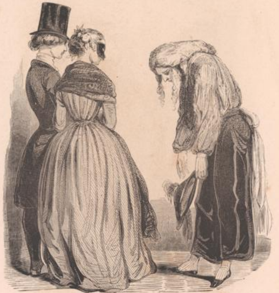
Avec l'agrément de cet agréable mufe-là, pourrait-on, madame, pincer avec toi le prochain rigodon?