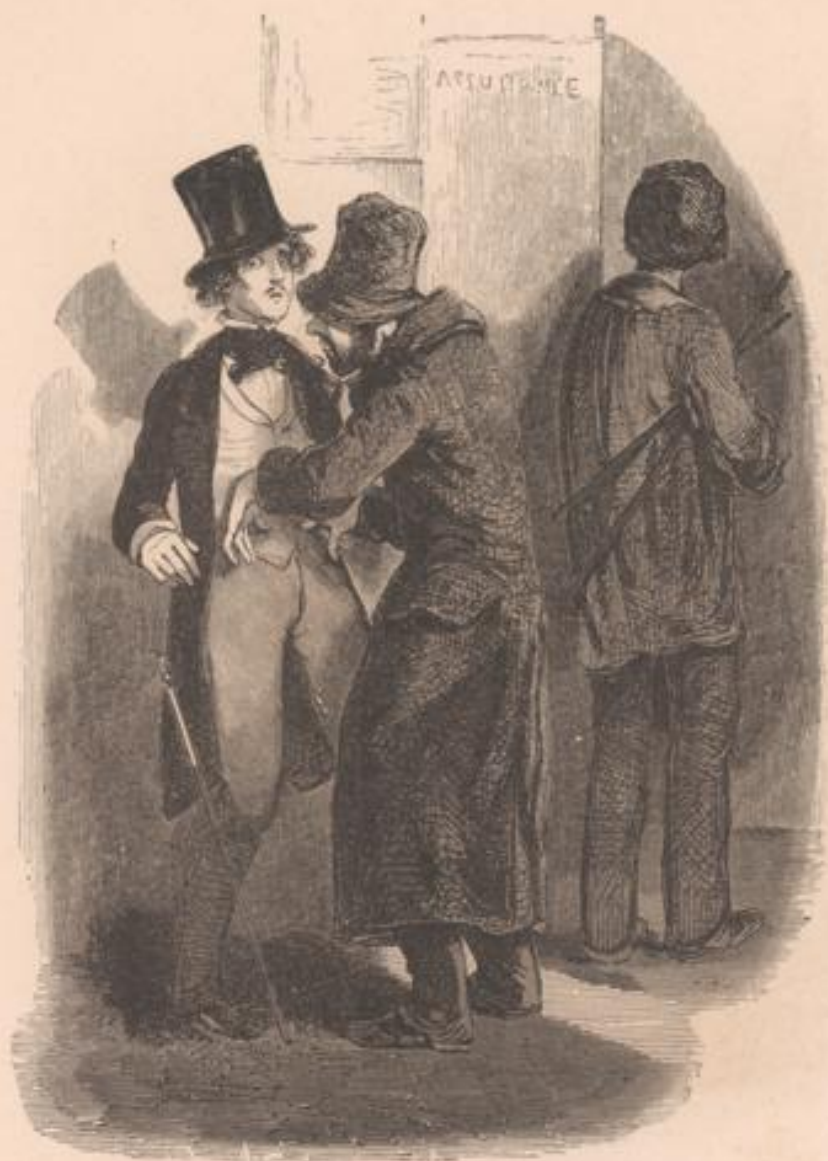
N'y a pas gras!