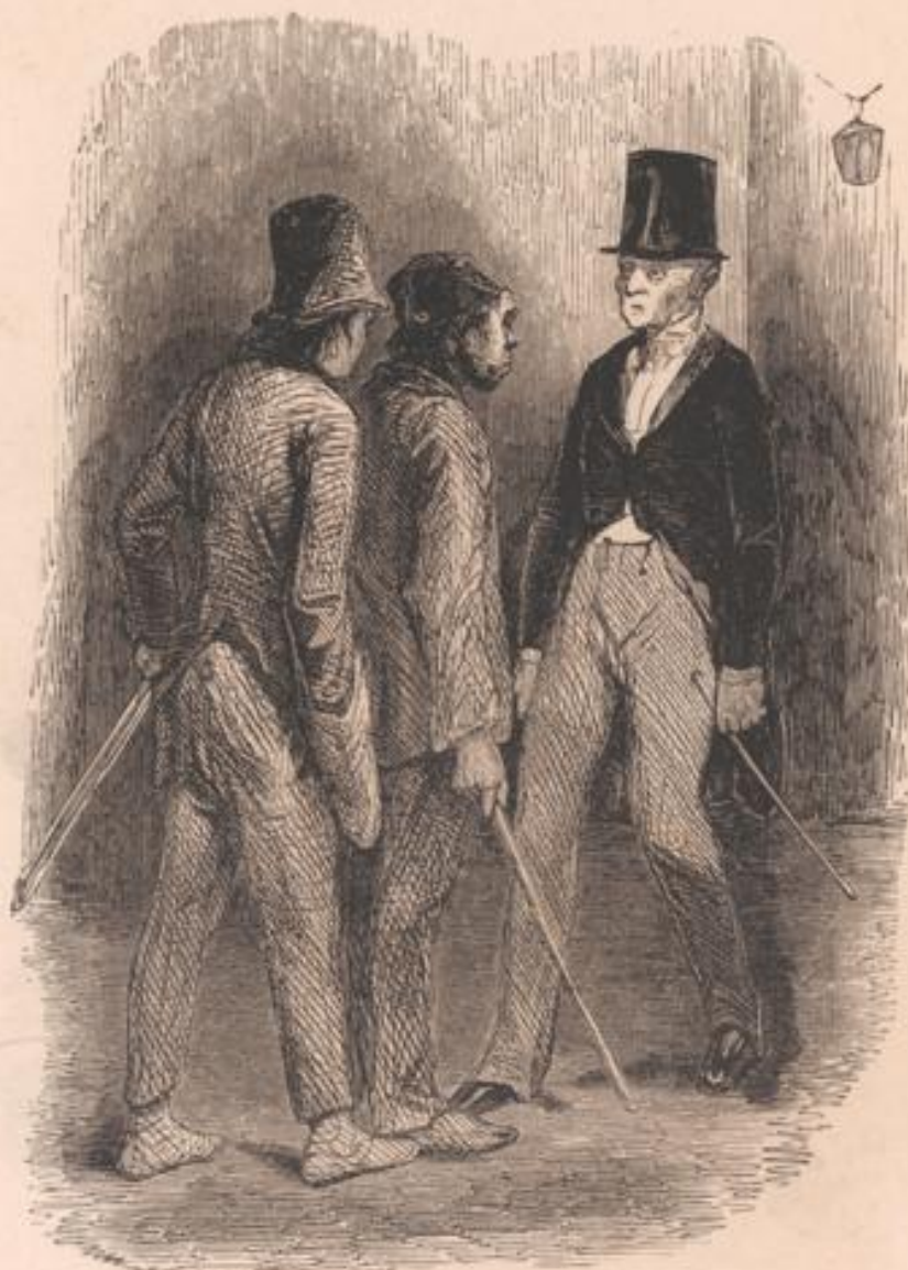
En v'là un bon p'tit bourgeois ben gentil qui va nous donner que qu'vieux monarqu' pour y boire à la santé... si c'est son idée à c't homme!... pas vrai, papa?