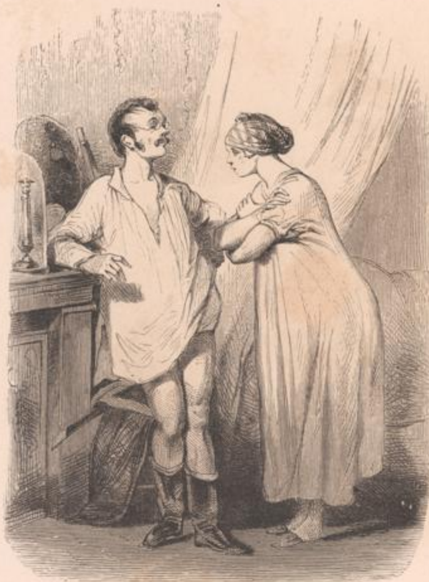
Comment sapristi! depuis neuf heures du matin jusqu'à minuit pour aller de Saint-Leu au Père-Lachaise! Voilà un camarade qui peut se vanter d'être bien enterré: vous y avez mis le temps!... Toutes ces machines-là, vois-tu, c'est de la boustifaille, et pas autre chose... des boustifailles, et pas autre chose!... pas autre chose!