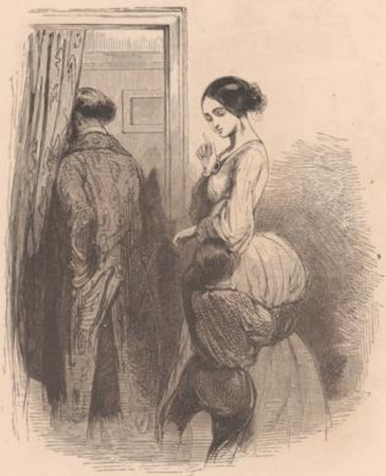
Après dîner, maman, n'est-ce pas (j'ai été bien sage)? nous irons chez mon bon ami.