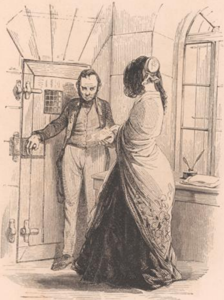
« Au moins un dieu sourit encore à la jeunesse Et lui rend, en ce lieu, de ces jours qu'on lui prend. Qui n'aurait pas pitié des beaux ans qu'elle y laisse? »