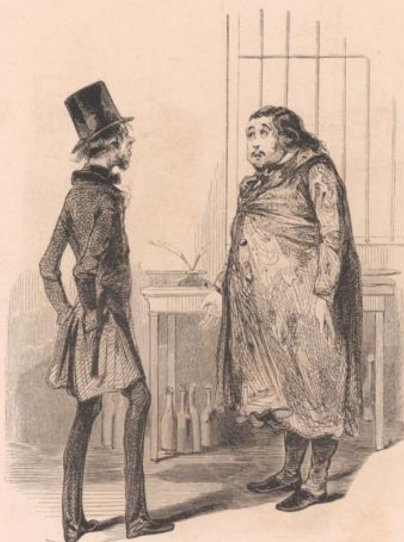
Vous le voyez, le chagrin ne m'aigrir pas! et je donnerai un conseil à mes créanciers, dans leur intérêt: s'ils veulent me tirer d'ici, qu'ils se hâtent, car on ne pourrait bientôt plus me passer par la porte.