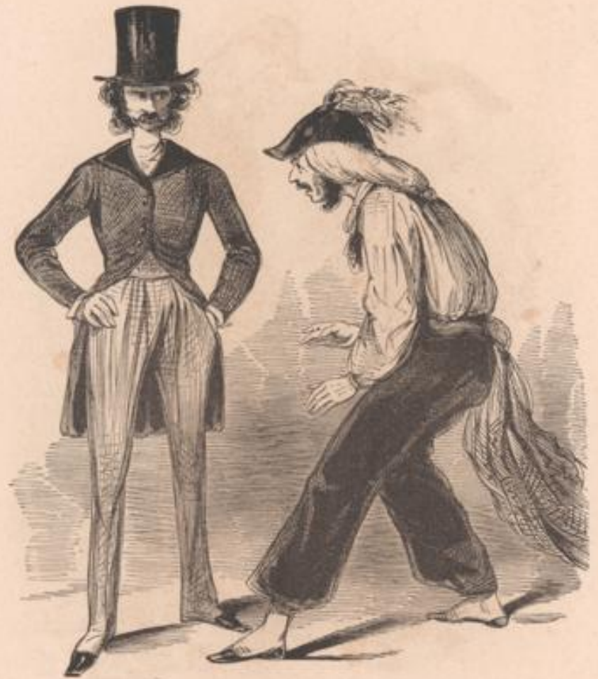
On rit avec toi et tu te fâches... en voilà un drôle de pistolet!