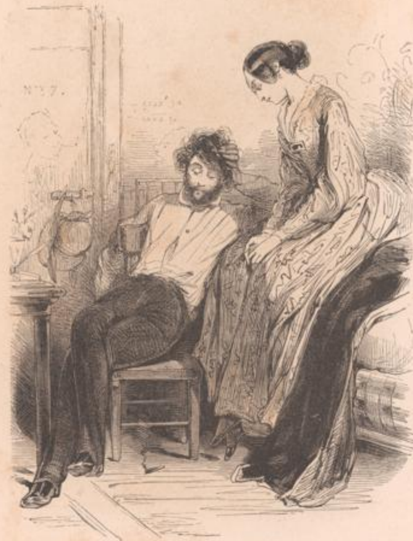
Ici on ne peut pas faire de farces à sa Ninie ; v'là ce qui vous chiffonne !