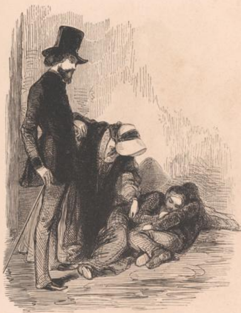
« Le plaisir rend l'âme si bonne! » (Étranger)