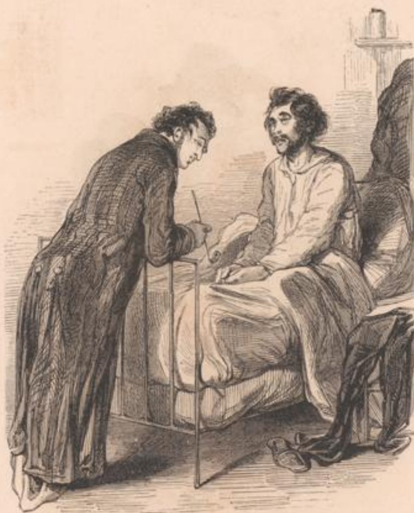
Ne donnez pas d'à-compte! voyez-vous, le créancier qu'on ne paye pas n'est qu'un créancier, le créancier qu'on paye est un tigre!