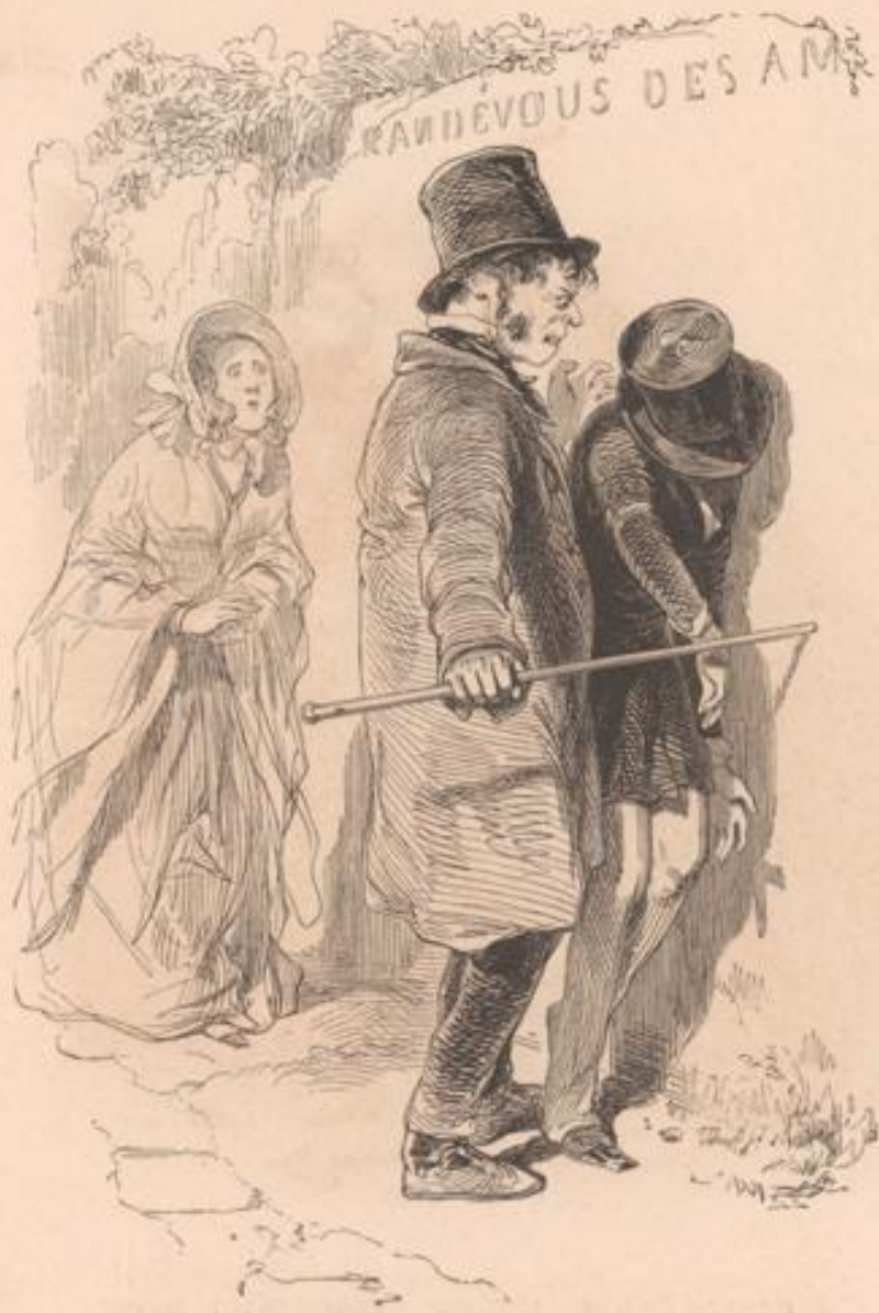
Les maris ne font pas toujours rire.