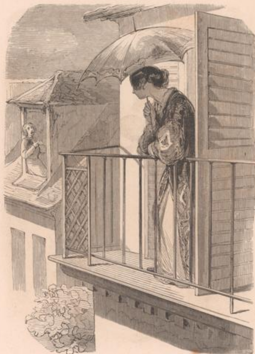
L'heure du berger.