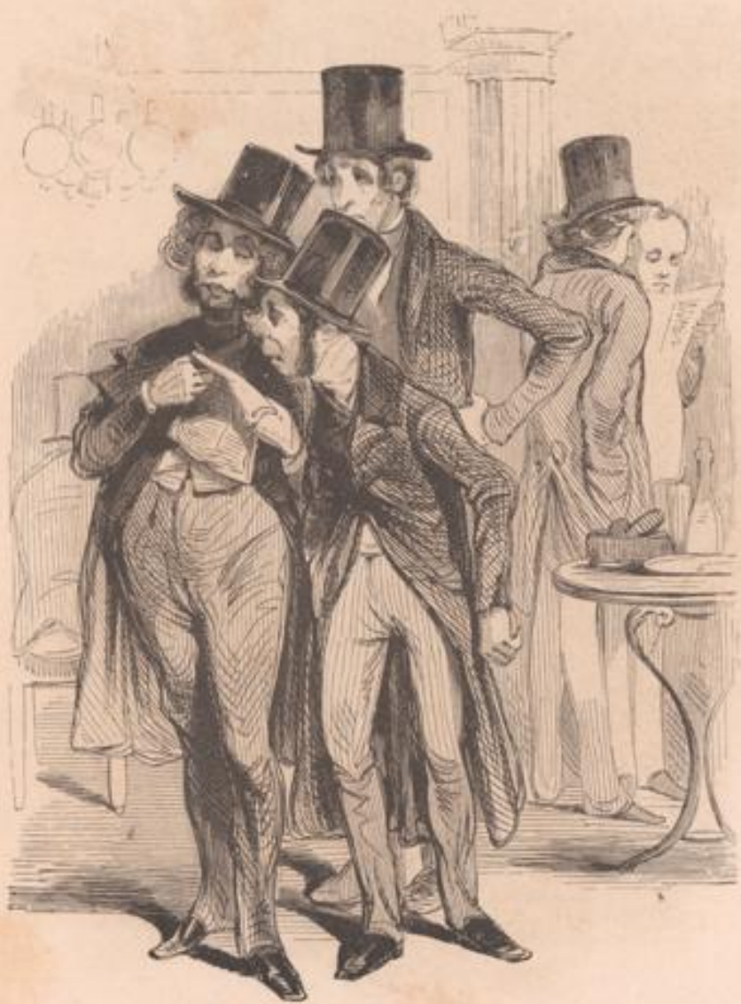
— Vous étiez nommé hier soir? — Sans doute... — C'est moi qui le suis ce matin.