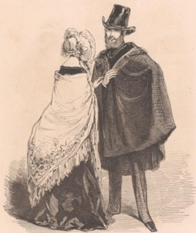
— Je vous garde un coupon pour Chantreine, jeudi, mon petit Charles: je joue la « Fille d'honneur ». — Ça sera drôle! — ... Tous mes amis viennent. — Ça sera plein!