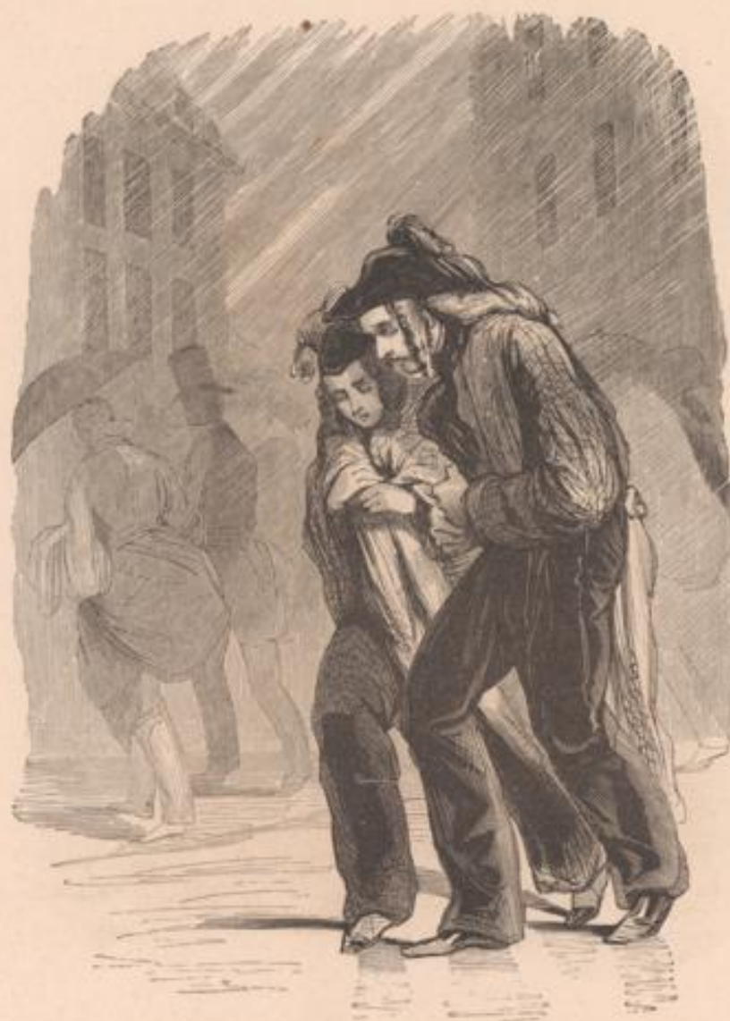
Pus que ça de bouillon! merci.