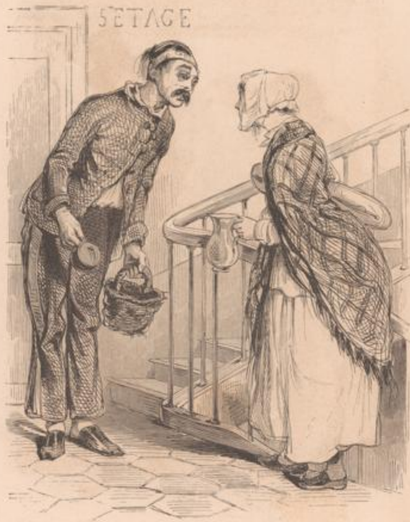
N'est-ce pas vous, madame, que j'ai eu l'avantage de voir au balcon des Italiens?