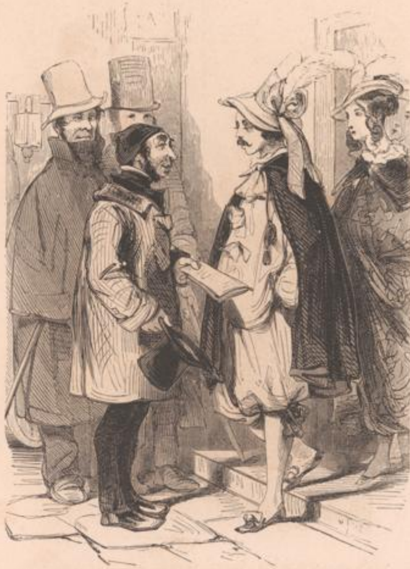
Le soleil est levé depuis vingt minutes, monsieur le baron!

(Au premier M sieu.) « Attendez-moi ce soir, de quatre à cinq heures, quai de l'Horloge du Palais. » Votre AUGUSTINE. » (Au deuxième M sieu.) « Ce soir, quai des Lunettes, entre quatre et cinq heures. » Votre AUGUSTINE. » (Au troisième M sieu.) « Quai des Morfondus, ce soir, de quatre heures à cinq. » Votre AUGUSTINE. » (A un quatrième M sieu.) « Je t'attends ce soir, à quatre heures. » Ton AUGUSTINE. »