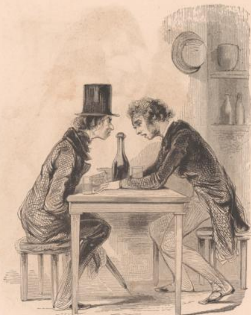
... Elle était donc censée garder sa tante Grayet qui tenait le lit depuis les Bois, pour ses fameuses coliques, quand un soir je monte au Grand-Vainqueur pour voir un peu. Qu'est-ce que je vois? ... Mon épouse en garde française!!!