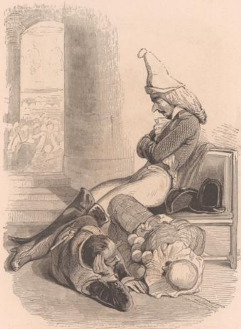
— Les rats couchés, nous sommes venus. — Et... vos petits voisins de l'entre-sol... vous ne les avez pas débauchés? — Eux? des poules comme ça! ça se couche à minuit en carnaval, et puis ça vient vous dire que le carnaval est triste. — Épiciers!