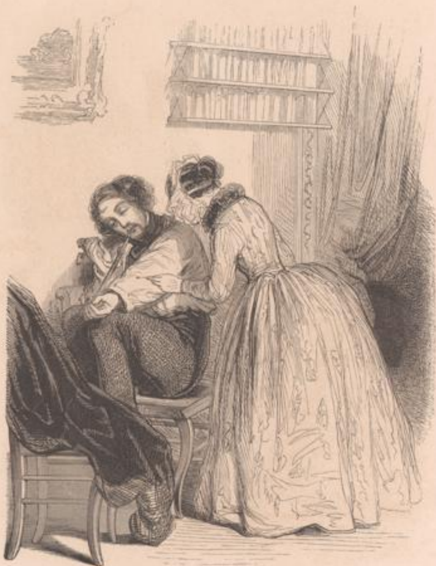
Est-ce aussi votre tuteur qui laisse des épingles noires sur votre oreiller?