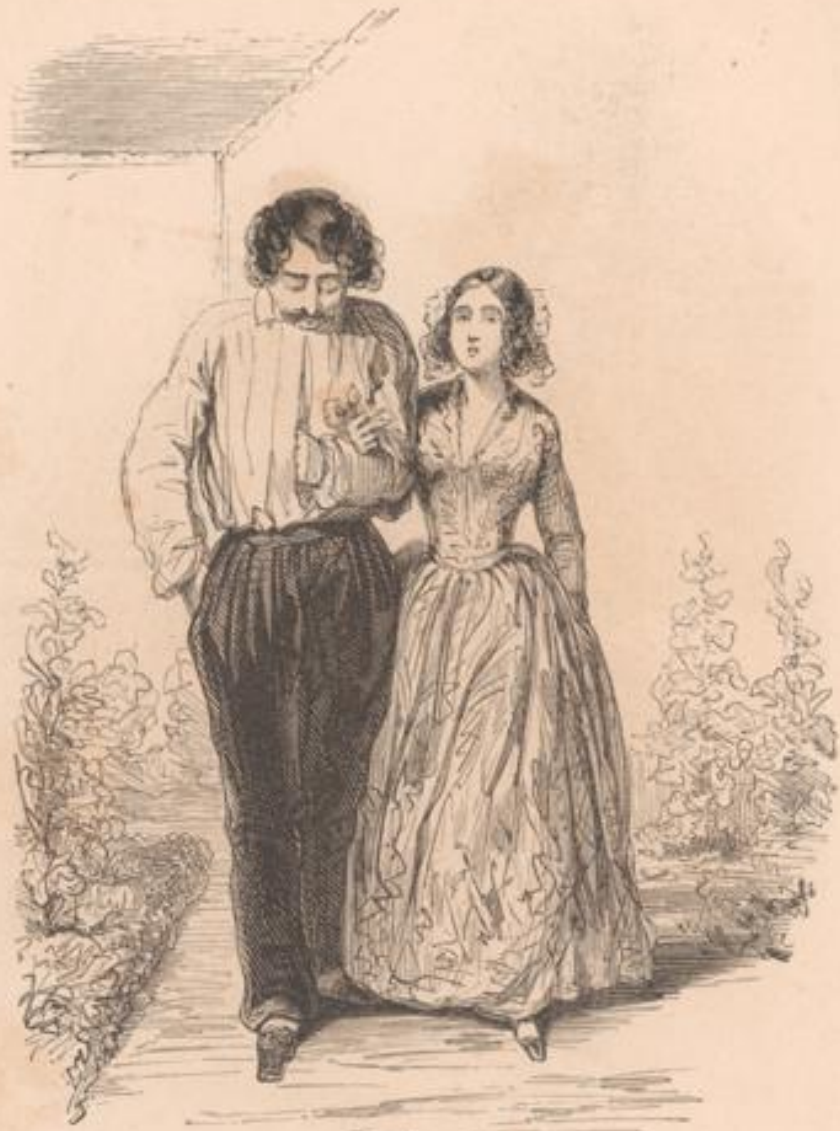
Enfin, à la fin, je l'ai tant mijoté, je l'ai tant mijoté, qu'il a dit : « Eh bien ! qu'il paye seulement les frais et j'accorderai du temps pour le reste. » Et encore il a dit : « Voyez-vous, mademoiselle, c'est par considération pour vous. » Le vieux gueux !... J'espère bien que quand tu sortiras, tu lui ficheras une pile soignée à celui-là !