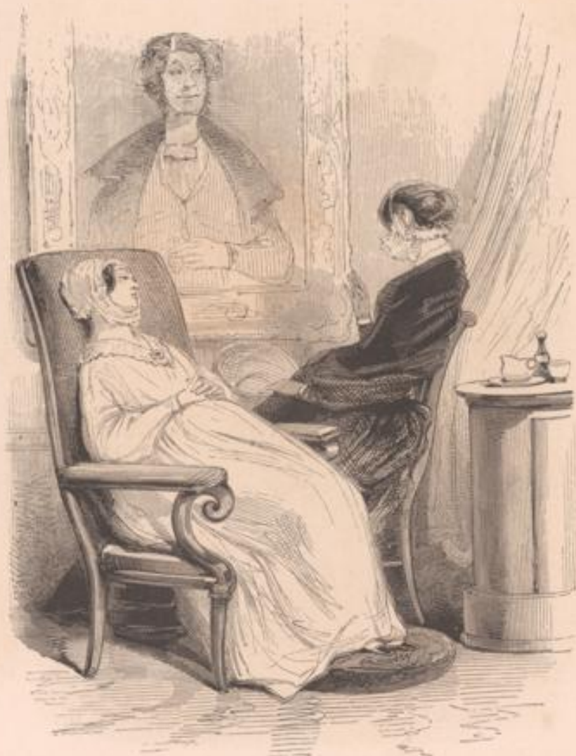
— Vraiment, dans ta position, tu es bien tort, ma chère petite, de laisser un vilain singe comme ça pendu sous tes yeux toute la journée. — Qu'est-ce que ça peut faire? — Ça fait que le petit dernier de Caroline ressemble à monsieur Coquardeau, voilà ce que ça fait! — C'est bien gai pour une mère!