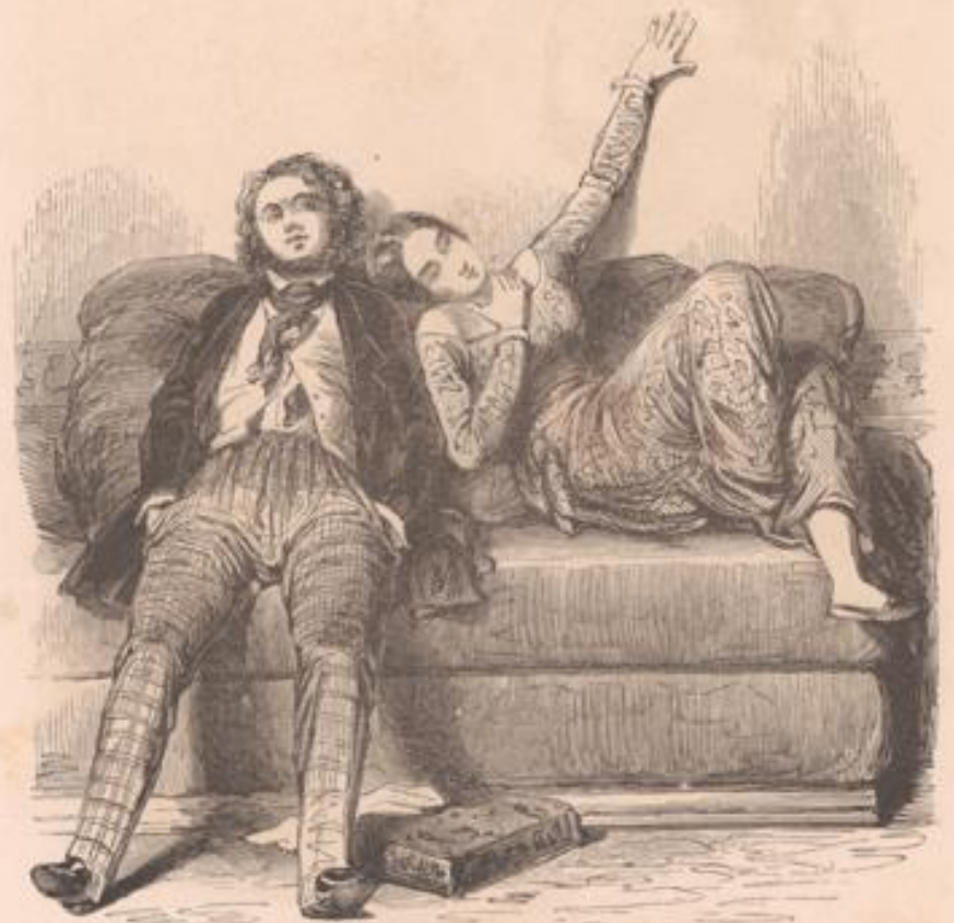
Mon adoré! dis-moi ton petit nom.