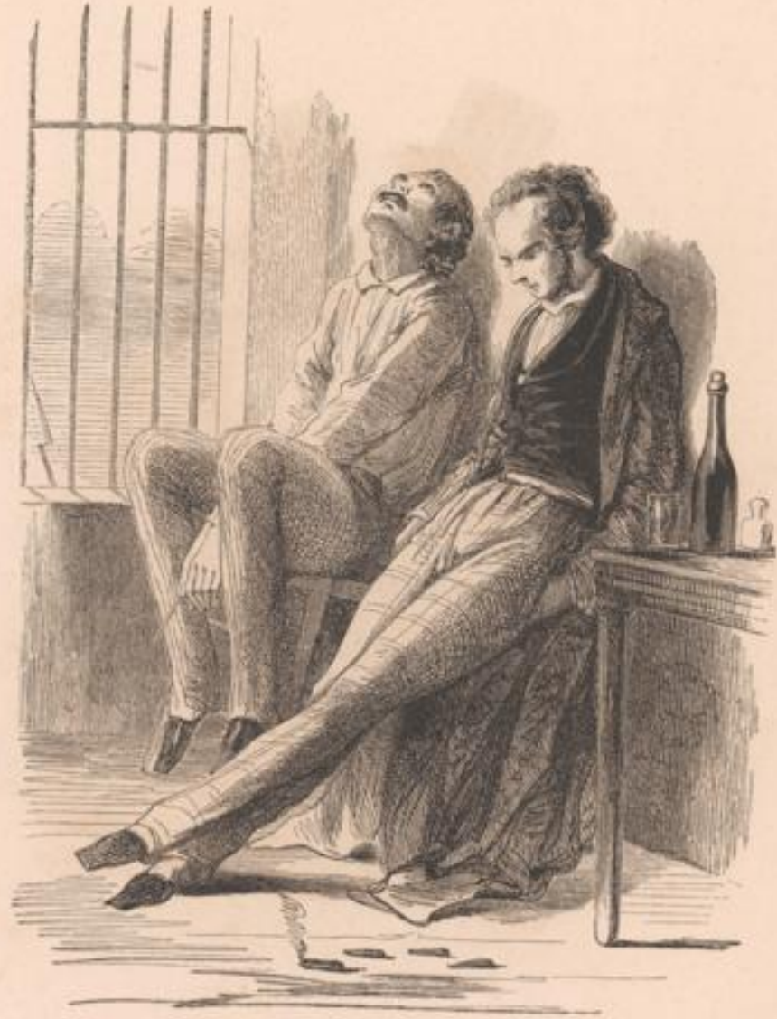
Entends-tu, à Tivoli?... Il y en a deux, ici, des cavaliers seuls, et qui ne demanderaient pas mieux que de faire la chaîne des dames.