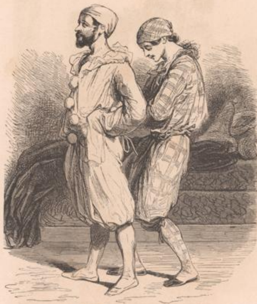
— Parbleu! si vous deviez les épouser toutes, mauvais sujets! les oncles n'y suffiraient pas. — Ni les neveux non plus, mon oncle.