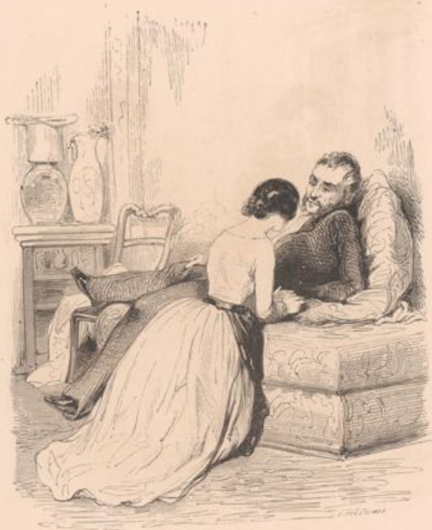
Ca fait des contes à l'actionnaire.