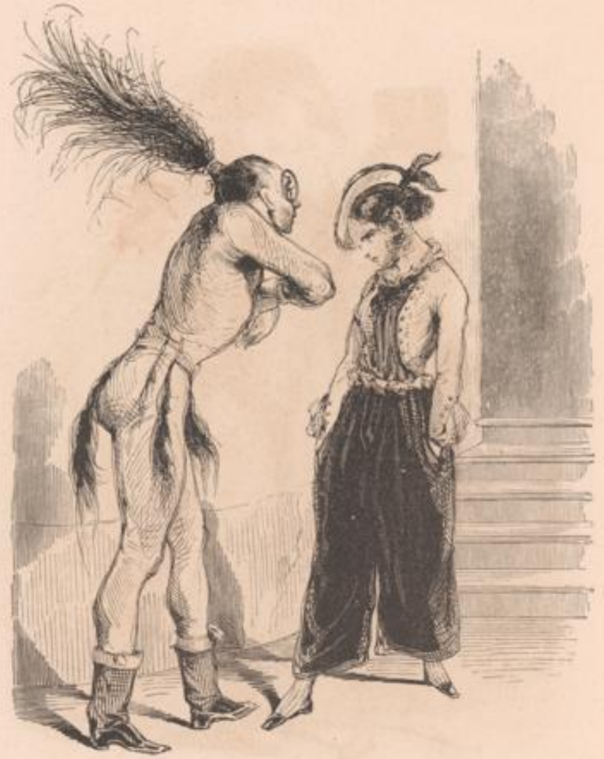
Veux-tu te sauver, sauvage!