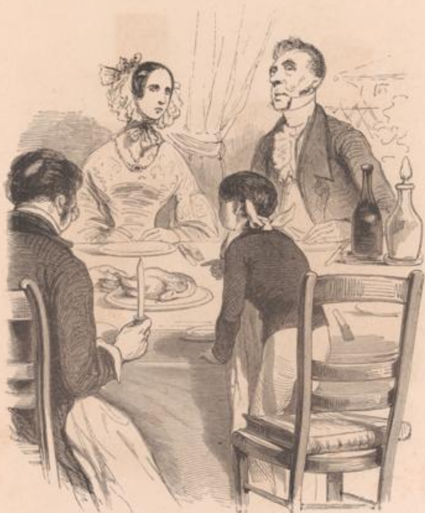
Mère, est-ce que c'est le crevé de ce matin, que t'as dit que ça serait toujours assez bon pour lui?