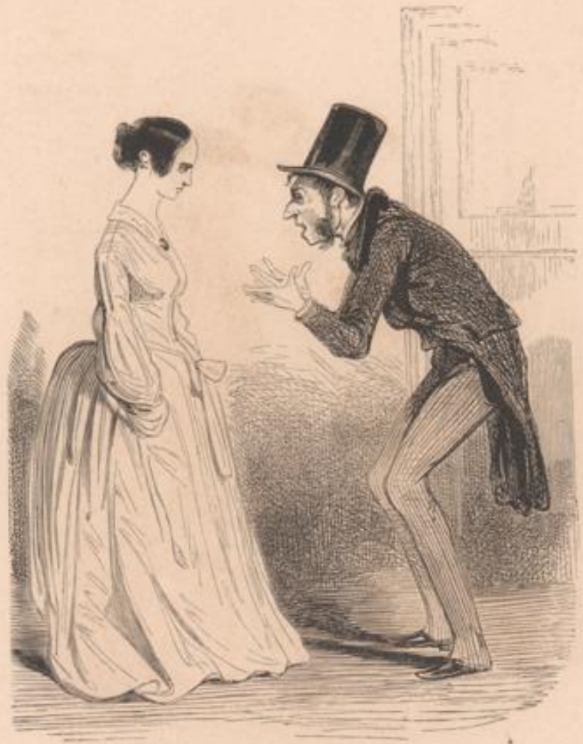
Mais si un homme avait été pour moi ce que j'ai été pour toi, et que je lui aie fait ce que tu m'as fait!... Mais! mais... mais je serais... honteuse!