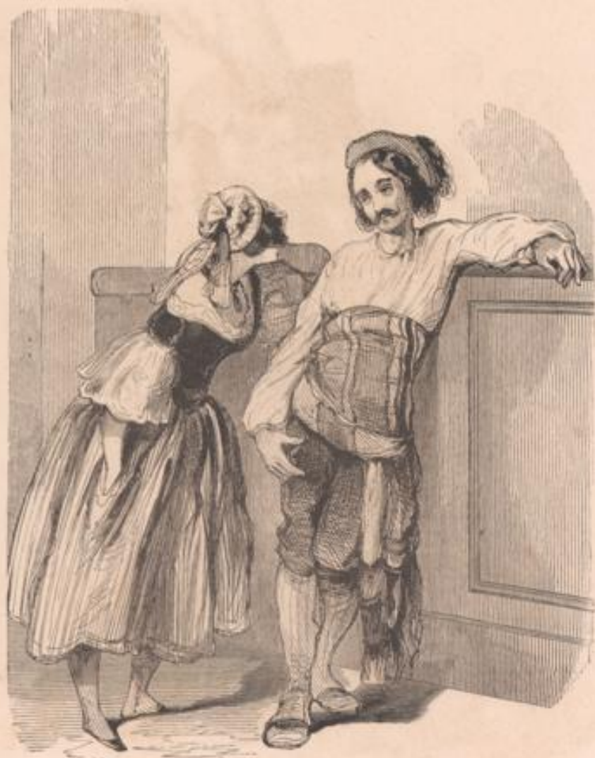
— J'ai un mal de tête de chien! — C'est la champagne — Ah Dieu! je ne bois jamais de vin. — C'est le rhum.