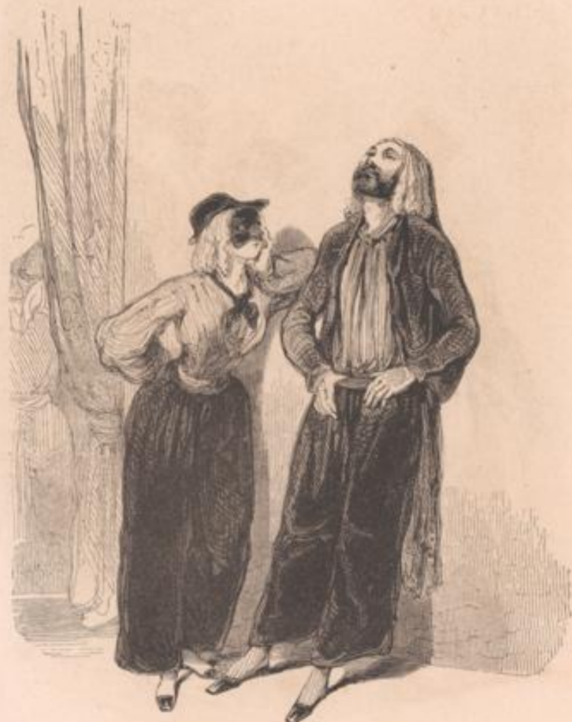
J'ai concédé que j'en ai pus de jambes, j'ai mal eu cou d'avoir crié... et bu que le palais m'en ratisse... — Tu n'es donc pas un homme?