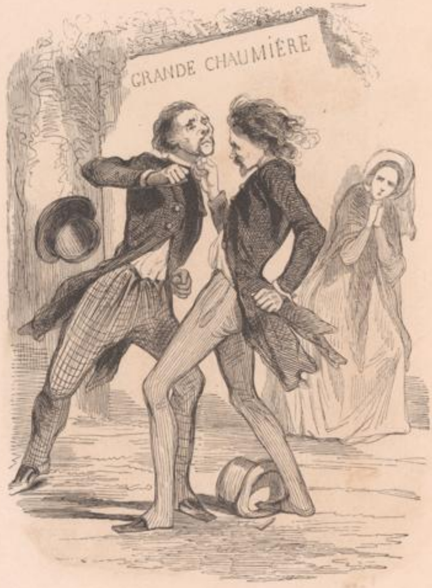
DONATION ENTRE VIPS