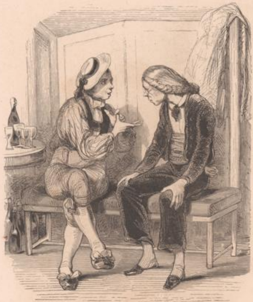
A sept heures ma fille se lève, le temps de faire ses quinze tours, il est bien huit heures; faut travailler son piano; on déjeune à neuf; à dix, c'est son anglais; ma fille chante sur les midi; et puis sa mère veut qu'elle couse, qu'elle fasse un peu de cuisine, un peu de tout-bon! la maîtresse de paysage arrive à trois heures; et puis nous avons des serins, faut nettoyer ça, les fleurs des pots, n'importe quoi; les uns et les autres viennent; arrivent cinq heures; et le soir, c'est mosieu Marrisou qui lui fait repasser son orthographe... Et après ça, vous croyez qu'une jeunesse a beaucoup le temps de s'amuser, vous!