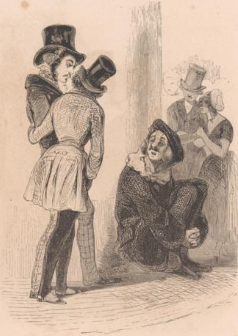
Voilà la petite avec le brun qui l'amène toujours : le blond qui la ramène toujours va venir.