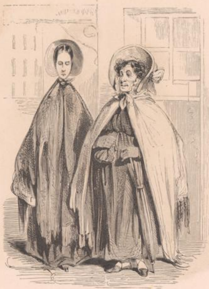
Chemin du théâtre.