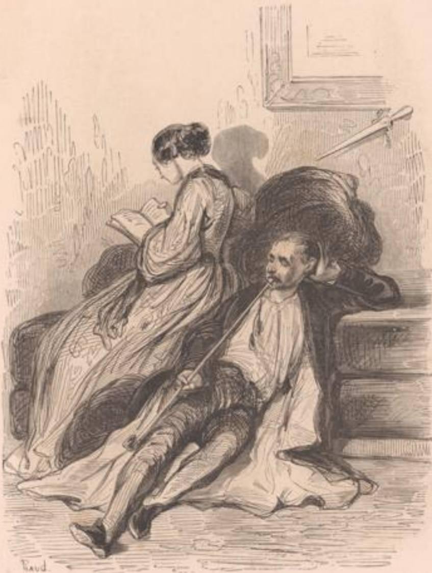
Un roisin nouveau, un jeune amour, une vieille pipe.