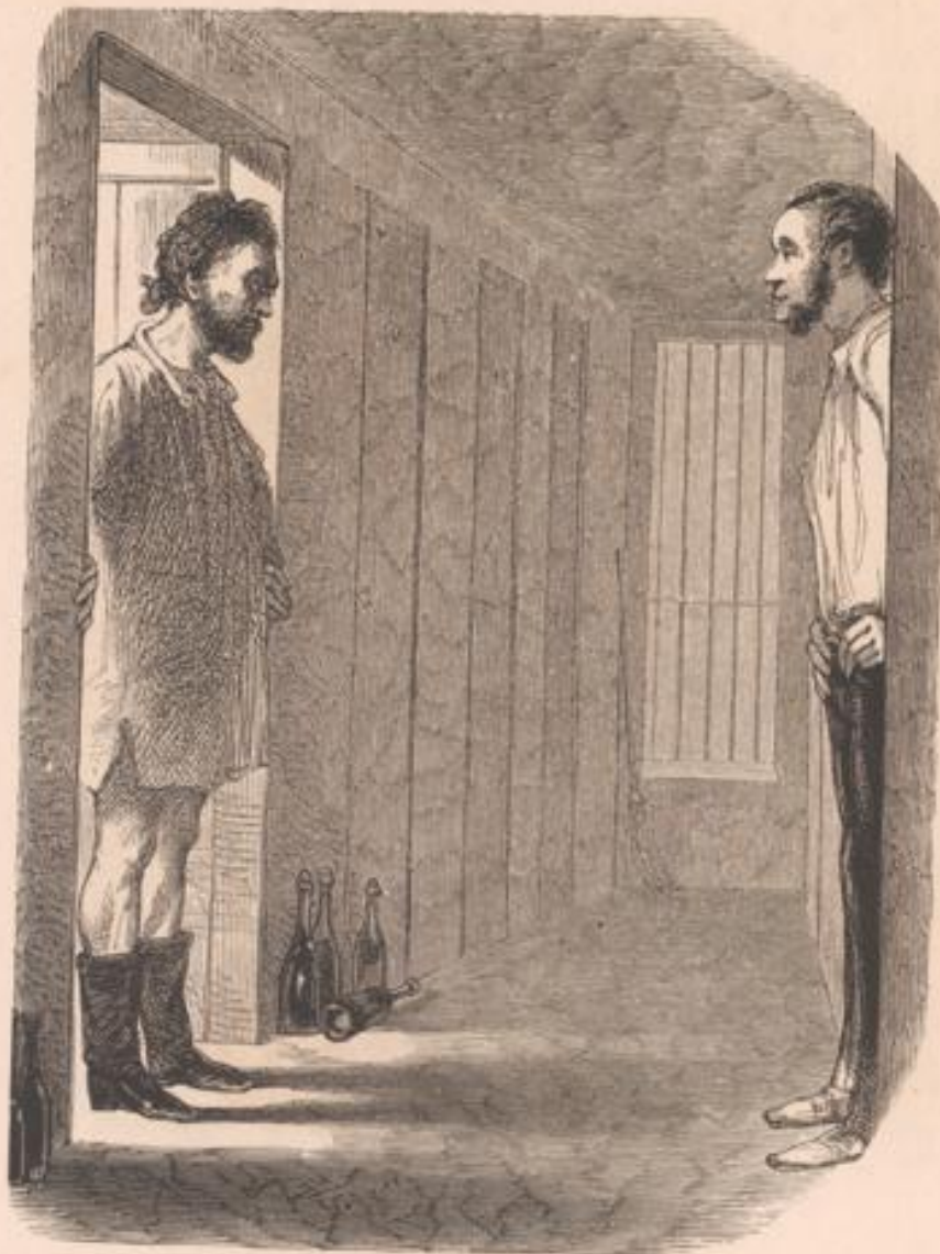
— Dites donc, voisin, on a un peu boissonné chez vous, hier! ça allait rondement! Ça va bien, ce matin? — Pas mal, et vous?