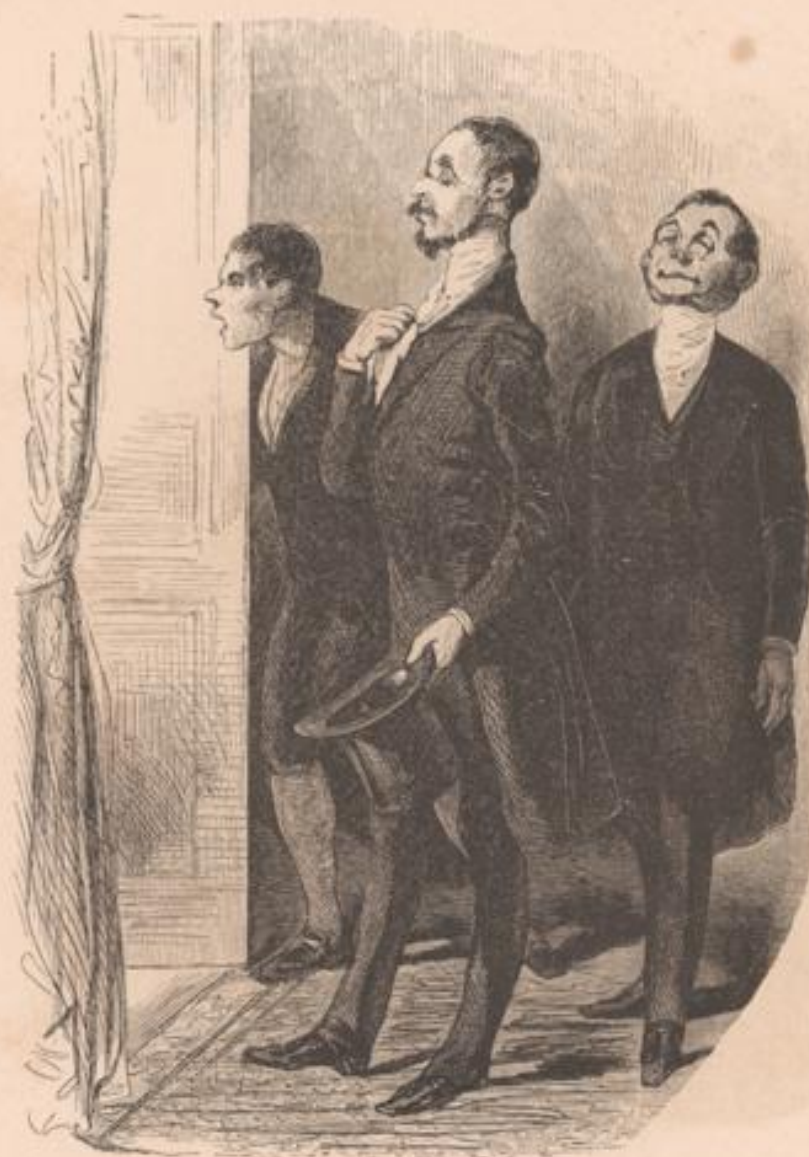
Monsieur le comte Ome-raiki!... Monsieur le baron Gros-Jean!...