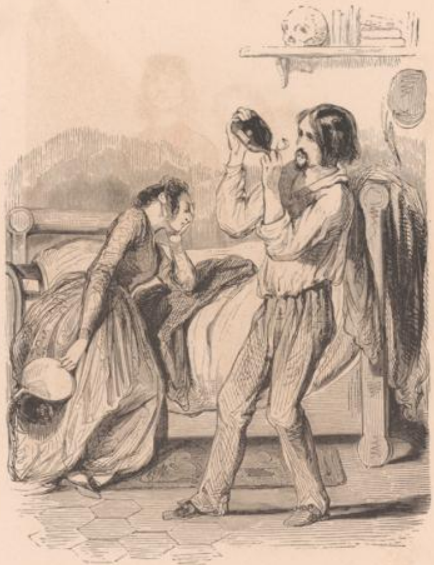
La première cure