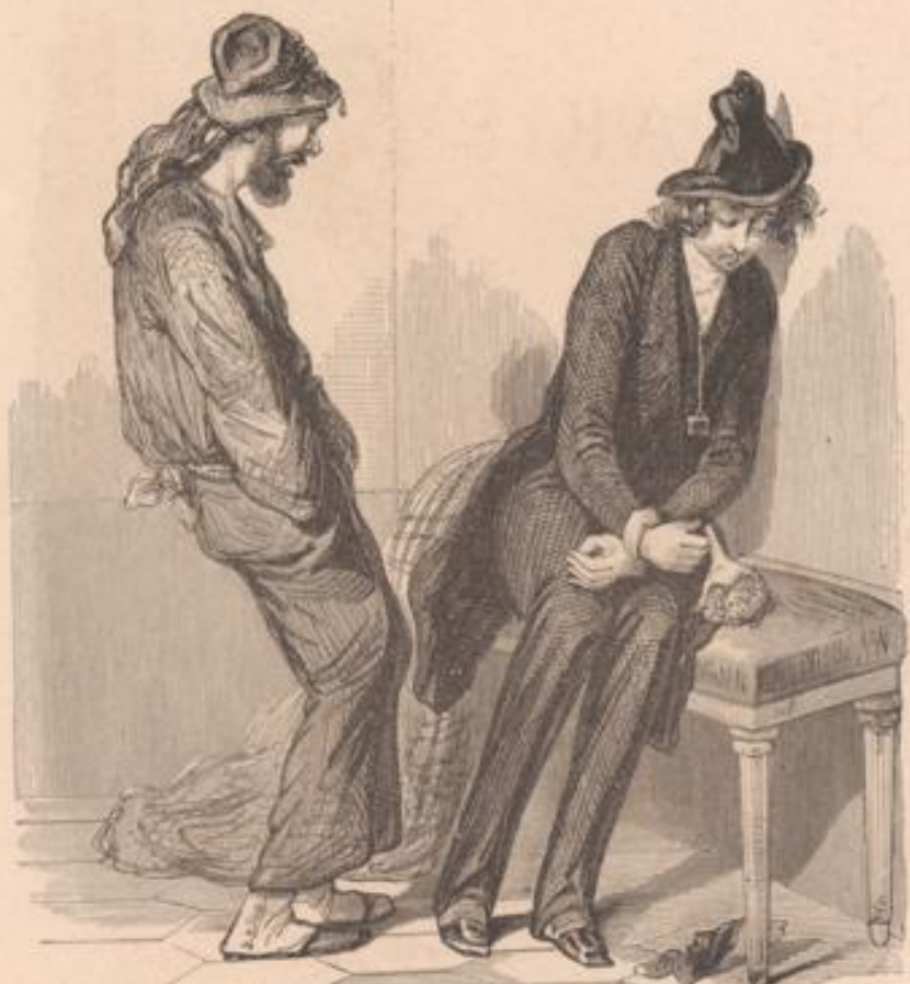
V là un gueux de petit pékin qui se divertit au bal comme un grain de clomb dans du champagne.