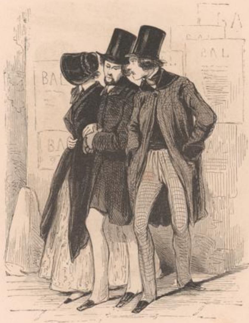
Bal à la Renaissance ce soir - lâche ton boulet!