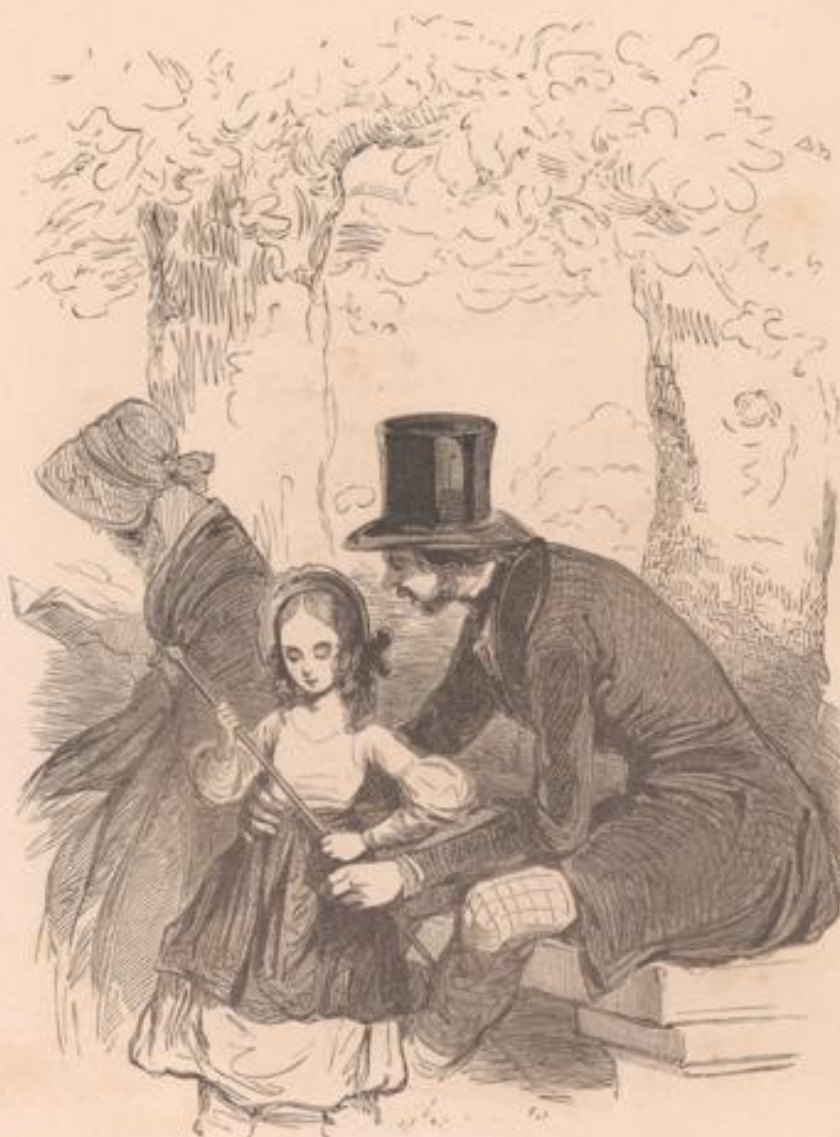
— Petit amour, comment s'appelle madame votre maman? — Maman n'est pas une dame, monsieur : c'est une demoiselle.