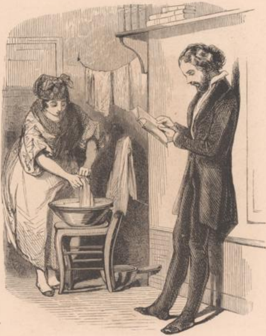
ARTICLE 212 DU CODE CIVIL. « Les époux se doivent mutuellement fidélité, secours, assistance. »