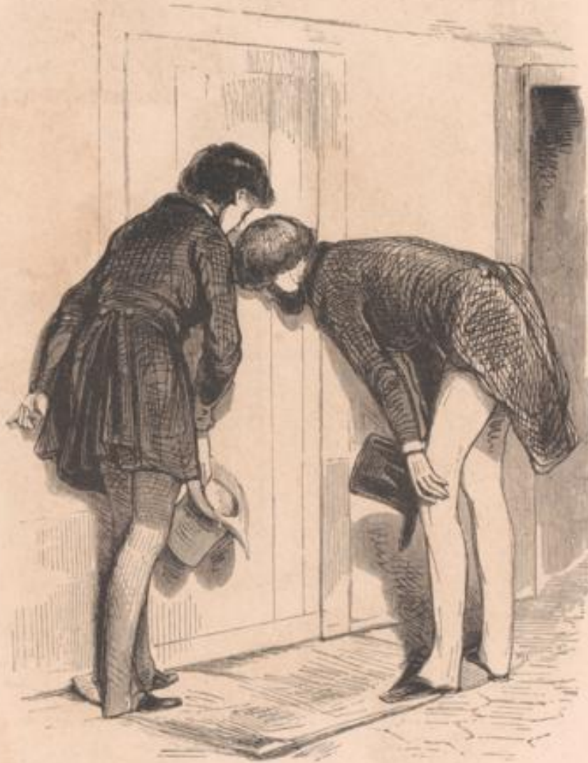
Angélique! Angélique! Elle n'y est pas... cependant, sapristi! je vois une paire de bottes