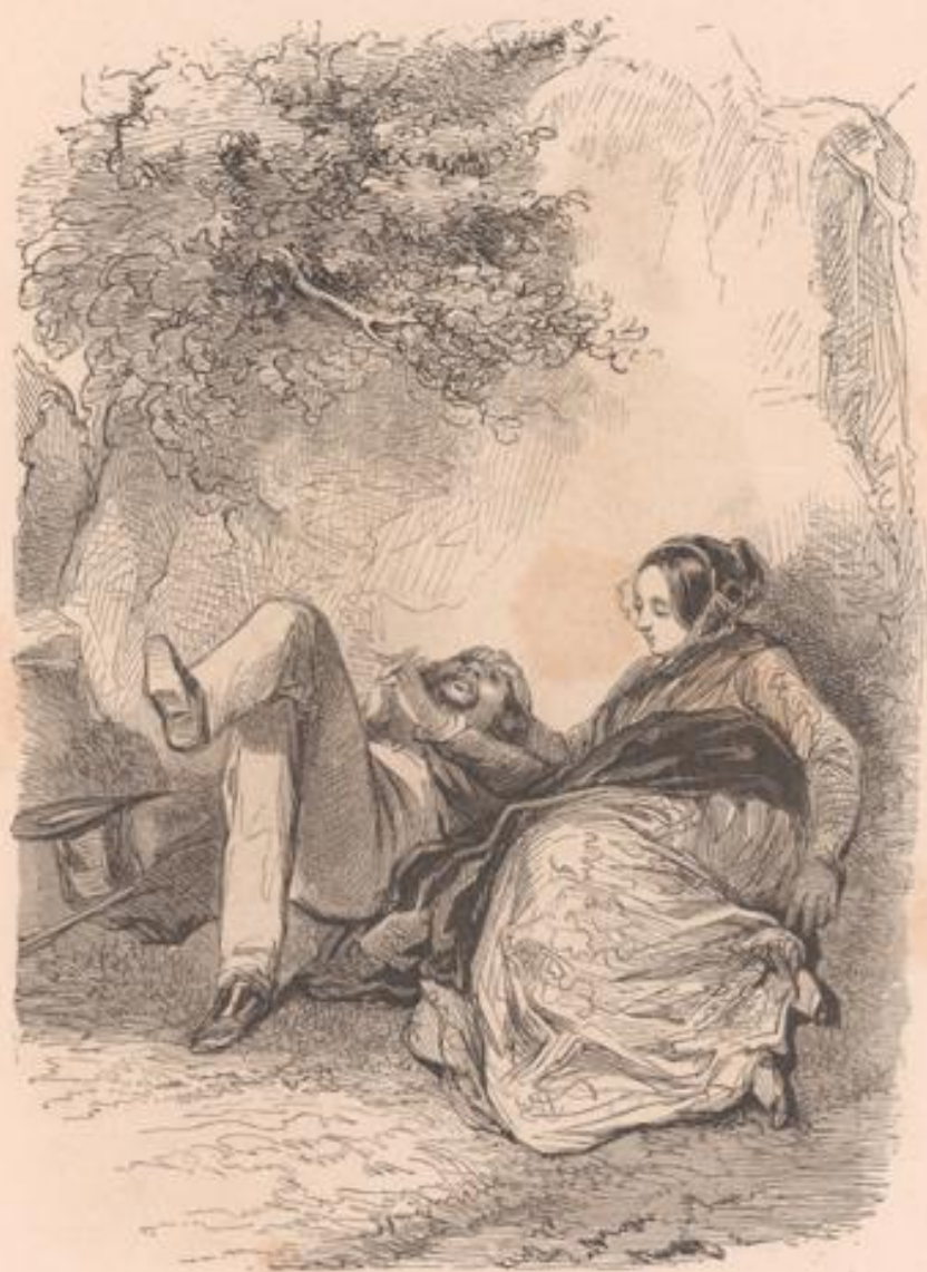
— Quand je serai ministre de la justice, j'empêcherai les femmes d'empêcher les étudiants d'étudier. — Et on te dira sut.