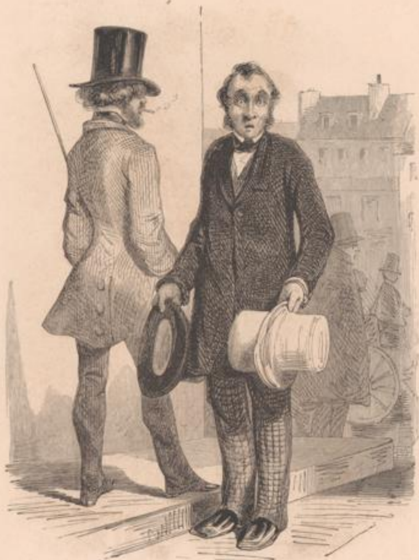
Il ne m'ôterait seulement pas mon chapeau!