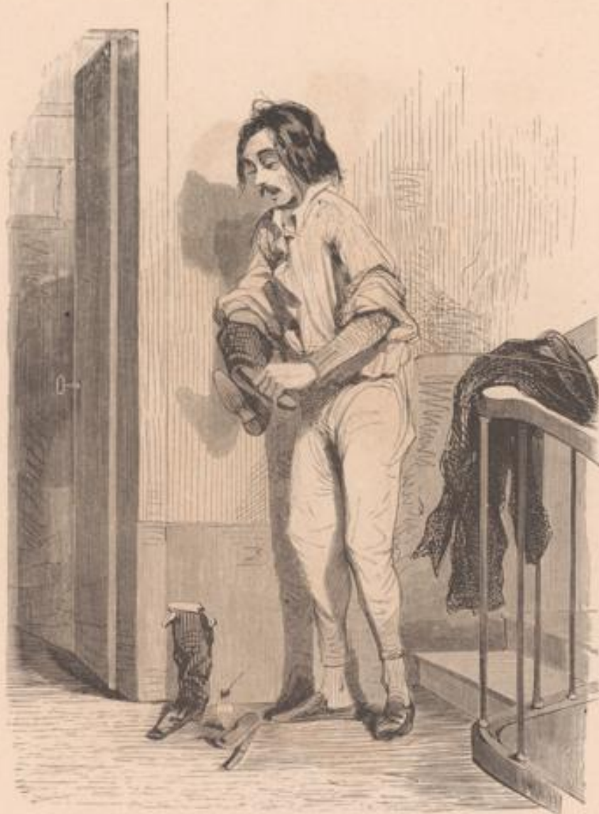
Pourquoi se priver du superflu, quand on peut se dispenser du nécessaire? Avec ce que coûte une femme de ménage, on a deux stalles à l'Opéra.