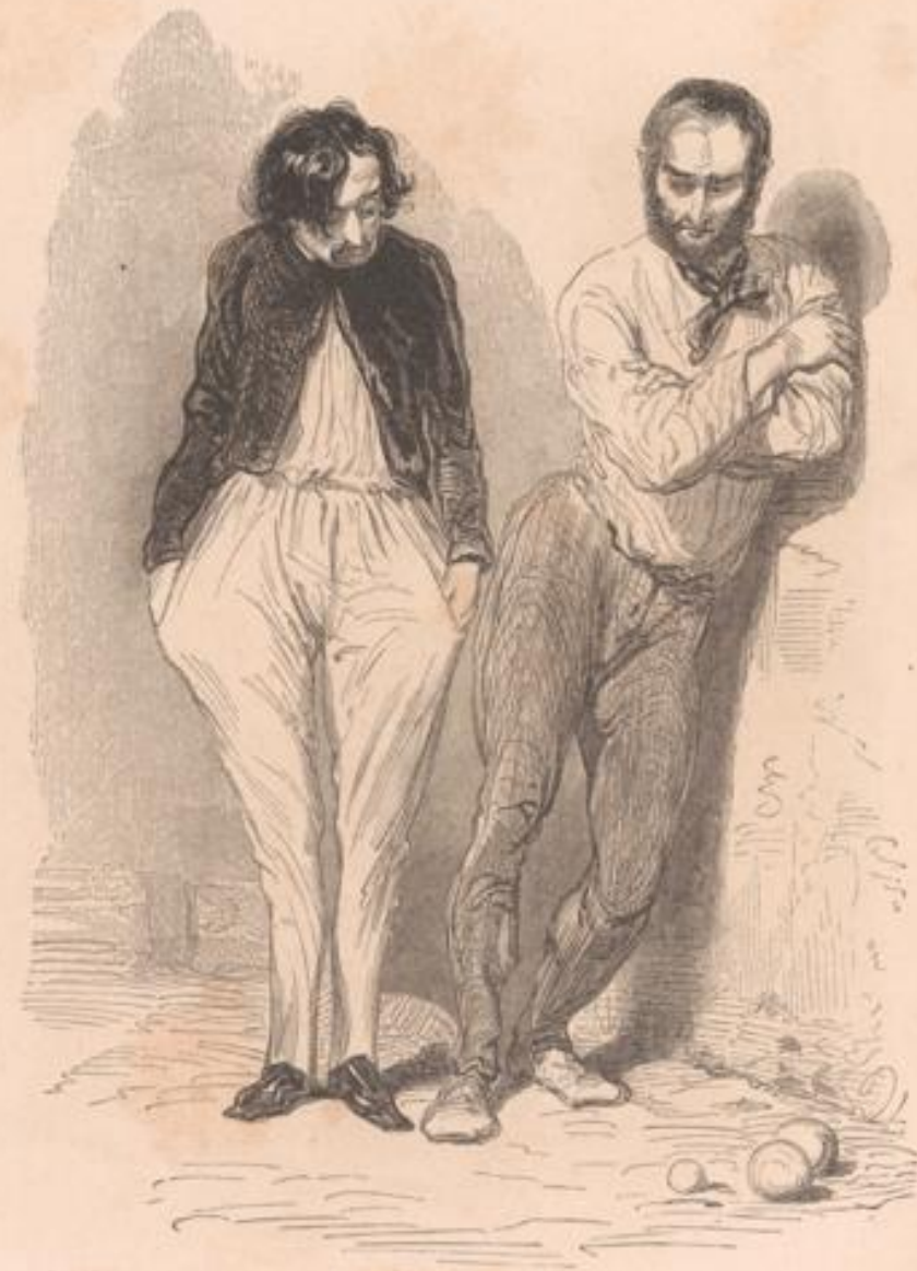
— Sans le mur, cette boule-là irait loin. — Et ton camarade aussi.