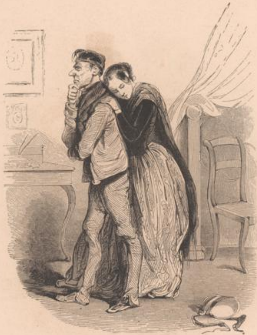
Est-il, Dieu, permis d'avoir des pensées comme ça sur la mère de son petit Joseph?