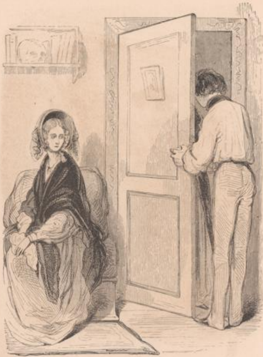
Mon cher ami, je suis en affaire avec mon oncle.