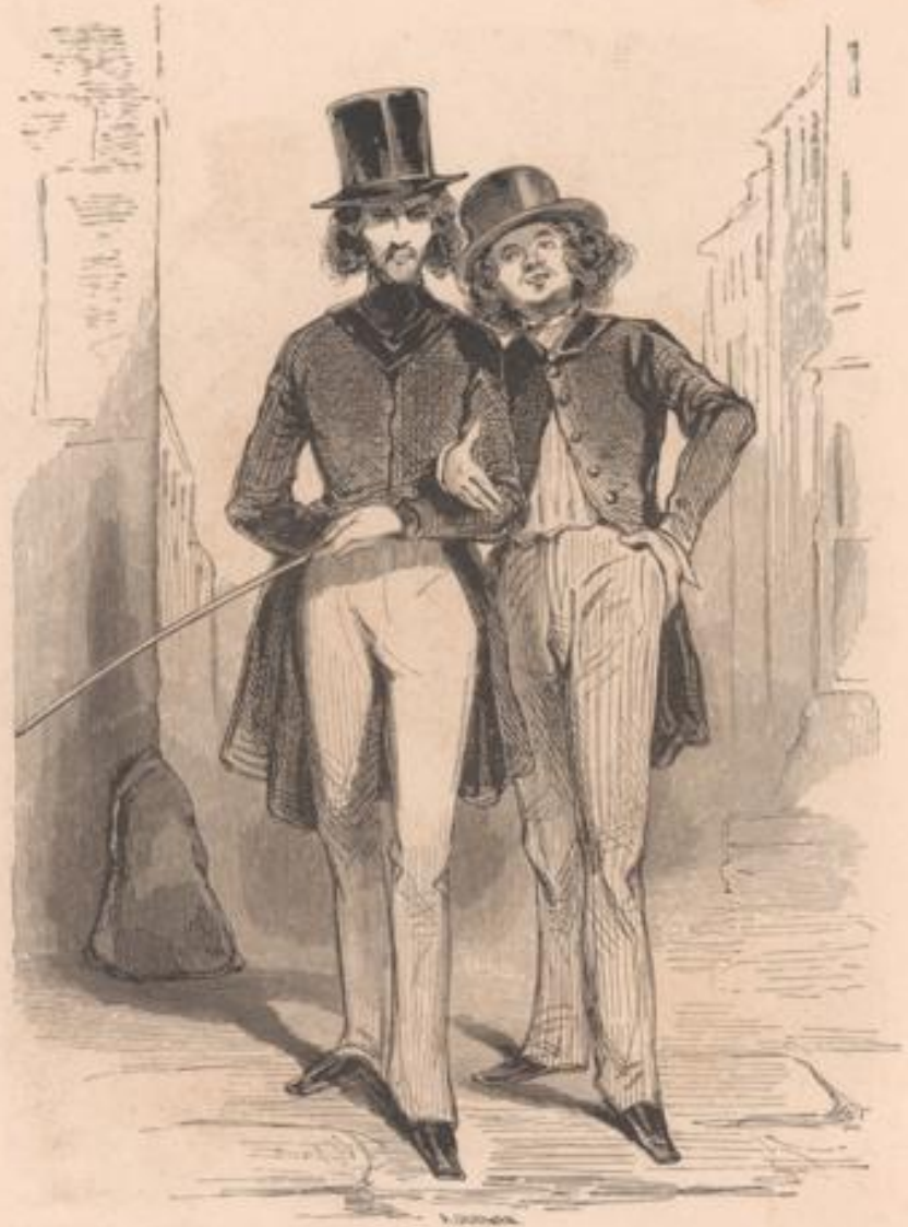
Eh! mon cher, ne te plains pas! tu seras médecin, je serai procureur du roi: quand tu seras obligé d'avoir du talent, je serai forcé d'avoir des mœurs. C'est ça qui sera dur!