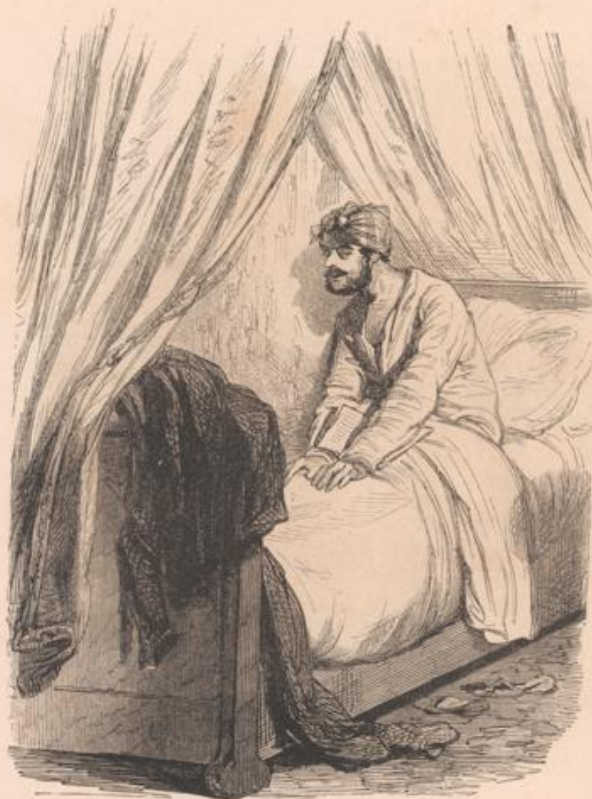
— Bonsoir, voisine! — Bonsoir, voisin! — Ça va toujours bien, voisine? — Bien. Et vous, voisin? — Dites donc, voisine? — Quoi, voisin? — Je vous aime toujours, voisine! — Bonsoir, voisin! — Bonsoir, voisine!