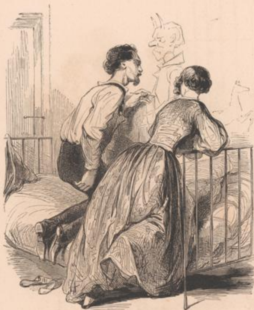
Le portrait du créancier.