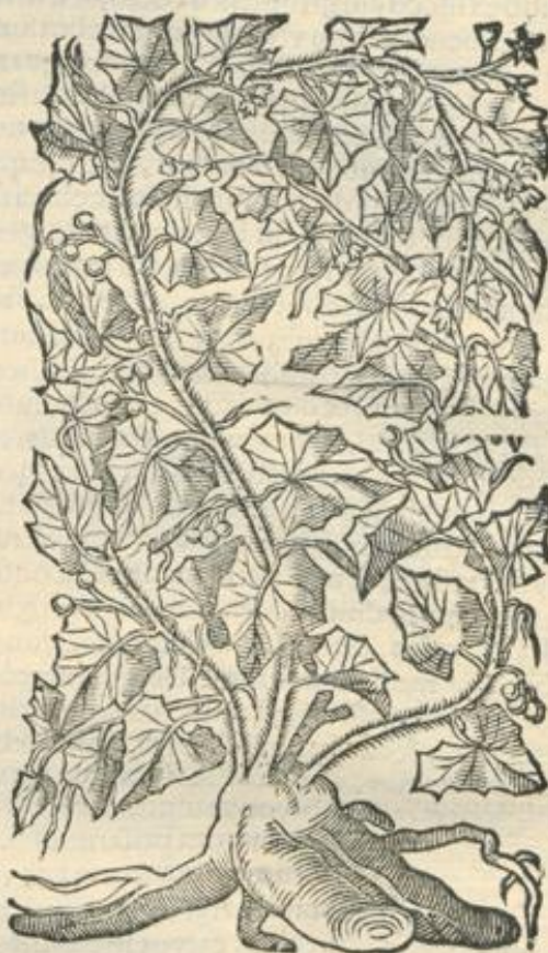
De Bryonia. Cap. XXV.

BRYONIA est planta, quam vitem albam vocant, radice foris terrei coloris, intus alba, ex qua pullulant stipites arboribus alijs plexu multiplici inuoluti soliti, & in his racemi vuis similes, quos vuas lupinas vocant. Alia est vitis nigra radice foris cineritia, intus alba, minus tamen quam prior, quae reptilium cucurbita dicitur. Minus item calida, & ad omnia imbecillior, quam alba, quod in ea plus sit substantiae terreae amarae, quam igneae aeris. Bryonia enim Diosc. calida, & sicca ordine tertio, constans substantia terrea, pauca adusta, ob id amara; multa autem ignea, acri, mordente. Galeno autem incidit, tenuat, terget, rubrificat, subadstringit. Vtriusque radix, ac praecipue succus, pituitam etiam putri cerebrum, nervos, partes respiratorias purgat, obstructions viscerum, & renum aperit, urinas mouet. Quapropter epilepsiae, vertigini, & ceteris [cerebri, &] neruorum affectibus frigidis confert aperte, ac etiam tussi, & asthma, praesertim lambendo sumptum, & laterum dolori. Turiones eius cum primum crescunt, eduntur praecipue cum aromatum, orisque odorem tetrum emendant, praesertim