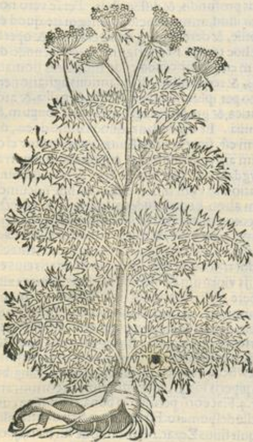
De Turbith. Cap. II.

SYLV. Huc Serapionis Turbitum tri- bitum.