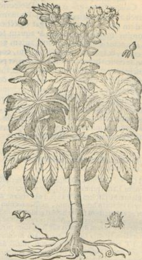
De Albemesuch. Cap. XXVIII.

A lbemesuch dicitur proprie granum ANT. Regum, & est ex eo aliud magnum, aliud paruum, & dicitur quod magnum est Kerua.