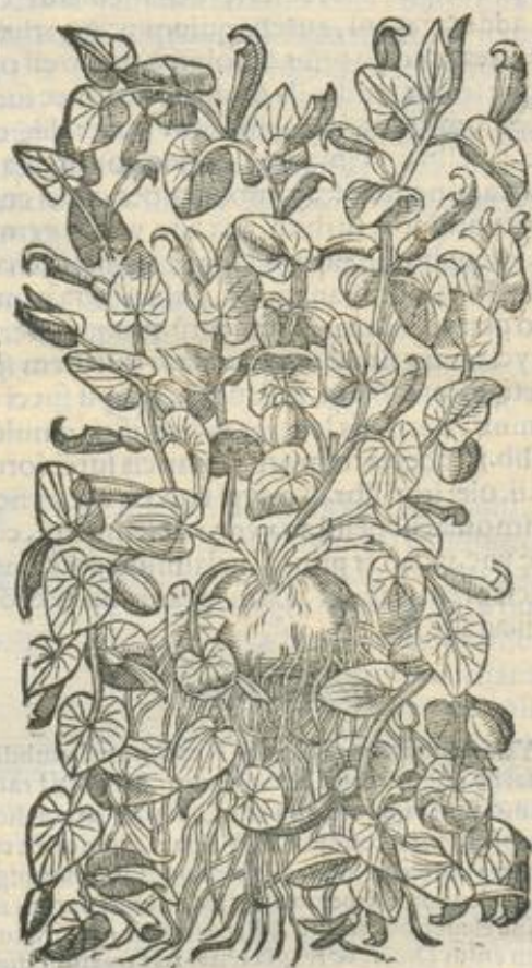
De Aristolochia. Cap. XXVII.

SYLV. Longa mat. ro- tunda semina Dioscor. Aristolochia non Dioscor. sunt hi gradus.