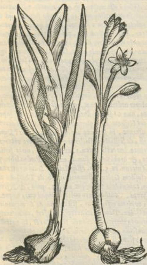
De Hermodactylis. Cap. VII.