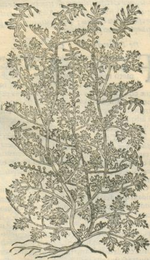
De Fumaria. Cap. XIII.

SYLV. Fumaria in superficie calida est, in profundo frigidior, non absolute frigida cum quibusdam, sicca ordine secundo. Ab illa autem substantia calida (quæ semini maior inest) est amara, & sabacris, purgatoria,