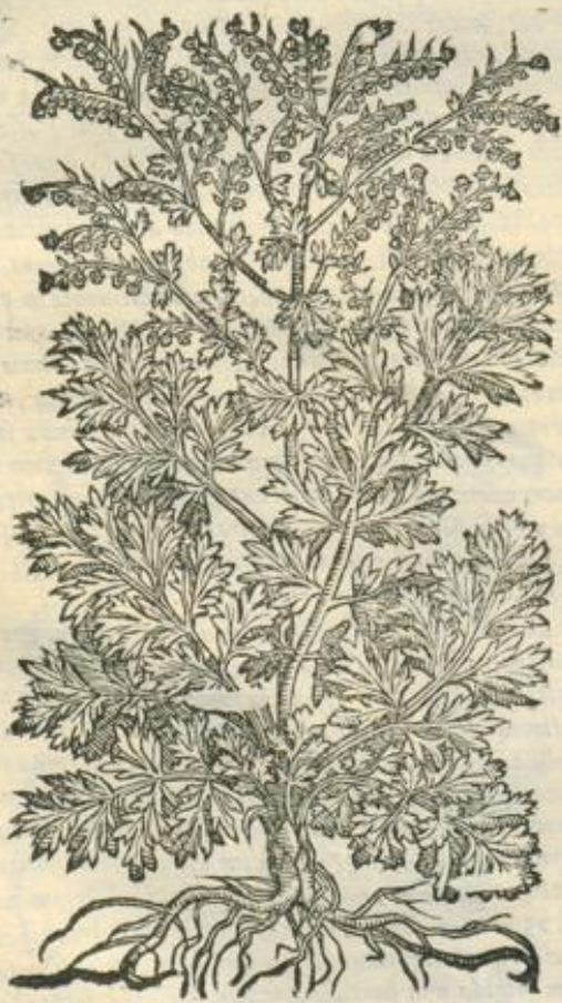
De Absinthio. Cap. XII.

ANT. A bsinthium multiplex est. † Sed illud quod intendimus, nunc est absinthium Romanum. ELECTIO. melius est, quod est remotum ab odore maris. Et quod oritur in terris liberis, & habet folia alba, lenia, & plana, asperum verò est malum. Et melius tempus col- lectionis est ver, & operationis succi ipsius simi-