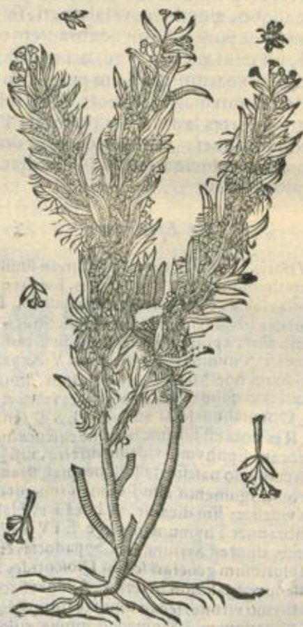
De Epithymo. Cap. XVI.

E Pithimum thymo, tymbræ, cuiusdam speciei origani, supercreuit cassurhæ modo, duplex idest, Creticum, idemque præstantius, præcipue capitulis florulentis, subrusum, acre etiam odoratu, absolutu, graue, alteru Syriacum, minus rutum, ignobilius, vt etiam pallidum, & subcitrinu, calidu, siccum secundo ordine, (Gal. tertio.) Duplici substantia