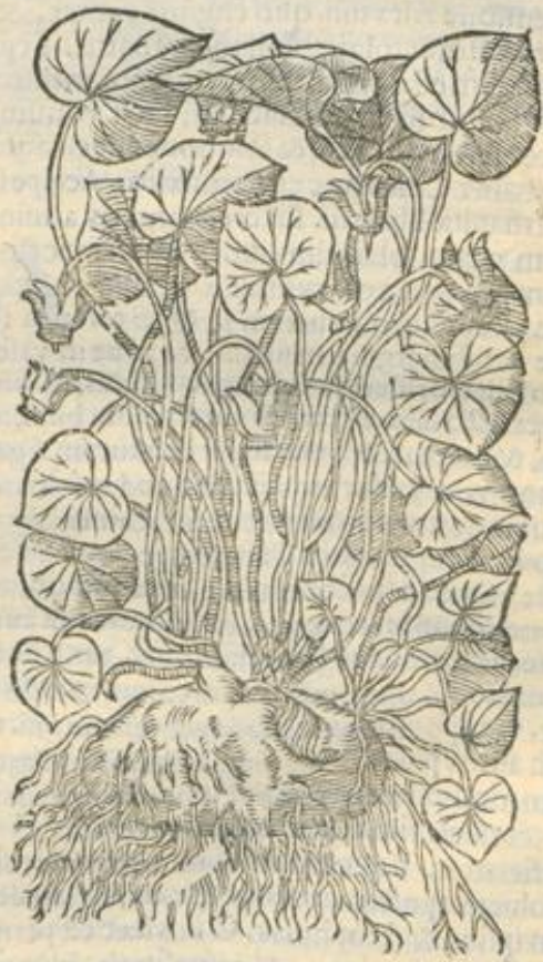
De Arthanita. Cap. XXVI.

A Rthanita est panis alcurith, & ab alijs ANT. dicitur panis fauni, & ab alijs panis porcinus, & ab alijs cyclamen. Et in- uenitur ex eo magnum, & paruum. Magni autem radix est in modum rapae rotun- da, cuius pars exterior est terrea, nigra. Inter- ior vero alba. Et eleuantur super radices fron- des, & flores secundum temitam violarum subalbidarum sine eleuatione stipitis super eius radicem. Paruum vero habet radices in bter- raneas plurimas in modum auellanae, & cice- rum. ELECTIO. vtrunque bonum est, & compe- tit vsui medicinae.