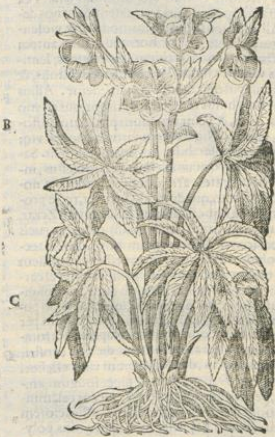
De Elleboro. Cap. XXX.