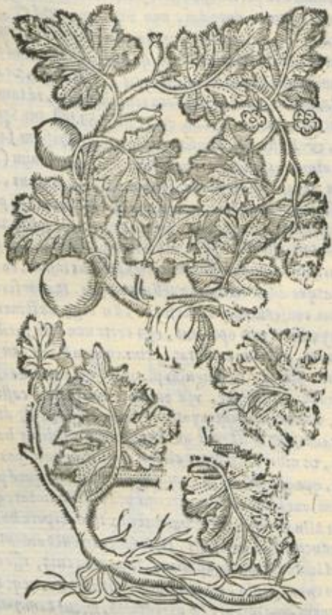
De Colocynthide. Cap. IIII.

S YL. V. Colocynthis eſt cucurbitę ſylueſtris fructus, & planta, ſel terrę etiam quibuſdam dicta, & Arabibus plantarum mors, quod herbaſ alias ſibi vicinas veneni modo interficit, vt vicina illi terra aduſta videatur. Folijs, ſarmentis ſuper terram ſerpentibus fructu licet minoribus, cucurbitam imitatur. In ea mas eſt, foris lanuginofus, nigricans, ſubſper, durus, grauis, & femina præſtantiſſima, rara, lenis, vti eius interior medulla albiſſima, rara, lenis & leuis: quoque leuior, eo melior, ſitq; ex agro, laxo, arenoſo, libero, Autūno lecta, cum languefcente virore ceperit in luteū colorem mutari. Immatura, & his notis deſtituta, mala, ſtutus terminoſos, & moleſtiſſimos excitat, immodice purgat, vt etiam ſanguinem educat, & ſepe mortem afferat. Peſſima eſt etiā, ac venenoſa, quam produxit vnicam tota vna planta. Quę planta ſi loco illo eſt vnica, multo pernicioſiorem fructum parit, præſertim ſi locus ille eſt vliginoſus; vel puluerulētus, vel thermis propinquus, vel ſerpentibus abundet. Calida eſt, ac ſicca ordine tertio, ignea ſubſtantia, & terrea per vſtionem tenuata [eximie amara] cōſtat. Pituitam, & alios humores craſſos, & glutinoſos, magis ex profundis partibus, & diſtan-