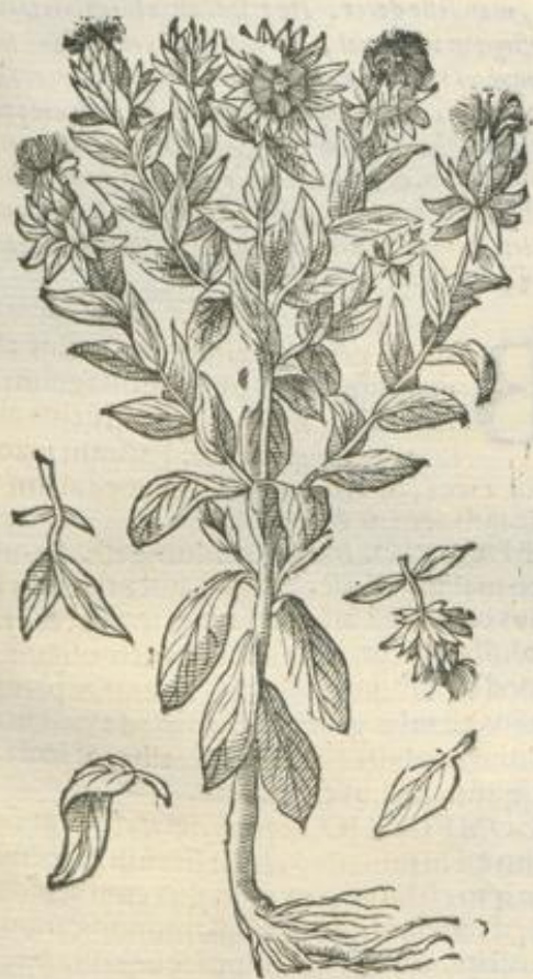
De Carthamo. Cap. XI.

ANT. C arthamus duorum modorum est. Est enim domesticus, & syluestris, & dixerunt quidam, quod nil est ex speciebus carthami: & elongati sunt.