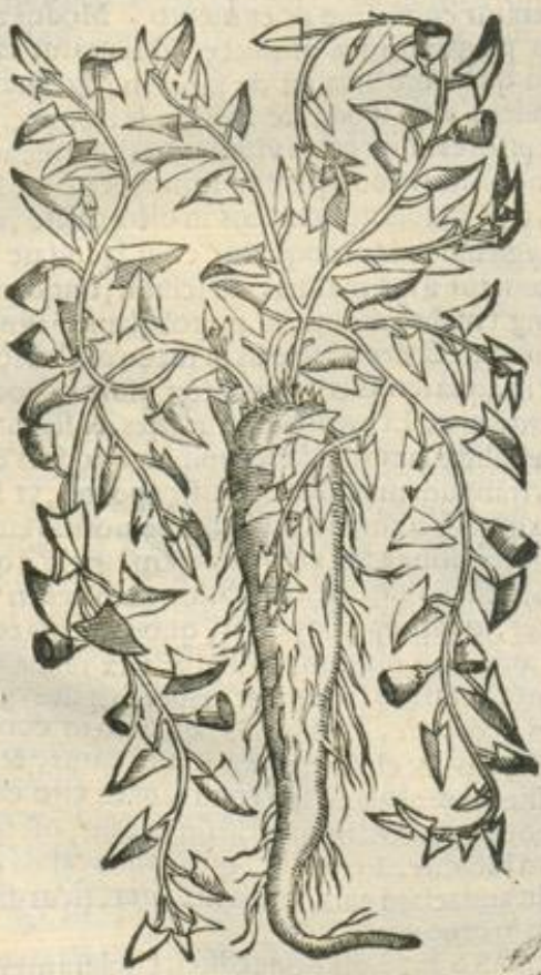
De Scammono. Cap. I.

SYLV. Scammonia propria planta, scammonium liquor & succus. Colophonium. Plin. et Dioscor. Alia Dioscor. laudatur. S cammonium est medicamentorum purgantium maximam, vt purgatorij nomine simpliciter pronunciatum, per antonomasiam, scammonium intelligatur, vt ait Democritus. Est autem lacteus ipse succus postremæ volubilis, nata in Antiochia, Armenia, regione Scenitarum, Arabia, Turchia. Plurima etiam apud nos nascitur, sed praua, loci