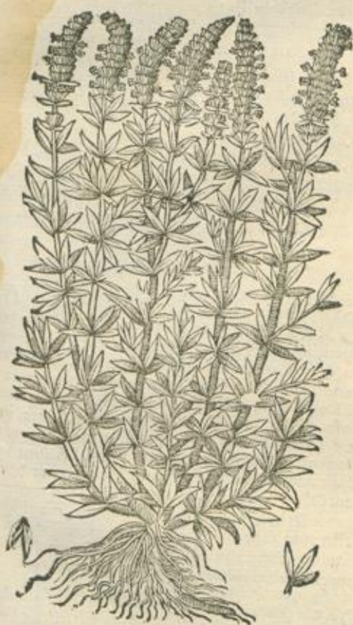
De Hyssopo. Cap. XVIII.

H YSSOPUS duplex, hortensis, & montanus ille semicubitalis, caulibus, & ramis paucioribus, quam thymus, folijs thymi, sed maioribus, flore purpureo: hic breuior, & folijs minoribus. Hyssopus est calidus sicco ordine secundo, vel potius tertio. Pituitam etiam crassam, & putrem purgat, sed minus quam thymus. Thoracem, & pulmones, partesque alias respiratorias pituita eadem, & humoribus alijs putribus, & pure expurgat: & tenuando, ac incidendo, tergendoque sputum facile reddit. Ob hæc asthmatis, tussi à materijs prædictis est salubris, & epilepsia pituitosa, cæterisque cerebri affectibus pituitosis, præsertim sumptus syrupo, vel decocto cum oxymelle scillitico, & cum origano, etiam in omni aetate expertus, coctionem quoque iuuat, propter hæc