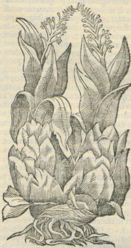
De Scilla. Cap. VI.