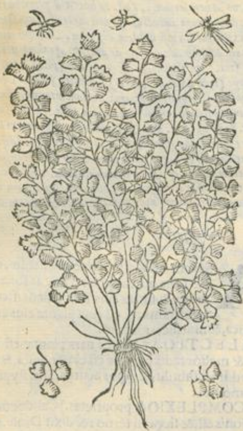
De capillis Veneris. Cap. XXI.

A ui oppilationum, & solutiui ventris, & proprie qui ex eis sunt recentes: sicci vero sunt constrictiui, & prohibitiui fluxuum.