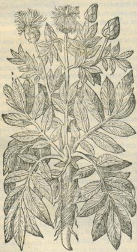
De Centaurea. Cap. X.

ANT. Mans ad dr. Ant. datur Diosc. & Gal. tenuis ad cr. et dicitur dicitur colligunt in aqua rosae sa. Paul.