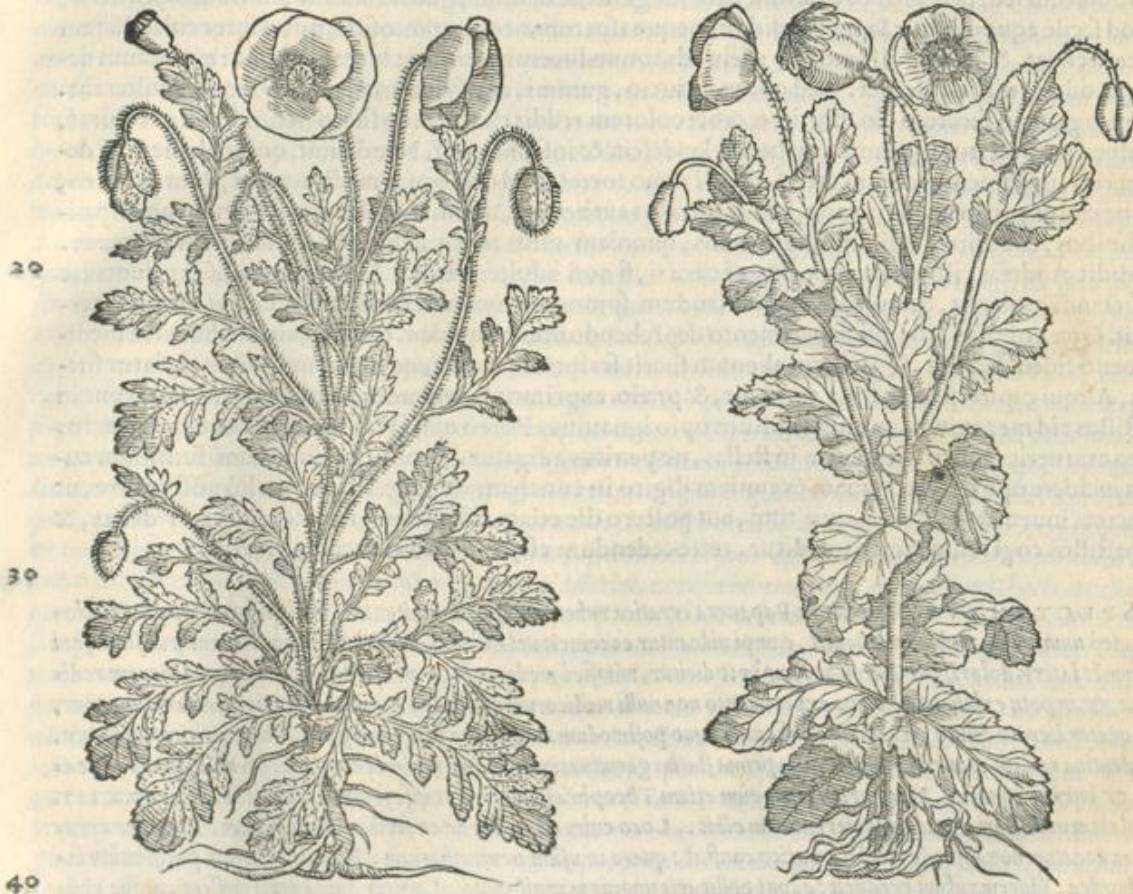
Μήκων ἑρταῖς. PAPAVER ERRATICVM. CAP. LIX.

PAPAVER erraticum, quod rhœada vocant, vere quidem in aruis cum hordeo nascitur: flore protinus deciduo, vnde & nomen apud Græcos accepit. Folia erucae, aut origano, aut eichorio, aut thymo similia spectantur, sed longiora, diuisa, scabra: iunceus ei caulis, rectus, cubitalis, asper: flos syluestris anemones, puniceus, interdum albus: oblongum caput, sed quàm anemones minus: semen rufum: radix longa, subalbida, minoris digiti crassitudine, gustu amara. Huius capita quinque, aut sex in vini cyathis tribus ad dimidias decocta, potui dabis, quibus somnus accersendus est. Semina acetabuli mensura ex aqua mulsa pota, aluum leniter emolliunt: ad idem præstandum mellitis placentulis, & dulciarijs libis admiscetur. Folia cum calycibus illita, inflammationes sanant: eorundem fotu, & perfusione somnus allicitur.