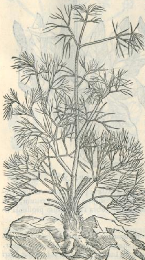
T 2 plantam