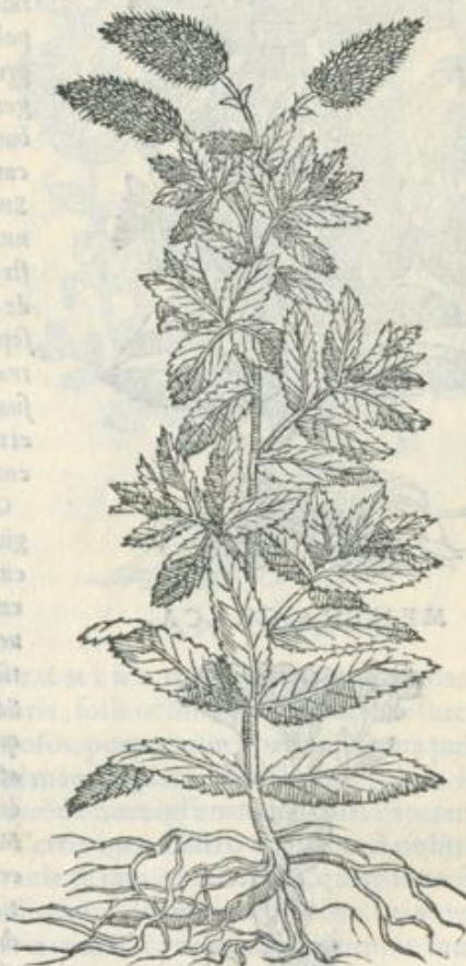
Ἡ δ' ὄσμος. MENTHA.