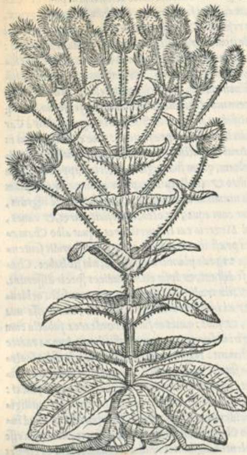
VIRGA PASTORIS MINOR.