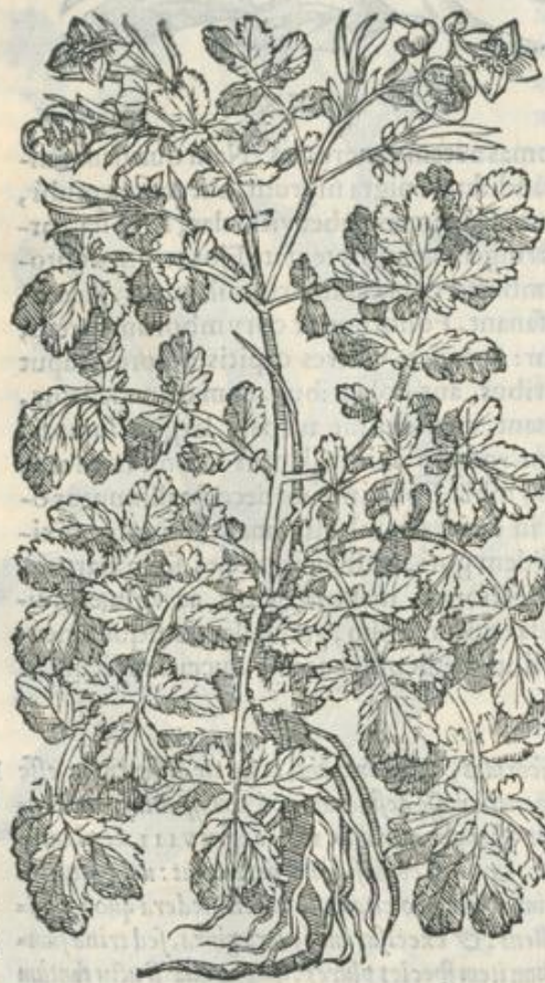
Chelidoni maioris confederatio.

† Non ab re quidem suspicandum est (ut doctissime adnotauit Marcellus) huic loco in Dioscoride mendum subesse, & quod non ἐρυθρὰ, hoc est, rubra, ut habent uulgati codices, legendum sit, sed ἐρυθρότερα, id est, cōcinniora. Nam praeter alias rationes, huic lectioni adstipulatur Theophrastus, qui lib. III. ca. XVIII. de plantarum historia eo nomine hederæ helicis folia depingit.