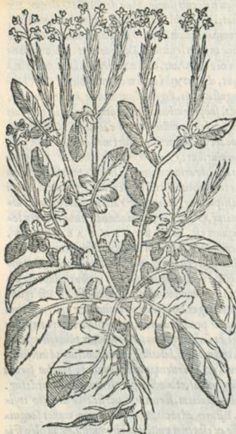
Erysimi, seu Irionis consideratio.