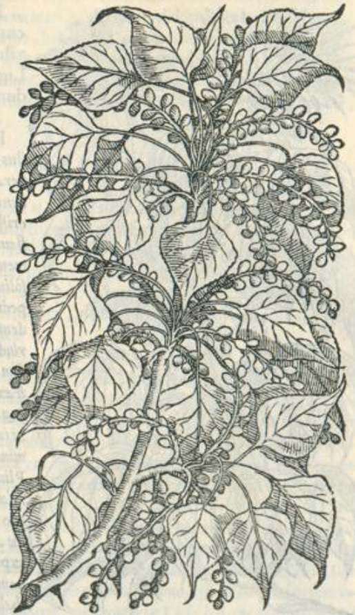
Λεύκη, καὶ Αἴγυρος. POPVLVS ALBA, ET NIGRA. CAP. XCIII.

POPVLVS albæ populi cortex uncia unius pondere, ischiadicis, ac urinæ stillicidio prodest. sterilitatem inducere tradunt, si cum mulino rene bibatur. Folia quoque cum uino post purgationes pota idem præstare produntur. Tepens foliorum succus utiliter aurium dolori instillatur. Pilulæ, quæ primo foliorum partu exiliunt, trita & cum melle illita, oculorum hebetudini medentur. Memoriam prodiderunt, corticem albæ populi, & nigrae particulatim cæsum, & fulcis stercoretis mandatum, omni tempore anni edules fungos proferre. Populi nigrae folia cum aceto illita, magna utilitate podagricis doloribus illinuntur. Resinam populus fundit, quæ in malagmata additur. Semen potum ex aceto comitialibus utile est. Lacrymam populorum commemorant, quæ in Padum amnem defluat, durari, ac coire in succinum, quod electrum uocant, alij chrisophorum. Id attritu iucundum odorem spirat, & aurum colore imitatur: tritum, potumque stomachi, uentrisque fluxiones sistit.