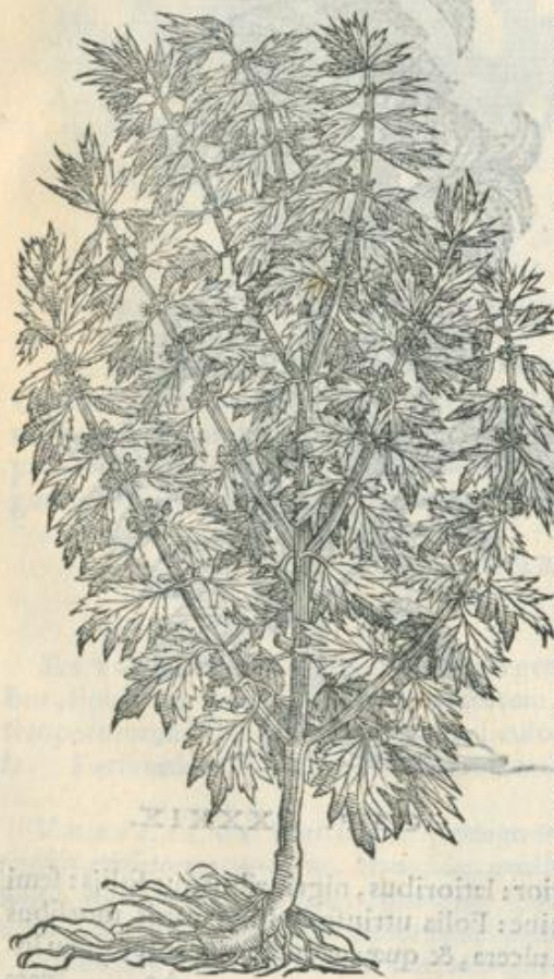
Cardiacæ hi- storia, & vires

xata, panos, tubercula, parotidas, suppurationesque fa- nant: lienosis cum cerato imponuntur: faciunt ad pro- fluuiam narium cum succo trita, & naribus indita: menses ciunt eadem detrita cum myrrha, & imposita: prociden- tes vulvas recentia contactu resiliere cogunt. Semen po- tum ex passo uenerem stimulat, & vuluæ ora patefacit: cum melle delinctum orthopnœæ, lateris & pulmonum inflammationibus prodest: thoracem expurgat. eroden- tibus medicamentis admiscetur. Cocta cum conchis folia aluum emolliunt, vrinas mouent, inflationes di- scutiunt: decocta cum pitana, uitia pectoris extrahunt: mulierum menses euocant, cum myrrhæ modico pota. Inflammatione turgentem vnam, gargarizatus succus reprimat.