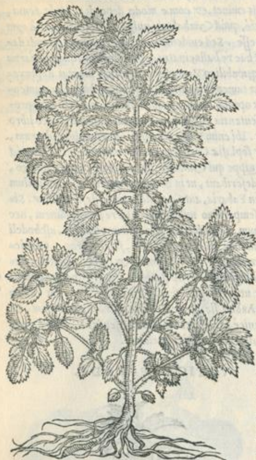
Vrticæ con- sideratio.