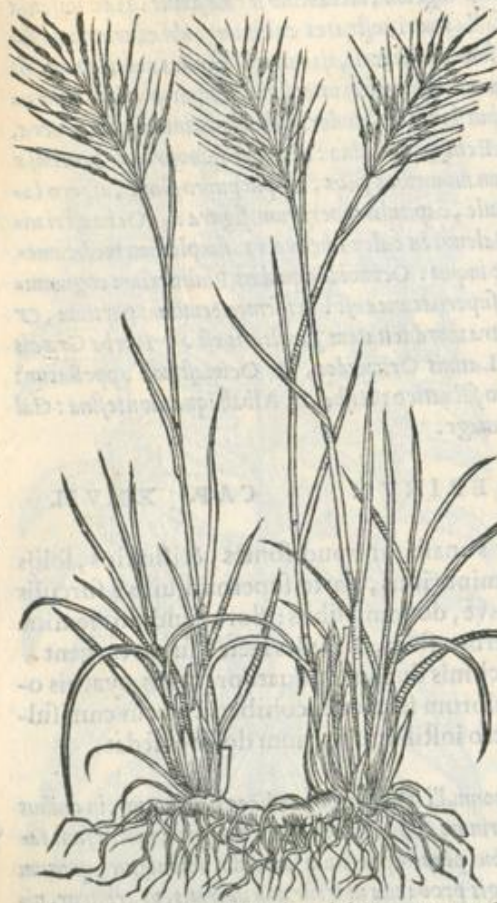
Graminis historia ex Pli.