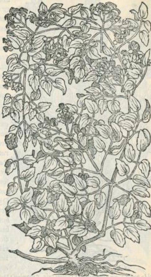
Κλημάτις ἑτέρα. CLEMATIS ALTERA. CAP. VII.

Es t & altera Clematis, quæ viticulosum emittit ramulum, rubescentem, lentum: folium gustu admodum acre, ac exulcerans. repit per arbores, vt smilax. Semen tritum pituitam, bilem q; detrahit, in aqua aut hydromelite potû. Folia eius illita, lepras purgant. Cum lepidio conditur ad cibos.