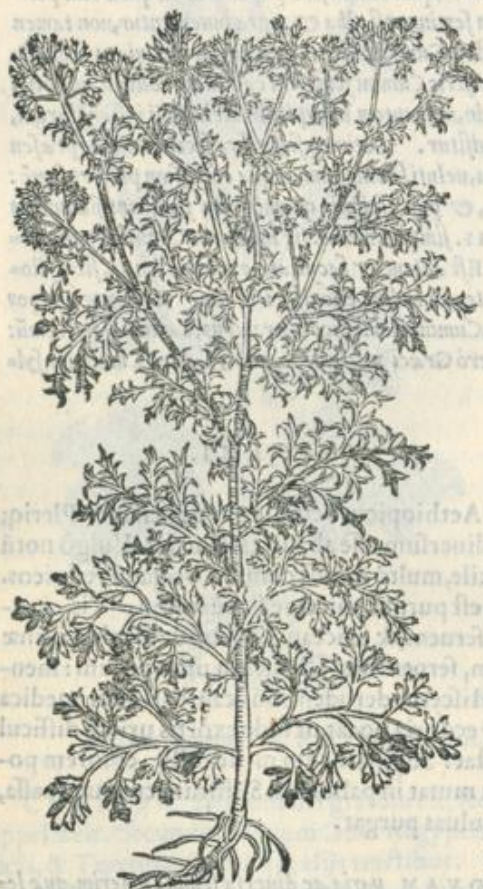
Coriandri facultas ex Gal.

CORIANDRVM, aut coriannum uulgaris est notitia: uim refrigeratoriam habens. Quare illitum cum pane, aut polenta, ignibus sacris, & ulceribus, quæ serpunt, medetur. Epinyctidas cum melle, uel uua passa, testium inflammationes: carbunculosque sanat: cum faba fresa, strumas, & tubercula discutit. Tineas interaneorum expellit semen, cum passo modicè potum, & genituram adauget: largius tamen sumptum, mentem non sine periculo mouet. quare continuo, & copiosiore usu abstinendum. Succus cum cerussa, spumæue argenti, necnon aceto, & rosaceo illitus, ardentis summæ cutis inflammationes emendat.