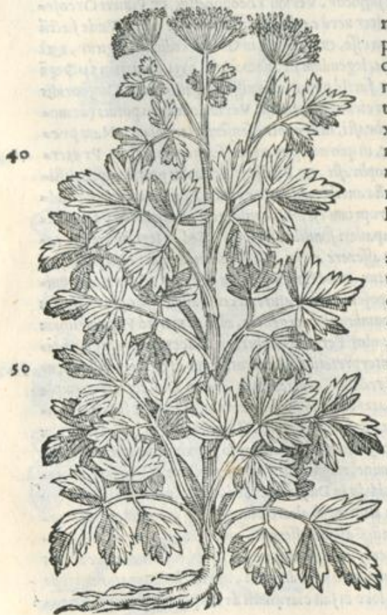
Σέλινον. APIVM. CAP. LXIII.

HORTENSIS Apij herba ad eadem, ad qua coriandrum conuenit. Inflammationibus oculorum cum pane, aut polenta illinitur: aestuantem stomachum mulcet: mammarum duritiam ex lacte concreto contracta; reprimit. Vrinam ciet, siue crudum, siue coctum edatur. Decoctum eius, radicisque potum, uenenorum noxae resistit, cum uomitiones excitet: aluum cohibet. Semen vehementius vrinam pellit: contra serpentium uenena, aut epotam argenti spumam auxiliatur: inflationes discutit. Admiscetur medicamentis, qua dolorum leuamenta praestant, theriacis quoque, ac tussis remedijs.