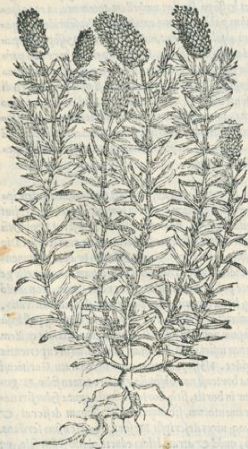
Stoechadis cõ- sideratio.