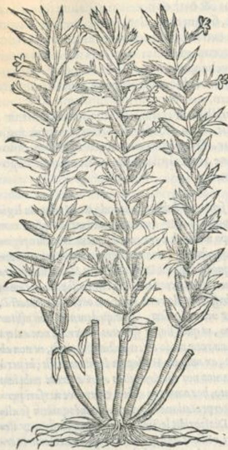
Gratiolæ hi- stor. & uires.