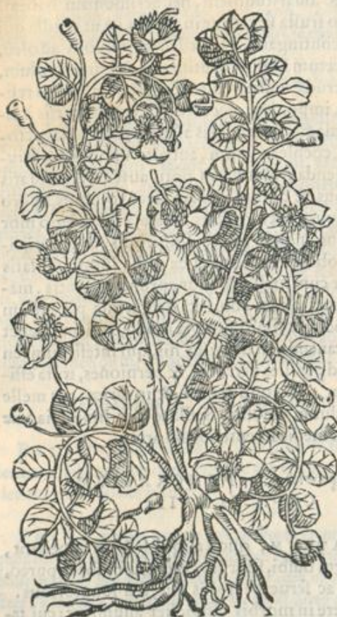
Capparú con fideratio.