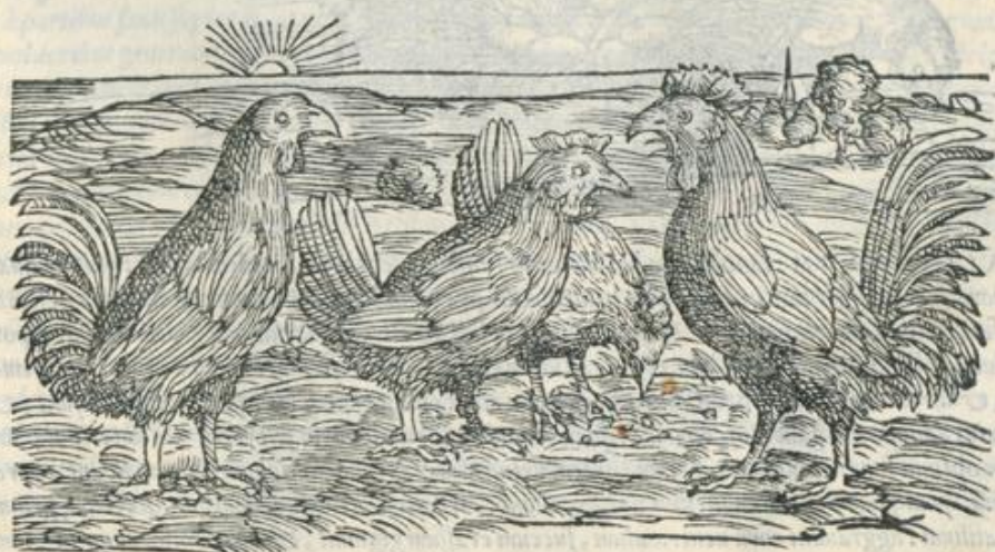
f 3 TAMETSI

40 DISSECTAE gallinæ, & adhuc calentes appositæ, serpentium moribus auxiliantur: sed identidem alias sufficere oportet. Earum cerebellum in uino bibendum datur contra serpentium morsus: sanguinem à cerebri membrana profluentem sistit. Quæ interiore uentriculi galli sinu residet membrana, secti in laminas cornus specie similis (ea uerò inter coquendum abijci solet) siccat, tritaq; in uino conuenientissimè stomachicis datur in potu. † Ius è uetere gallinaceo aluum deiecit. Abiectis itaque interaneis salem conijci oportet, & confuto uentre decoqui in uiginti sextarijs aquæ, donec ad tres heminas redigantur: totum id refrigeratum sub diuo, datur. Aliqui incoquunt olus marinum, mercurialem, cnicam, aut filiculam. Crudos humores, crassosque, atram bilem, & strigmenta elicit: prodest longis febribus, suspirijs, articularijs morbis, & inflationibus stomachi.