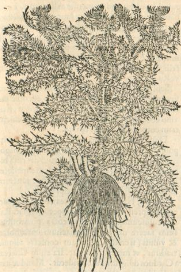
Carduus siluestris alter.