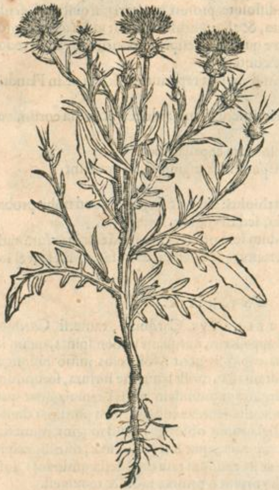
Spina Solstitialis altera.