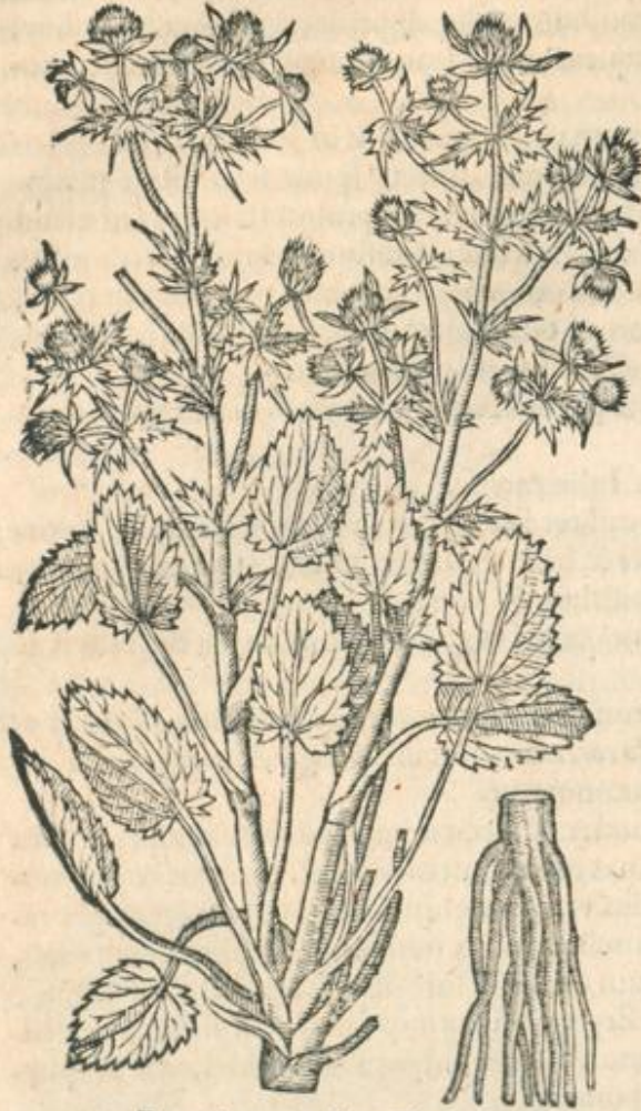
Eryngium pumilum Clusij.