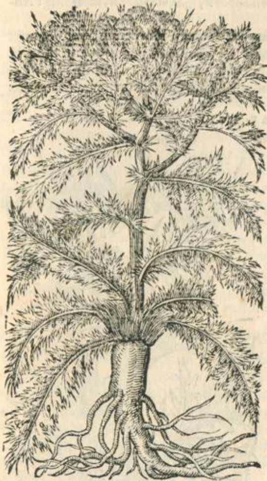
Chamæleon niger Salmanticensis.