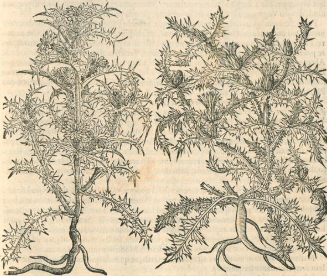
Cardui Chrysanthemi altera icon.

C HRYSANTHEMO Carduo caules à radice subinde complures efferuntur rotundi ac ramosi: folia autem hos conuestiunt oblonga, pulchrè virentia, utroque latere profundius incisa, ac spinis per angulos horrentia: flores à foliorum alis è paruo acanaceo capitulo foliosi prodeunt, Cichorij floribus persimiles, sed auri colore lutei, latum, planum, paleaceumque semen, non magnum, nulla lanugine implicitum succedit: radix longa, digitalis crassitudinis, dulcis ac mollis, esuique idonea; qua & sues delectantur. Effluit autem ex hoc Carduo, quacumque parte vulnerata, albidus & lacteus succus.