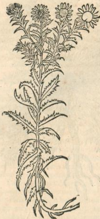
Carlina filuestris minor.