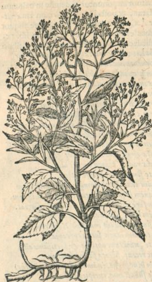
Capficum oblongioribus siliquis.