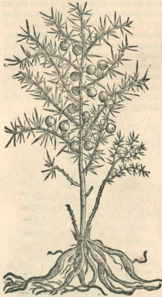
Asparagus siluestris alter.