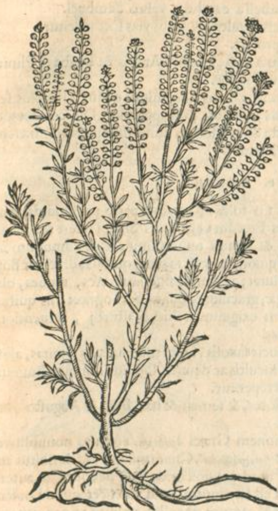
Draba siue Arabis aut Thl. spi Candia.