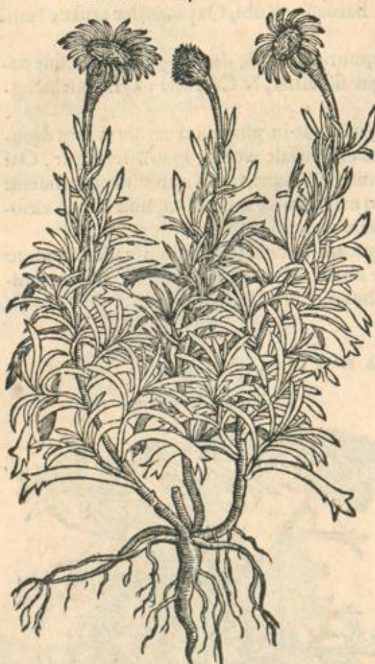
Sinapi sativum prius.