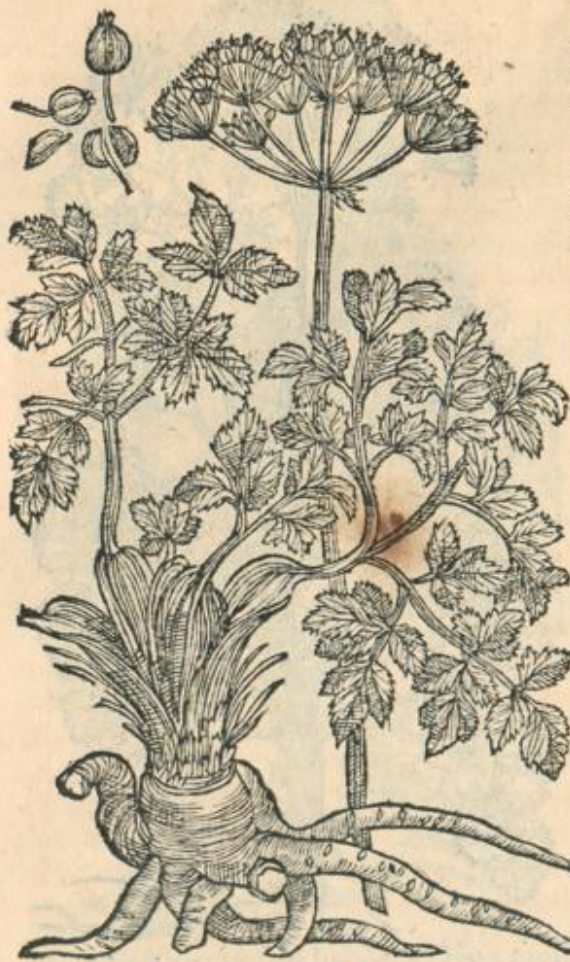
Smyrnum Amani montis.