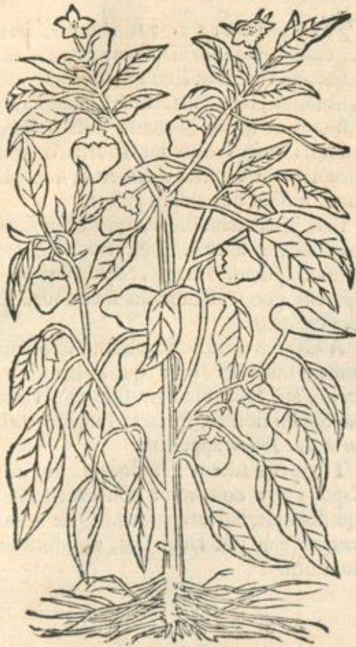
Capficum minimis filiquis.