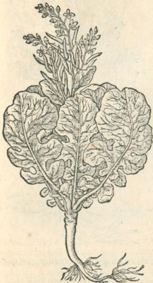
Brassica rubra capitata.