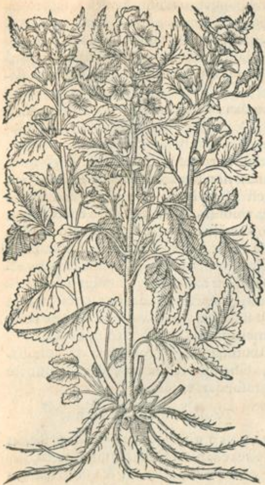
Althæa hortensis siue peregrina.