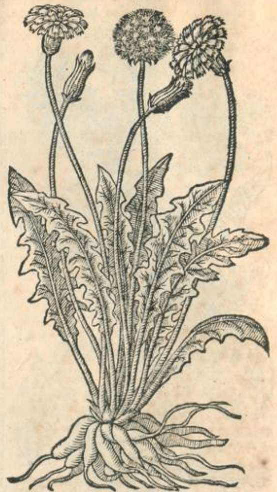
Dens Leonis Monspeliensium.