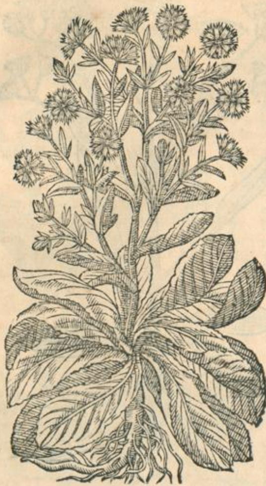
Cichorium latioris folij.