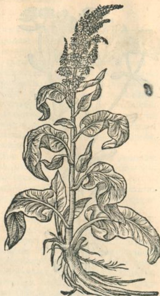
Hippolapathum siue Rhabarbarum Monachorum.