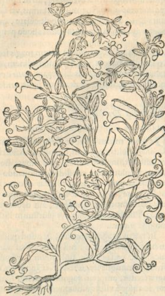
Lathyrus siue Cicercula.