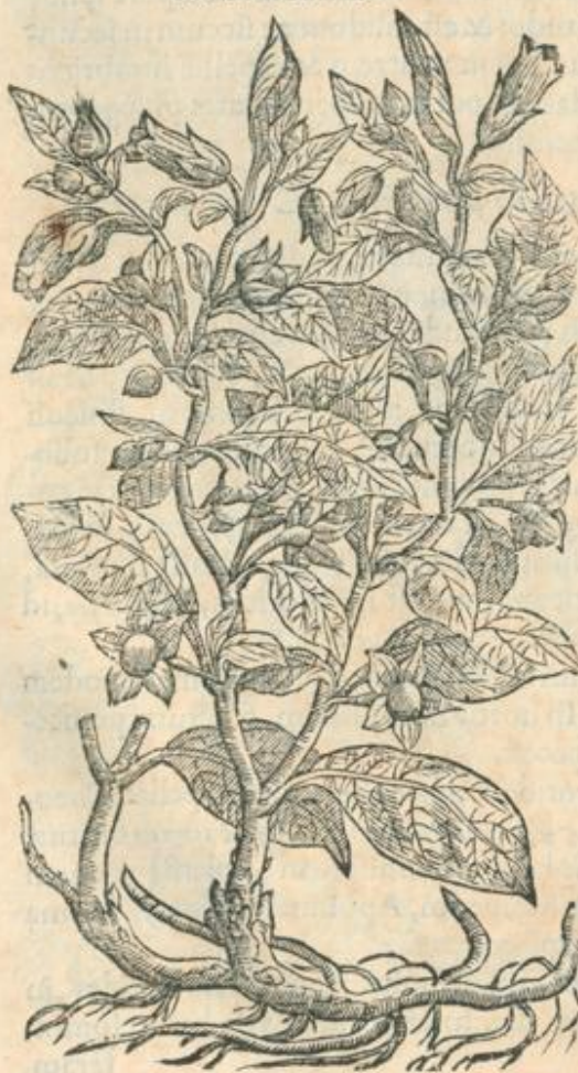
Mādrago- ras Theo- phraſti.

L ETHALI Solano caules surgunt bicubita- les aut altiores, rotundi, mediocris crassitu- dinis, ramosi, e subrubro colore nigricantes; quos conuestiunt oblonga, lata, mollia, & nonnihil lan- uginosa folia, maiora latioraq; quàm Solani: flo- res oblongi, caui, e foliorum alis, obscuriore pur- pura nigricant: bacca acino vix simillima succe- dit, singulis vnica, splendide nigricans, magnitu- dine fere mediocris Cerasi, exiguo semine graui- da: radix longa, magna, inalbicans, diuturna ac viuax, in propagines plures distribuitur.