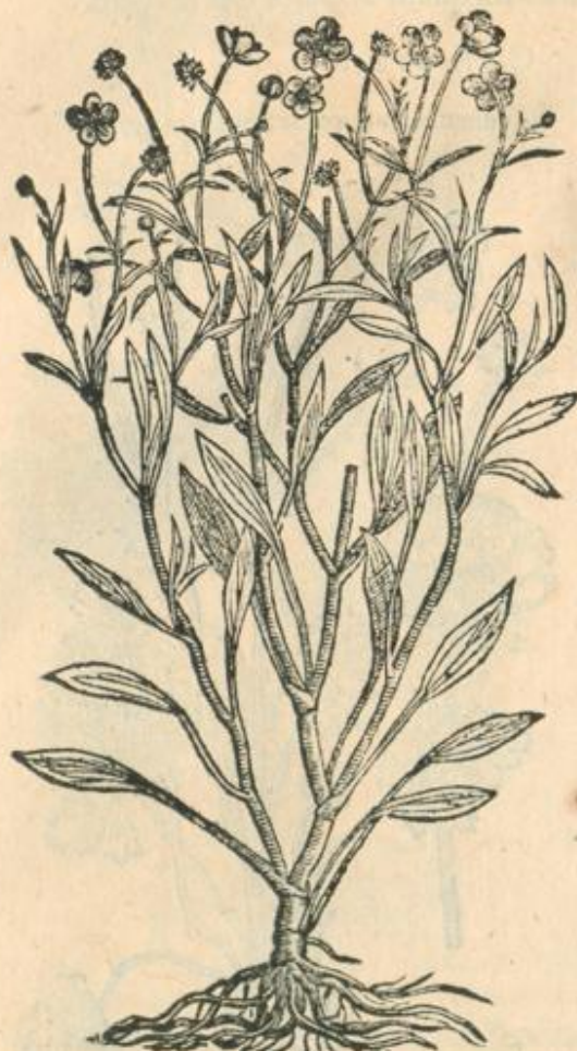
Flammula Ranunculus folio ferrato.