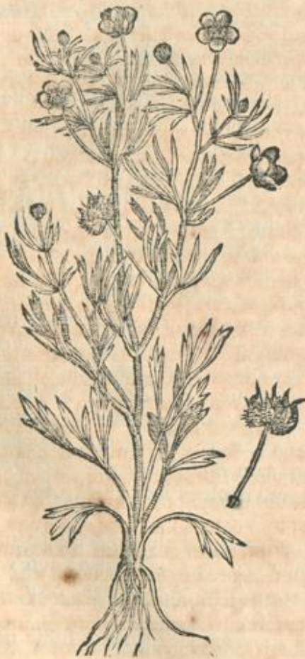
Ranunculus filuestris III.

Proximam speciem nostri Λυπαεῖς κλαυθεν / id est, vngues aut pedes Leopardi dicunt. atque hic est Ranunculus auricomus, & Democriti Chrysanthemum. Plerique minùs rectè Pedem coruinum faciunt. Posset iste Dioscoridis secundo respondere, nisi is, qui Illyricus cognominatur, huic similior esset.