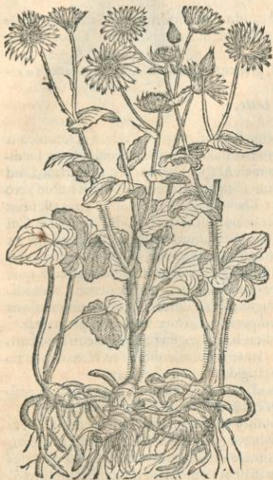
Aconitum Pardalianches alterum.