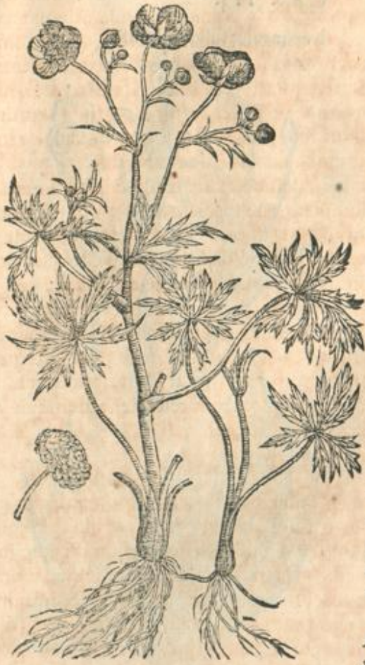
Ranunculus filuestris II.

nant, minora ac teneriora sunt folia, sed magis ac variè dissecta, diluti viroris: cauliculi recti, rotundi: flores parui, lutei, pallentes; quibus subnascitur non Asparagi cacumini similis orbiculus, sed latum, asperum, & pungens capitulum, ex aliquot congestam feminibus maiusculis, planis, acuminatis & breuibus, minimè tamen innocentibus, spinis obtitis: radix candidis quoque & capillaceis fibris constat.