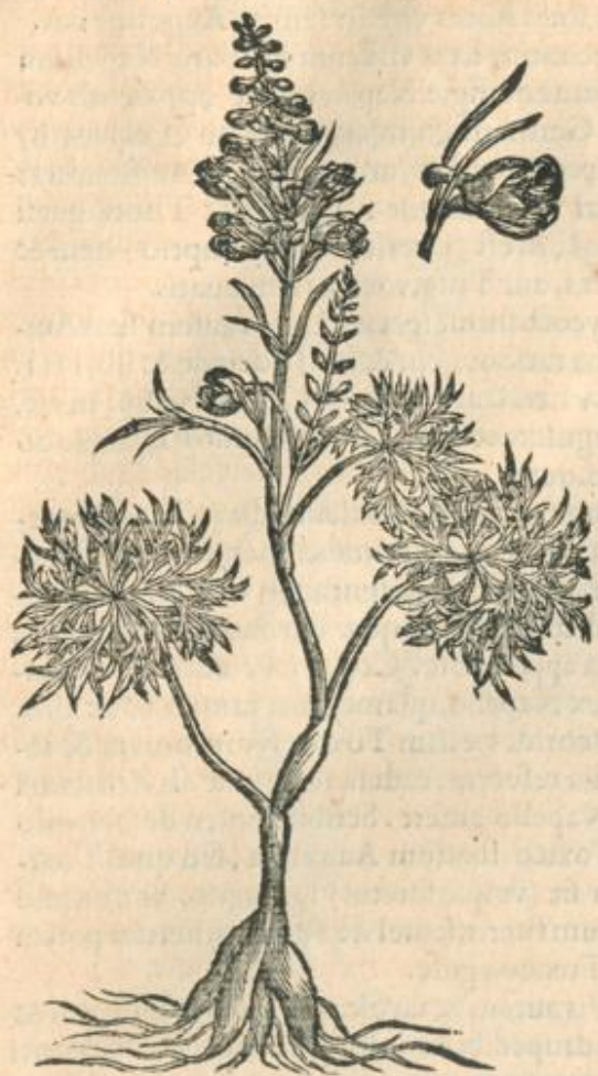
Lycoctonon caeruleum paruum.