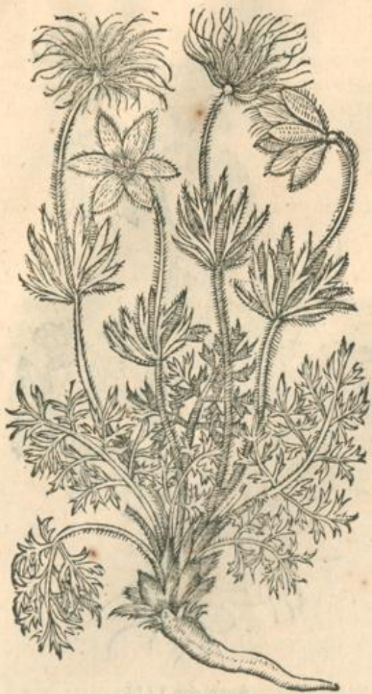
Pulsatillæ altera Icon.