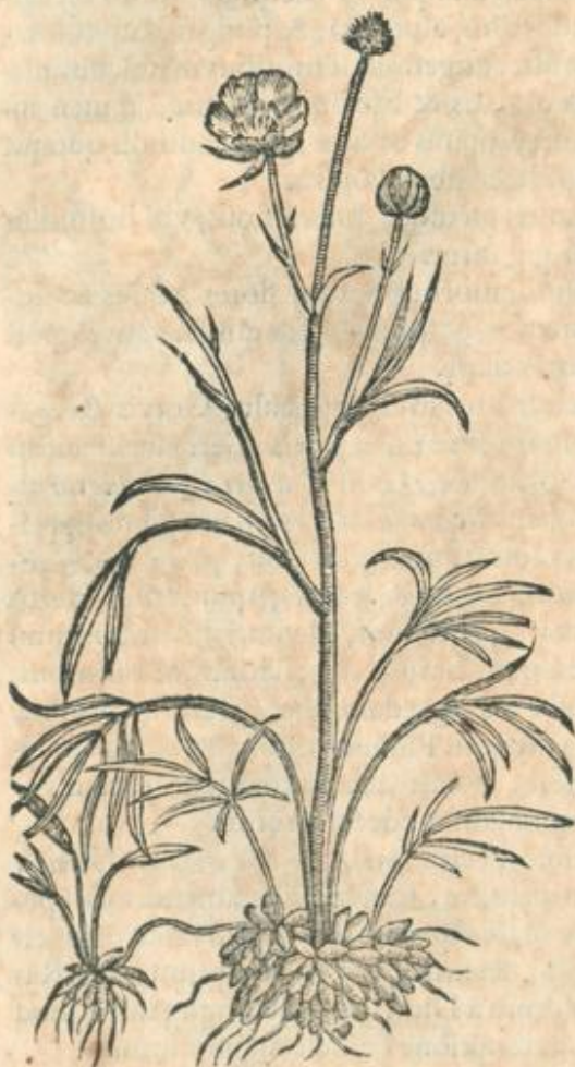
Ranunculus folio Graminis.