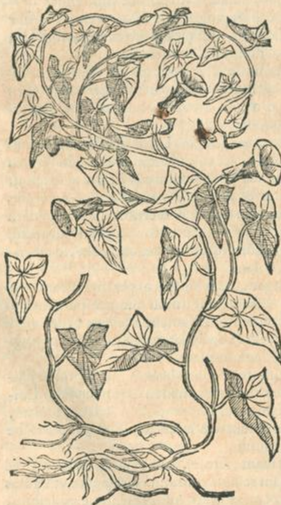
Smilax læuis maior.

SMILACIS herbæ duo apud veteres genera reperiuntur: asperum vnum: læue alterum. De illo posterius, de læui nunc agetur.