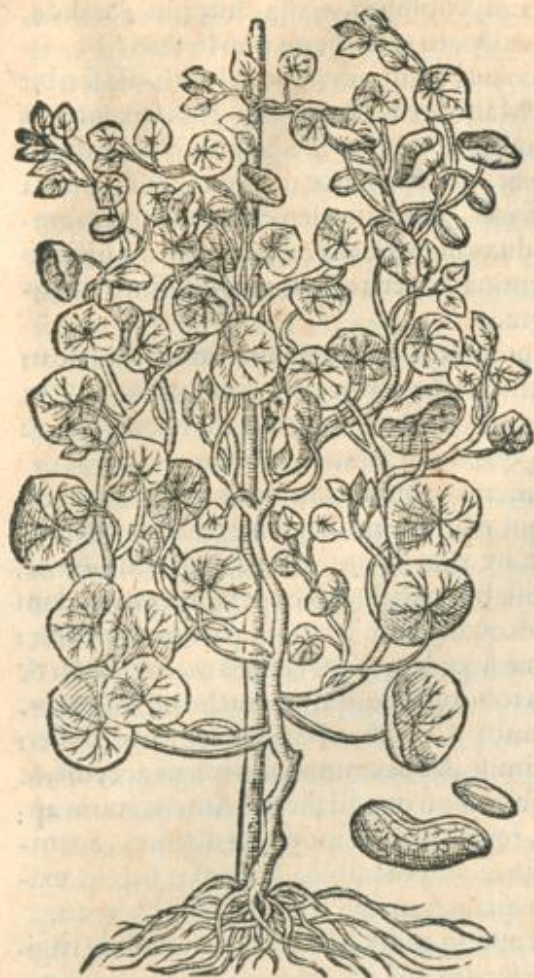
Nasturtij Indici flos.