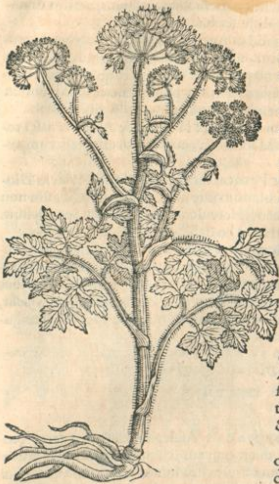
Panaces Heraclium, vel potiùs Spondylium alterum.