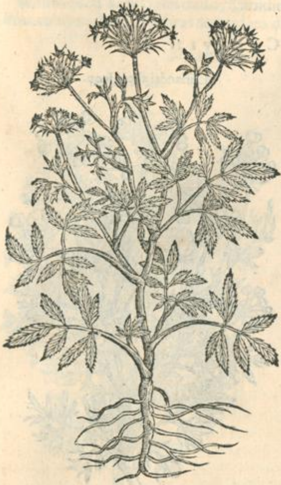
Ammi alterum paruam.