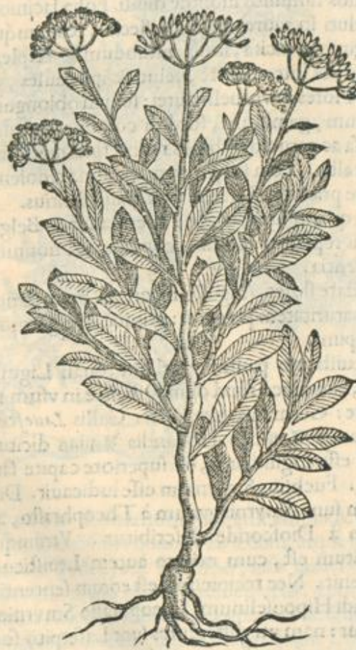
Sefeli Æthiopicum frutex.