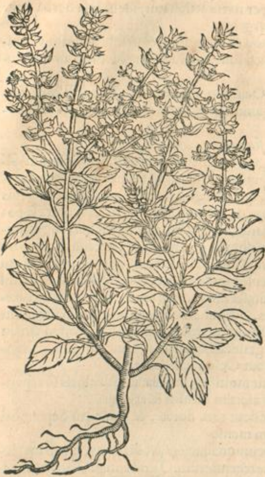
Ocimum tertium maximum.