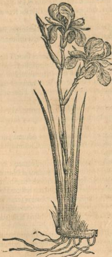
Iris minor, siue tenuifolia.

P RÆTER Irides superiore capite descriptas, reperiuntur & aliae quaedam Irides, de quibus deinceps agendum. Harum vna minor, & tenuifolia non temerè appellatur; altera Chamæiris.