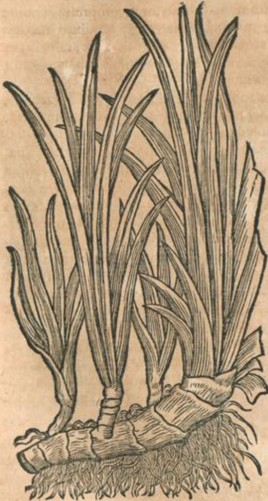
CAP. VII. Acorus cum Iulo.