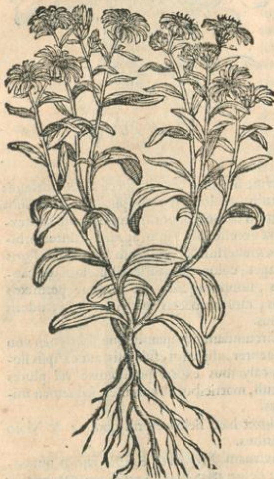
Aster Atticus supinus.