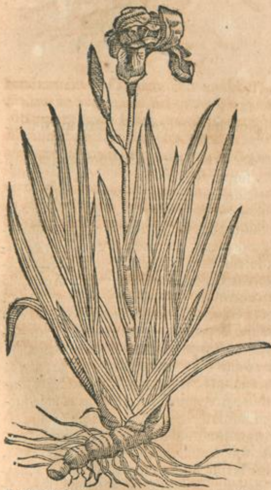
Iridis altera icon.