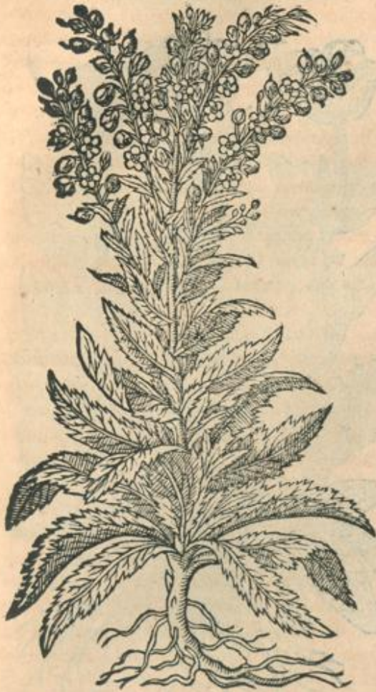
Blattariae altera icon.