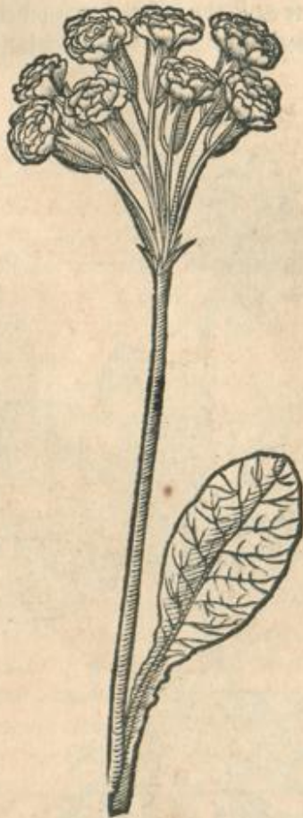
Primulae Veris flos multiplex.