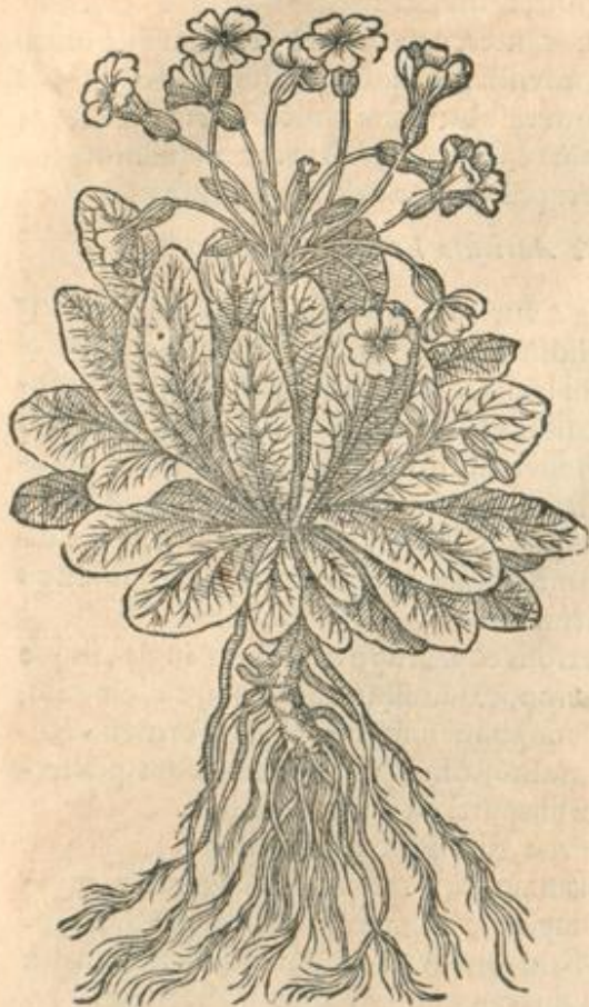
Primula Veris maior.