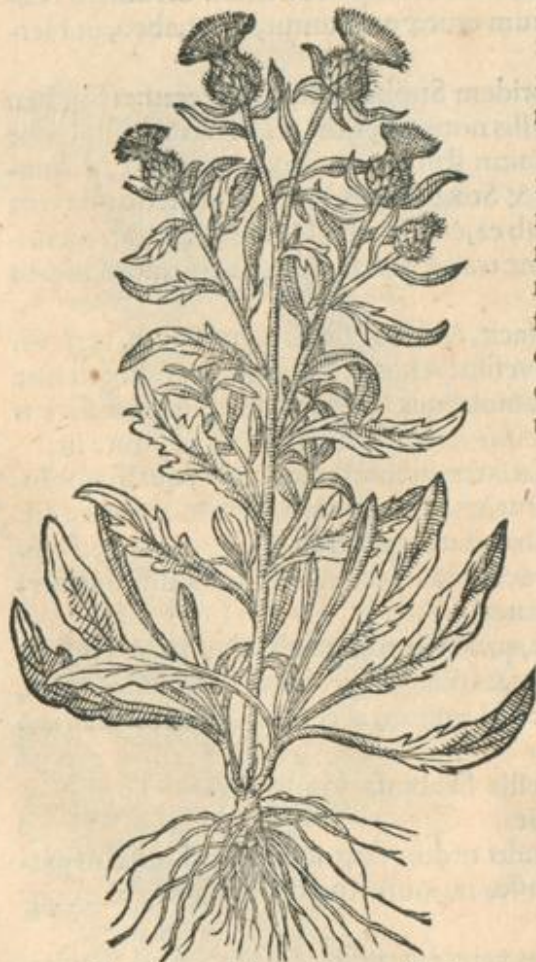
qua radix, non absque aliquot fibris.

purulenta subinde expurgat, ubi videlicet intra corpus abscessus alicubi substiterit. Mederi scabiei, decocto eius aliquot diebus bibito, & succo vnguētis permixto fertur: aduersus serpentū morsus, & virulentorū ictus contusam, superpositamque, atque assumptam conducere, recentiores etiam affirmant. Succus sumptus sudores mouet, praesertim Theriace addita: & pestilentes bubones citò discutit, si tempestiue, & statim ipso initio detur; repetendum tamen remedium: prodesse verò aduersus omnes etiam pestilentes febres creditur.