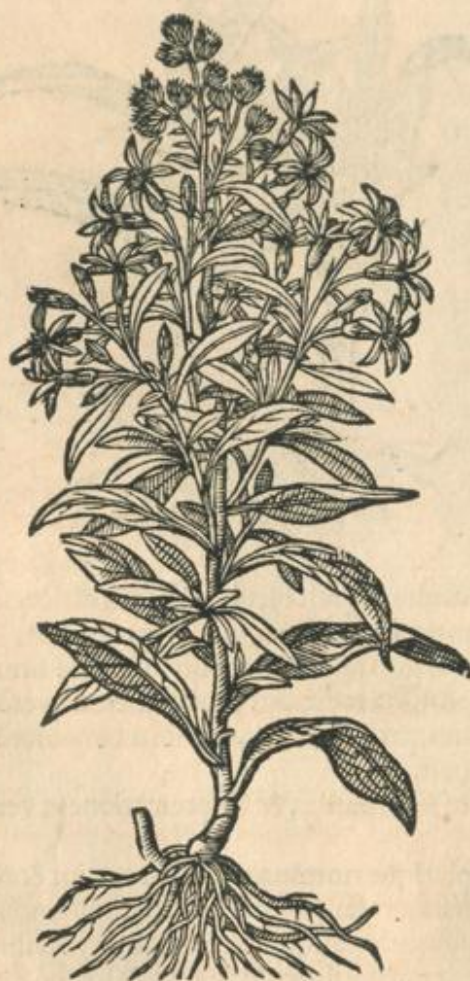
Virga aurea margine crenato.