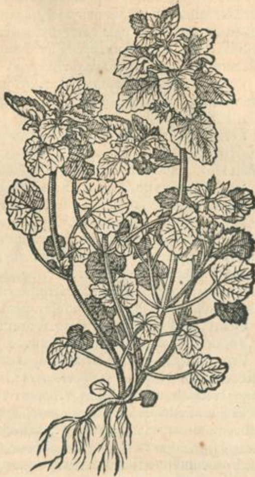
Vrtica iners altera.