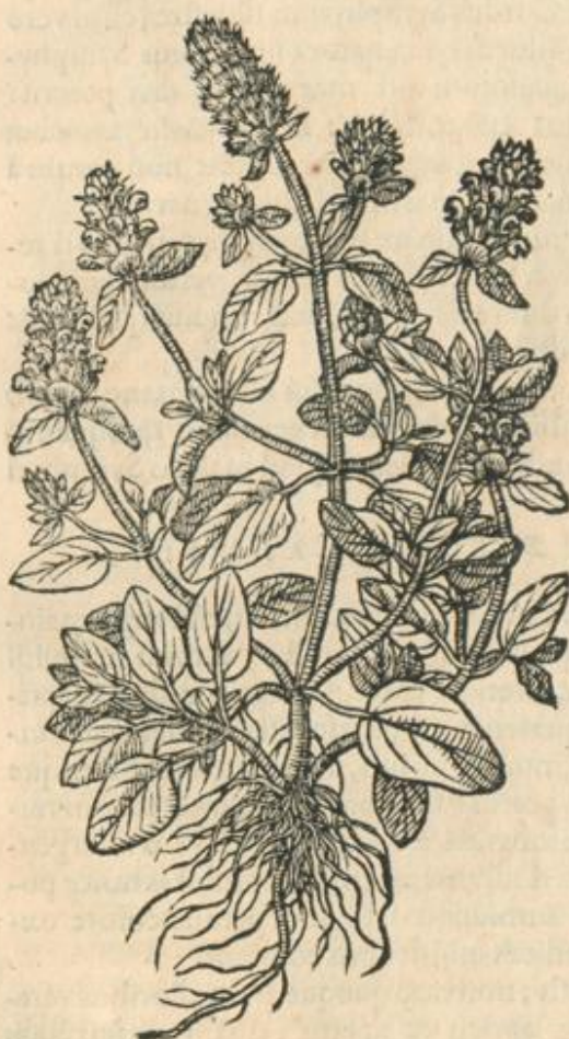
Brunellæ altera icon.