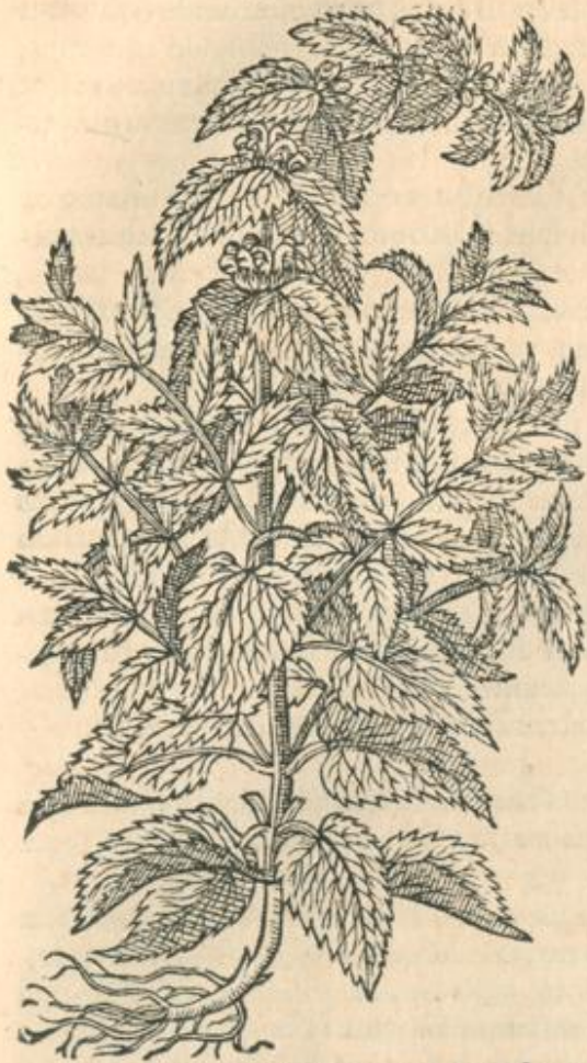
Vrtica iners, siue Lamium primum.