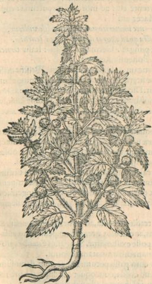
Urtica urens altera.