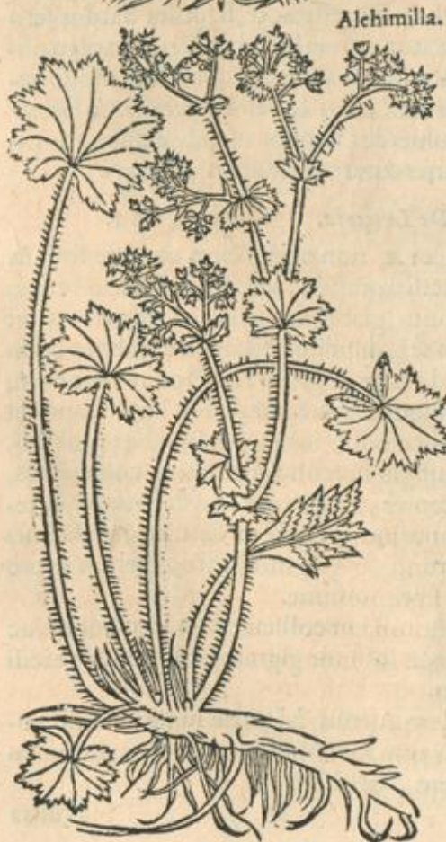
De Alchimilla. CAP. XXIV.

C AULES Alchimillæ dodrantales, rotundi, ramosi, nonnihil hirsuti, frequentius humi decumbunt quàm assurgant, in diuersa tendentes: folia è radicibus maiora, secundum caules minora, lata, rotunda, angulis tamen aliquot, subinde octonis, eminentibus, per margines serrata, Maluæ folijs ferè similia, sed duriora, crispiora, & albidiora, quæ, prius quàm explicentur, plicis complicantur: in ramulis flosculi tenues, paruuli aliquot simul coherent, colore pallidi ac herbacei: semen minutum in exiguis thecis: palmum longitudine radix non rarò æquat, crassitudine ferè digitum, foris nigricans non absque fibris demittitur.