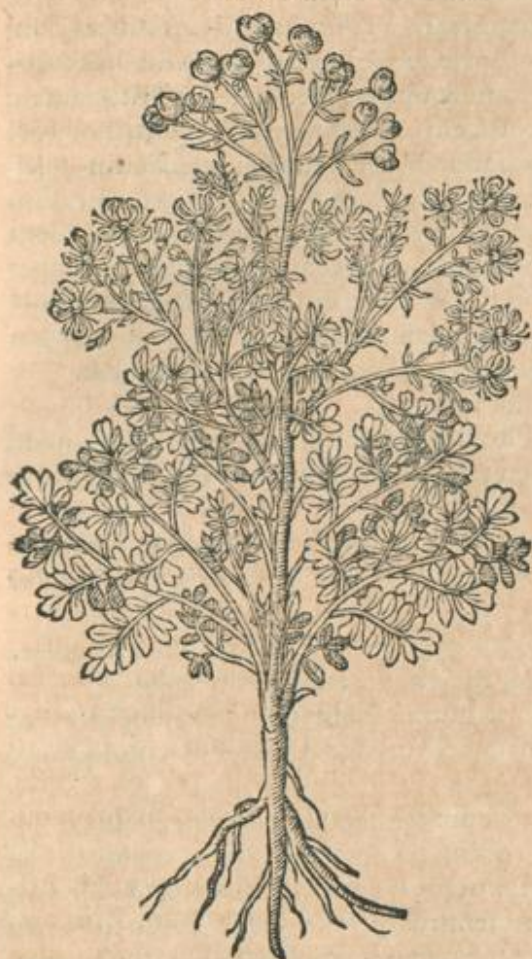
Ruta filueſtris graeolens.