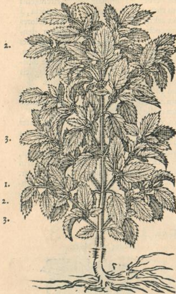
Vrtica vrens minima.

femenè foliorum sinu in pilulis rotundis, maioribus quàm Ochri, nascitur glabrum, splendens, instar semenis Lini, sed tamen minus ac rotundius. radix fibrosa.