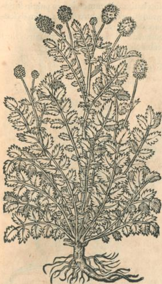
Pimpinella siluestris sanguisorba maior.