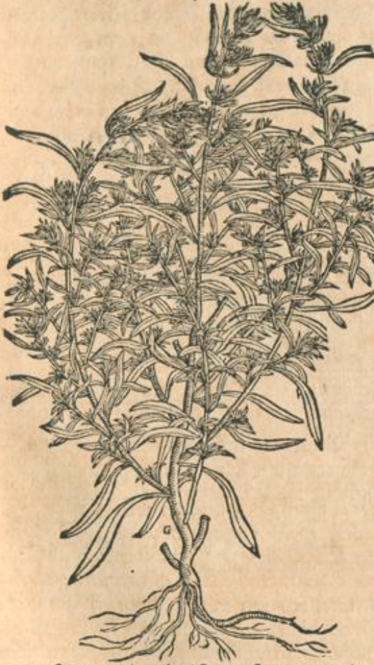
angusta, tenuia veluti Lini: flores exigui, racematim secus folia haerent, herbacei coloris: