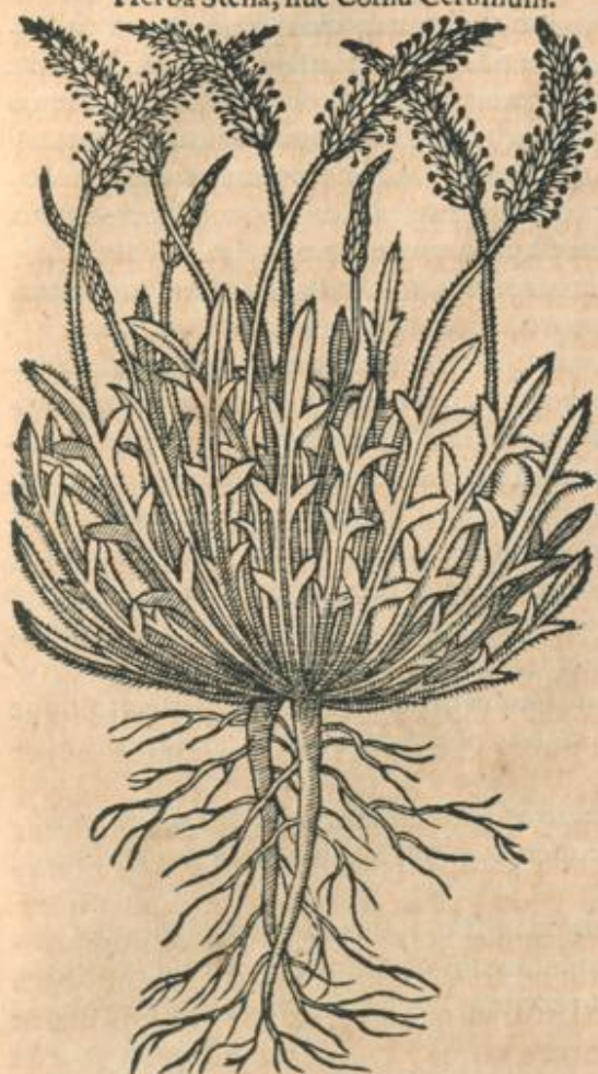
Coronopus ex Cod. Czf.