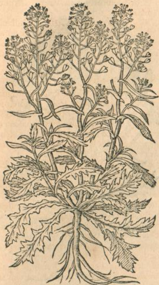
Pastoria bursa minor.