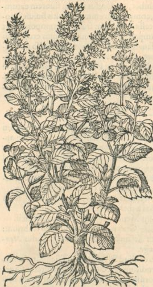
Pulegium siluestre, siue Calamintha altera.