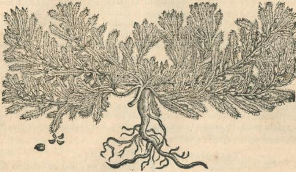
Chamæpitys spuria altera.

Chamæpitys spuria prior, siue Anthyllis altera.