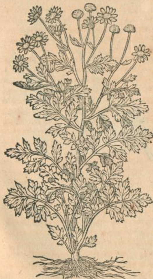
Recentior ætas, Dioscoridis Parthenium Matricariam appellat; plerique Amarellam: Itali

ramulos sublutei, rotundi, muscosi, absque fructu pereunt: subsunt inferius angulosa, terrestres tribuli instar echinata capitula exigua, numquam florentia, in quibus semen nigricans: radix gracilis, palmaris. Inalbicat è virore tota herba, & gratum odorem spirat.