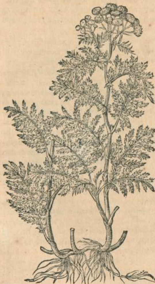
Tanacetum crispum .