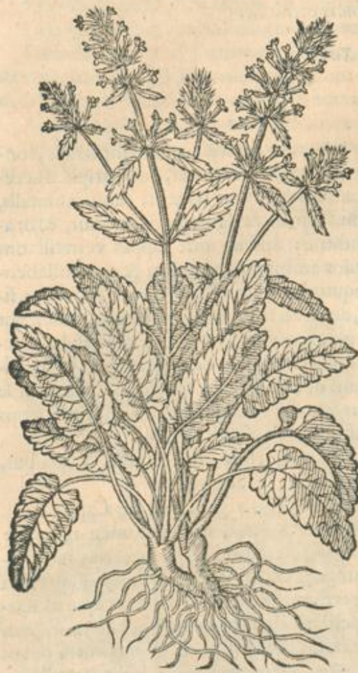
Veronica mas serpens.

non fellis obstructionibus medetur: Regio morbo laborantes reficit, concoctionem ventriculi promouet, acidum eructantibus subuenit, vrinam cit, ad renum & vesicæ dolores utilis, consistentes in renibus calculos rumpit & expellit, menses prouocat, vteri strangulatui medetur, rupta, conuulsæque curat, aduersus serpentum & ferarum morsus, & epota, & vulneribus imposita confert. Laudatur & aduersus Ischiadicos dolores. Aluum dractmarum quatuor pondo sumpta, vt quidem Dios. tradit, subducit. Ex floribus Conserua fit, ad multa utilis, ad capitis tamen dolores præcipuè conferens.