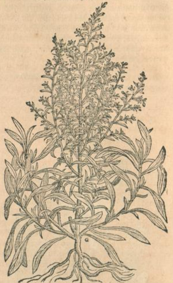
Absinthij angustifolij ramulus foliis fissis.