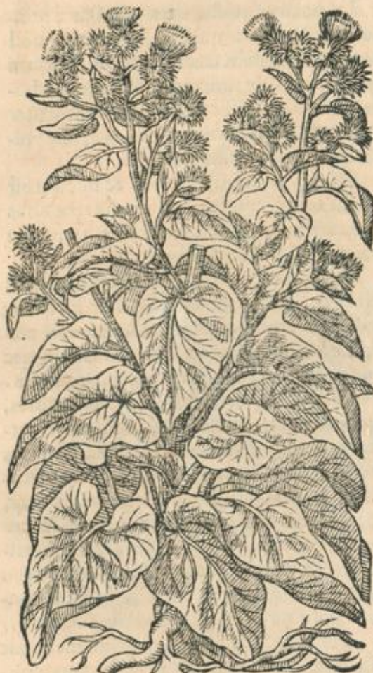
Bardana, siue Lappa maior.

B ARDANA folia initio promit amplissima & hirsuta, longè quàm Cucurbita maiora, ac latiora, crassiora item & nigriora, quæ superiore parte saturatius virent, inferiore nonnihil inalbescant: caulis angulosus, crassus, foliis similibus, sed minoribus longè cingitur, hic in alas & ramulos quamplurimos distributus lappas gignit grandes, globatas, pungentibus exiguis aculeis recurvatis vndique asperas, & transeuntium vestitui inhaerentes, e quibus superius flos exit stamineus, colore purpureus: semen intra globosum capitulum perficitur, quod dehiscens lappis, vna cum lanosis pappis, impellente vento, auolat: radix longa, intus candida, foris nigricat.