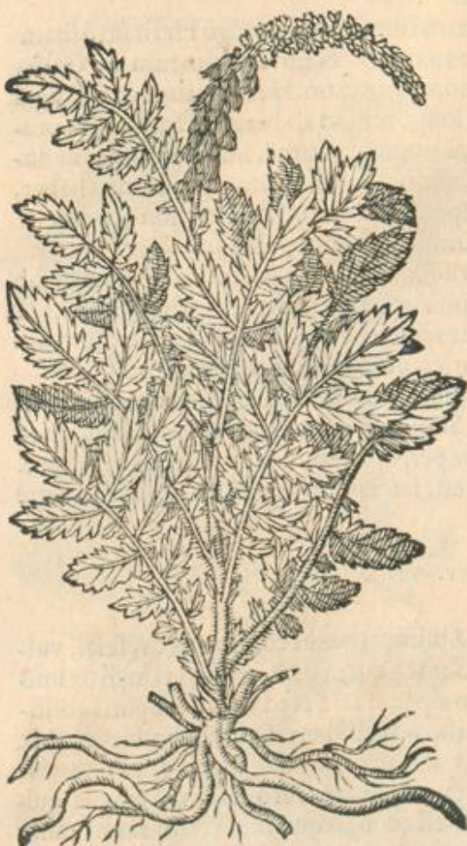
Agrimonia siue Eupatorium.

leio; ipsum nempe Marrubium. Aliud item Hepatorium Officinis, vulgaris videlicet vsus, quod & Hepatorium adulterinum appellatur. Officina Eupatorium Agrimoniam nominant: à nonnullis Ferraria minor dicitur: ab aliis Concordia aut Marmorella. In vetere versione Oribasij de simplicibus lib. 1111. Agrimonia Lappa inuersa nominatur, & Lappa quidem inuersa, quod femina lapparum instar aspera deorsum dependant: Italis quoque Agrimonia : Hispanis Agramonia : Germanis Ydamenge , Bruckwurtz : belgis, Gallis, & Anglis, Agrimonia . Bohemis Stai ut. Differt autem Agrimonia ab Argemone.