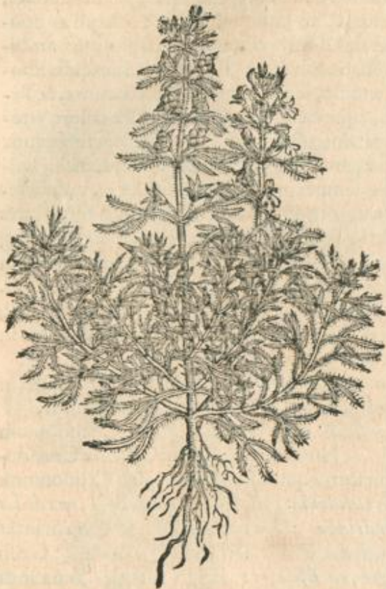
Chamæpityos spuria alterius altera icon.