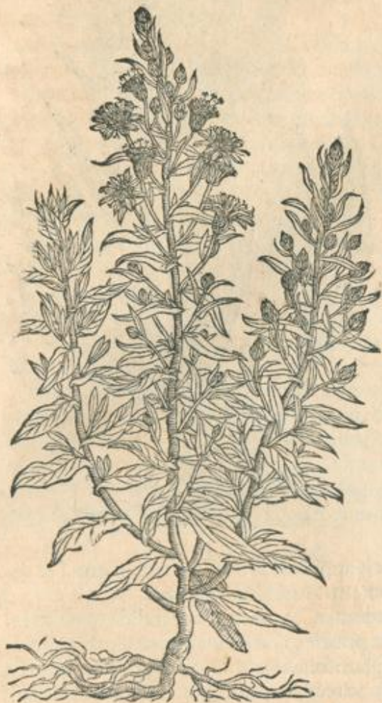
Conyza maior altera.