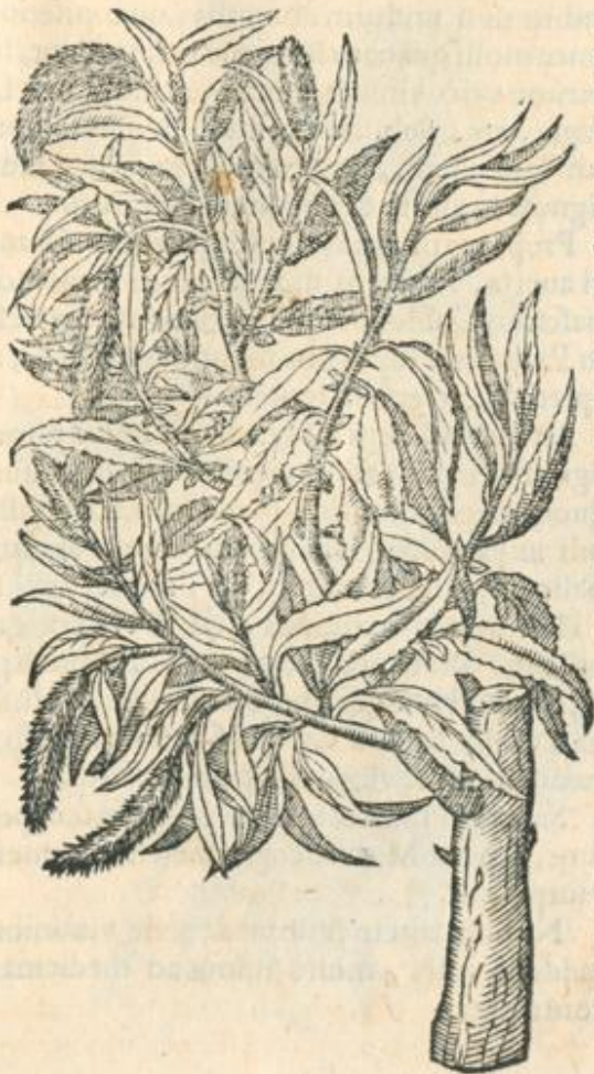
Salix pumila prior.