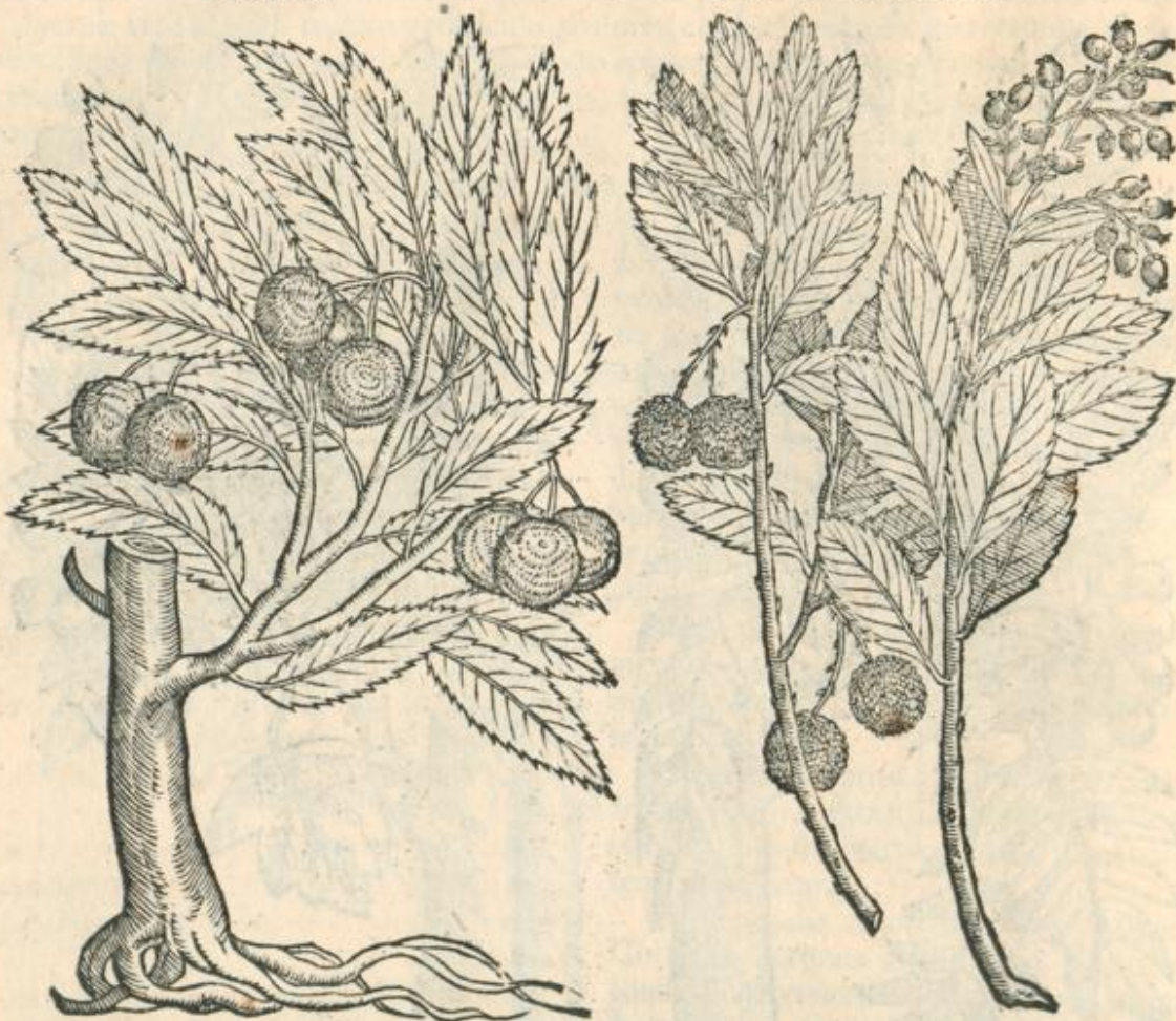
Arbuti ramus cum flore.

parte purpurascens: succedunt fructus è tenuibus dependentes pediculis Fragis similes, sed maiores, magnitudine Sorbi, nullo intus ossiculo, sed exiguis tantummodò seminibus, qui per initia virent, maturi verò eleganti colore rubent; gustu subausteri, ac quasi insipidi, quibus turdi ac merulae per hiemem vescuntur.