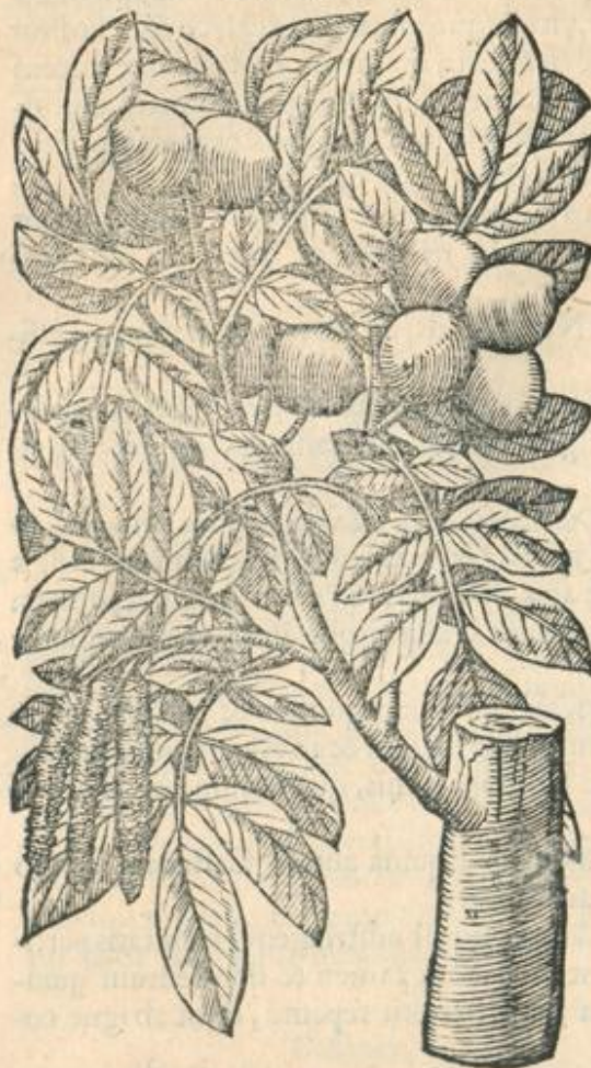
Nux auellana, siue Corylus.