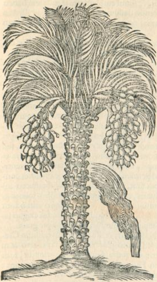
Palmarum fructus &amp; flores cum Elate.