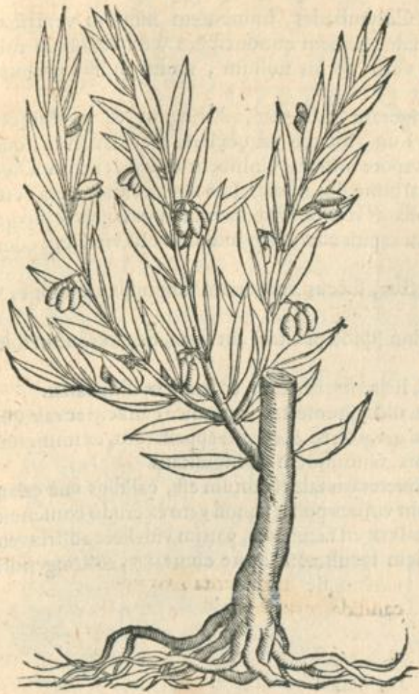
Olea siluestris ramulus.