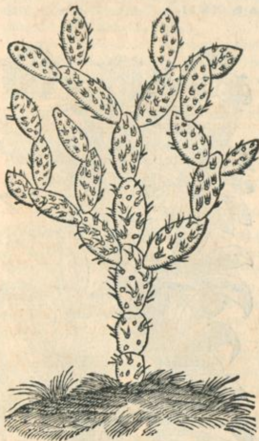
Ficus Indicæ fructus &amp; flos.