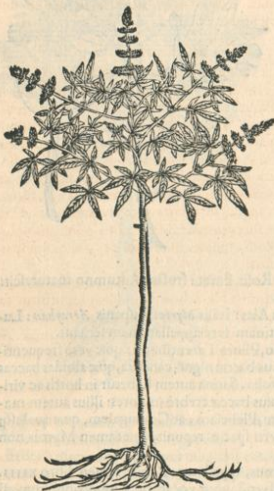
Viticis ramulus cum flore.