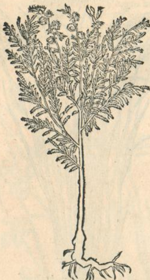
Tamaricis ramulus cum floribus.